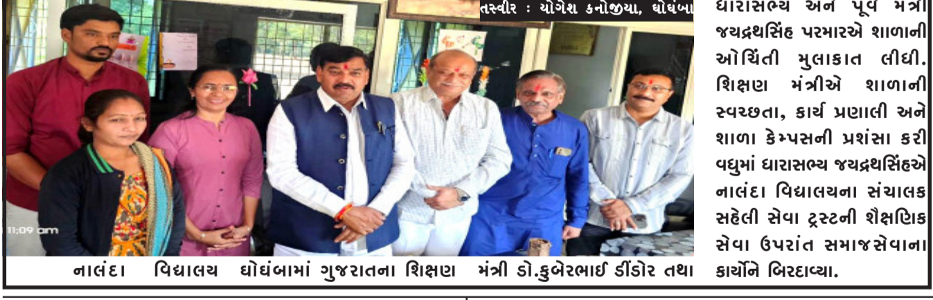
નાલંદા વિદ્યાલય ઘોઘંબામાં ગુજરાતના શિક્ષણ મંત્રી ડો.કુબેરભાઈ ડીંડોર તથા ધારાસભ્ય અને પૂર્વ મંત્રી જયદ્રથસિંહ પરમારએ શાળાની અધિકારી મુલાકાત લીધી. શિક્ષણ મંત્રીએ શાળાની સ્વચ્છતા, કાર્ય પ્રણાલી અને શાળા કેમ્પસની પ્રશંસા કરી વધુમાં ધારાસભ્ય જયદ્રથસિંહએ નાલંદા વિદ્યાલયના સંચાલક સંવેદી સેવા ટ્રસ્ટની શૈક્ષણિક સેવા ઉપરાંત સમાજ સેવાના કાર્યોને બિરદાવ્યા.

નર્મદા જળસંપત્તિ, પાણી પુરવઠા અને કલ્પસર વિભાગ ટુંકી મુદતની જાહેર નિવિદા નં. "૦૨૧" સને ૨૦૨૩-૨૪ ગુજરાત સરકાર