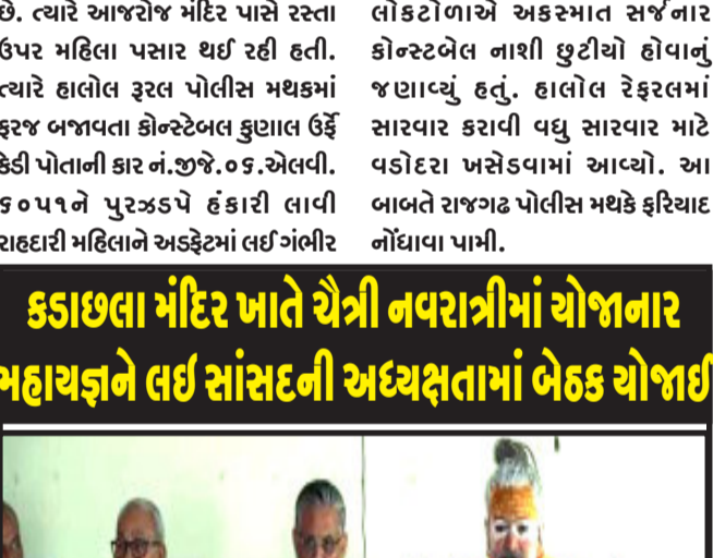
ગોધરા, ચૈત્રી નવરાત્રીમાં કડાછલા મંદિર ખાતે યોજાનાર ૧૦૦૮ અતિરૂઢ મહાયજ્ઞ અને સતચંદ્રી મહાયજ્ઞના આયોજન ભાગરૂપે સાંસદ રતનસિંહ રાહોડ નિવાસસ્થાને બેઠકનું આયોજન કર્યું. વિસ્તારની ધર્મપ્રિય જાહેર જનતા આ મહાયજ્ઞનો સૌથી વધુ લાભ પ્રાપ્ત કરે એ હેતુથી સાથી મિત્રો દ્વારા આગોતરૂ આયોજન કરવામાં આવ્યું હતું.