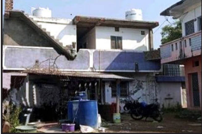
પાવાગઢ, ગોધરા એસ.ઓ.જી. પોલીસ પાવાગઢ ગામ તથા આસપાસમાં આવેલ હોટલ તથા ગેસ્ટ હાઉસમાં ચેકીંગ કરતા ચાર ગેસ્ટ હાઉસમાં મુસાફરોની સોફ્ટવેરમાં