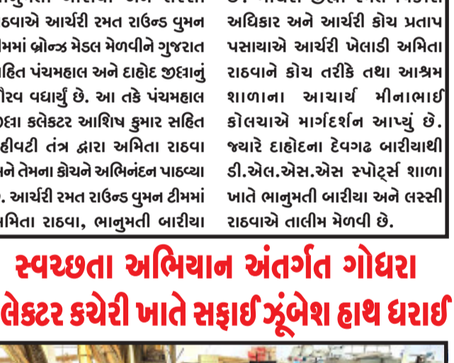
ગોધરા, રાજ્ય સરકાર દ્વારા સમગ્ર રાજ્યમાં સ્વચ્છતા હી સેવા અભિયાનના હેઠળ સ્વચ્છ ગુજરાત ઝુંબેશ હાથ ધરવામાં આવી છે. જેના ભાગરૂપે પંચમહાલ જિલ્લા અને તાલુકા કક્ષાએ સ્વચ્છતા અભિયાનને વધુ અસરકારક બનાવવા માટે વિવિધ સ્વચ્છતાલાક્ષી પ્રવૃત્તિઓ હાથ ધરવામાં આવી રહી છે. રવિવારના દિવસે નક્કી થયેલ મુજબ સરકારી ઈમારતો અને કચેરીઓમાં સ્વચ્છતા અભિયાનના ભાગરૂપે ગોધરા કલેક્ટર કચેરી ખાતે સફાઈ અભિયાન હાથ