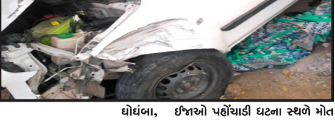
ઘોઘંબા, ઘોઘંબા તાલુકાના ચેલાવાડા ગામે હાલોલ રૂલ પોલીસ મથકના કોન્સ્ટેબલ એ બેફામ કાર ઠંકારી લાવી એક મહિલાને અડફેટમાં લઈ ગંભીર ઈજાઓ પહોંચાડી કાર ચાલક કોન્સ્ટેબલ કાર સ્થળ ઉપર મુકી નાશી છુટીયો હતો.