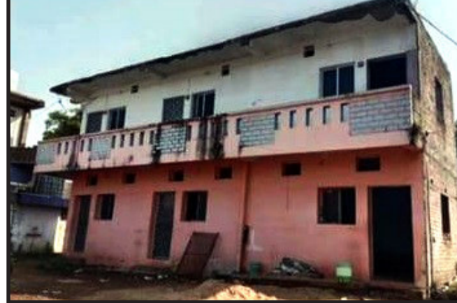
તથા આજુબાજુમાં આવેલ હોટલ તથા ગેસ્ટ હાઉસમાં ચેકીંગ હાથ ધરવામાં આવ્યું હતું. ચેકીંગ દરમિયાન સિદ્ધિ વિનાયક ગેસ્ટ હાઉસ-૧, સિદ્ધી વિનાયક ગેસ્ટ હાઉસ-૨, જયદેવ ગેસ્ટ હાઉસ, અભિલાષા નિવાસ

ઓનલાઈન એન્ટ્રી નહિ કરતા આ બાબતે સંચાલકો વિરૂદ્ધ પાવાગઢ પોલીસ મથકે ફરિયાદ નોંધાવા પામી. પ્રાસ વિગતો મુજબ ગોધરા એસ.ઓ.જી. પોલીસ દ્વારા પાવાગઢ