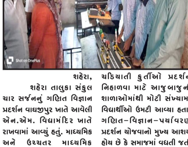
શહેરા, શહેરા તાલુકા સંકુલ ચાર સર્જનનું ગણિત વિજ્ઞાન પ્રદર્શન વાઘજીપુર ખાતે આવેલી એન.એમ. વિદ્યામંદિર ખાતે રાખવામાં આવ્યું હતું. માધ્યમિક અને ઉચ્ચતર માધ્યમિક શાળાઓમાં અભ્યાસ કરતા વિદ્યાર્થીઓએ જતજેટલી કુર્તિઓ ગણિત વિજ્ઞાનની રજૂ કરવામાં આવી હતી.