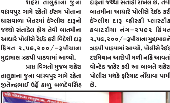
શહેરા, શહેરા તાલુકાના જુના વલ્લવપુર ગામે રહેતો ઈસમ પોતાના ઘાસવાળા ખેતરમાં ઈંગ્લીશ દારૂનો લાભ પ્રાપ્ત કરે એ હેતુથી સાથી મિત્રો દ્વારા આગોતરૂ આયોજન કરવામાં આવ્યું હતું.