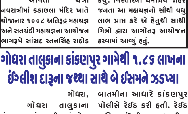
ગોધરા, ગોધરા તાલુકાના કાંકણપુર આંટા ઈળીયામાં રહેતા આરોપી ઈસમે પોતાના રહેણાંક મકાનમાં ઈંગ્લીશ દારૂનો જથ્થો વેચાણ માટે રાખેલ છે. તેવી બાતમીના આધારે પોલીસે રેઈડ કરી હતી. રેઈડ દરમિયાન ઈંગ્લીશ દારૂ, બીચર ટીન મળી કિંમત ૧,૮૬,૯૧૨/- અને રોકડ ૩૨,૧૯,૫૩૨/- ના મુદ્દામાલ સાથે એક ઈસમને ઝડપી પાડવામાં આવ્યો.