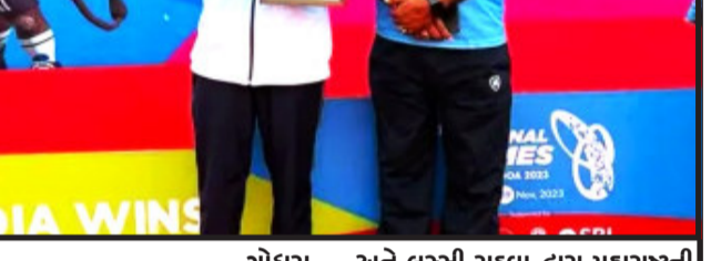
ગોધરા, પ્રધાનમંત્રી નરેન્દ્રભાઈ મોદીએ ૨૬ ઓક્ટોબર ૨૦૨૩ના રોજ ગોવામાં ૩૭મી નેશનલ ગેમ્સનું ઉદ્ઘાટન કર્યું હતું. ગોવાના મહાગાવ ખાતે ૨૬ ઓક્ટોબરથી ૯ નવેમ્બર સુધી ચાલનારા આ રમત મહાકુંભમાં દેશના ૧૦ હજારથી વધુ ખેલાડીઓ ભાગ લઈ રહ્યા છે.