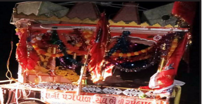
તા. ૧૬ ના બપોરના ત્રણેક

દાહોદ, દાહોદ જીદા ના ગરબાડા તાલુકાના નળવાઈ થી પાવાગઢ પગપાળા જતા એક ગૃપને રાત્રીના સમયે રોડમાં ખાતે અકસ્માત નડતા બે લોકોના મોત નીપજ્યા હોવાનું સામે આવ્યું છે. જ્યારે આ માર્ગ અકસ્માતમાં એકને ગંભીર ઈજાઓ થતા સારવાર માટે વડોદરા ખસેડવામાં આવ્યો હોવાનું જાણવા મળેલ છે.