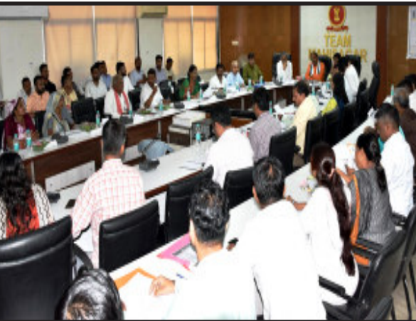
આર્થિક સહાય યોજના, જિલ્લા ગ્રામ વિકાસ એજન્સી કચેરીની યોજનાઓ પ્રધાનમંત્રી આવાસ યોજના (ગ્રામ્ય) મનરેગા, પ્રધાન મંત્રી કૌશલ વિકાસ યોજનાની સમીક્ષા (PMKVY), પ્રધાનમંત્રી જન ઘન યોજના, નગર પાલીકા લુણાવાડા, સંતરામપુર, બાલાસિનોરની પ્રધાનમંત્રી આવાસ યોજના (અર્બન) સ્વચ્છ ભારત મિશન (અર્બન) કામગીરી સમીક્ષા તેમજ