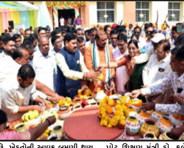
ખેડૂતોની આવક બમણી થાય, ખેડૂતો પ્રાકૃતિક કૃષિ તરફ વળે તથા ખેડૂતો મિલેટ ધાન્ય પાકોનું વધુમાં વધુ વાવેતર કરે જેના અનુસંધાને સરકાર દ્વારા જન જાગૃતિ હેતુ સતત અભિયાનો ચાલી રહ્યા છે. આ પ્રસંગે આદિજાતિ વિકાસ, પ્રાથમિક, માધ્યમિક અને