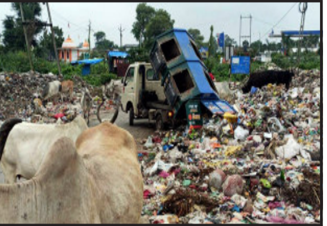
અભિયાનના ખુલ્લેઆમ ધજાગરા. ભરમારના કારણે ભયંકર સંજેલી માંડલી રોડ પર ગંદકી

દહેશત સંજેલી પંચાયત તંત્ર સ્વચ્છતા રાખવા માટેની કામગીરીમાં શૂન્ય. હાલ સંજેલી પંચાયત દ્વારા ડોર ટુ ડોર કલેક્શન કરાતો સૂકો અને ભીનો કચરો સંજેલી મુખ્ય માર્ગ પર જ નવીન બસ સ્ટેશન ગેટ પાસે રોડ પર જ ઠાલવવામાં આવી રહ્યો છે. જેના કારણે નવીન બસ સ્ટેશનના માંડલી રોડ તરફ જતા માર્ગની પ્રવેશદાર પર જ ગંદકીનું સામ્રાજ્ય અને રોગચાળો વધુ વકરવાની દહેશત ઊભી થવા પામી છે. જેના કારણે રસ્તે જતા શાળાના