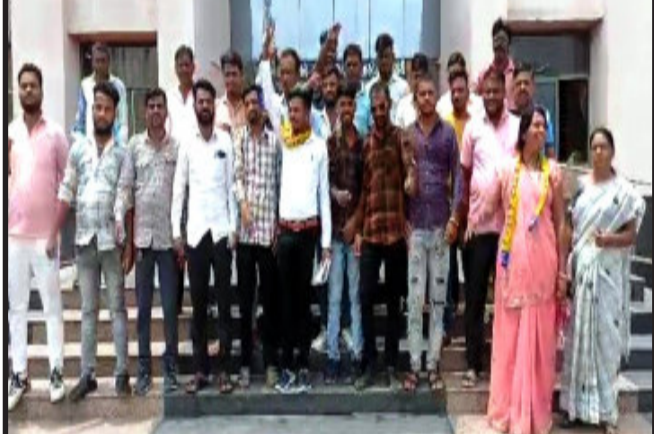
દાહોદ, દાહોદ જીલ્લાના સંજેલી તાલુકાના આમ આદમી પાર્ટી દ્વારા UCC વિરોધ કરી નારા સાથે મામલતદાર કચેરીએ પહોંચ્યા અને સંજેલી નગરના આમ આદમી પાર્ટીના કાર્યકર્તાઓ સંજેલી મામલતદાર કચેરી પહોંચી આવેલ પાઠવી વિરોધ કરવામાં આવ્યો હતો. આદિવાસી સમાજને ગંભીર નુકસાન થાય ઇનાવવાઈ જાય તેવું અમને એવું અમને લાગે છે. જેના હાલ તારણ કરવામાં આવ્યું છે. જેથી અમે તેનો વિરોધ કરીએ છીએ, તેનો વિરોધ