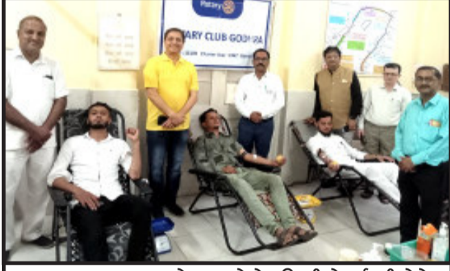
ગોધરા, રેલ્વે અધિકારીઓ, કર્મચારીઓ તેમજ રોટરી કલબ હિતાંશી ફાઉન્ડેશન સંયુક્ત ઉપક્રમે ગોધરા રેલ્વે હોસ્પિટલ ખાતે રક્તદાન કેમ્પનું આયોજન કરવામાં આવ્યું હતું. ગોધરા રેલ્વે હોસ્પિટલ ખાતે યોજવામાં આવેલ રક્તદાન કેમ્પ