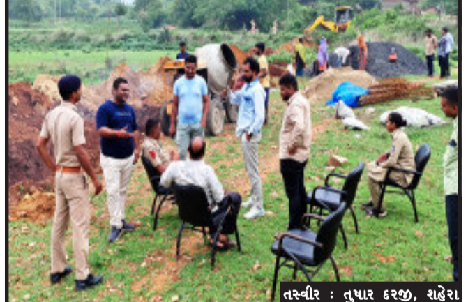
તસ્વીર : તુષાર દરજી, શહેરા

શહેરા, શહેરા નગરના પરા વિસ્તારમાં પટિયા ગામ પાસે પસાર થતા ડામર રસ્તાને અડીને સ્વચ્છ ભારત મિશન અંતર્ગત ઘન કચરાના નિકાલ માટે સરકાર દ્વારા ત્રણ હેક્ટર જમીન વર્ષ ૨૦૨૦માં ફળવવામાં આવી હતી. નગર પાલિકા પોલીસ બંદોબસ્ત સાથે કંપાઉન્ડ વોલની કામગીરી શરૂ કરવામાં આવી હતી.