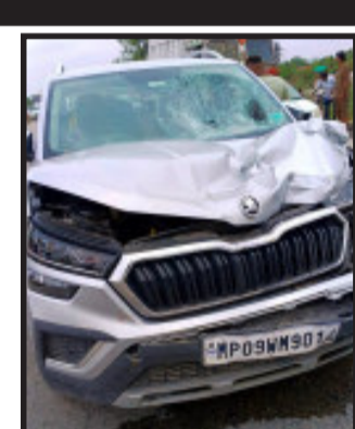
મંદિરે મોપેડ ટુ વ્હીલર ગાડી પર સવાર થઈ દર્શન માટે ગયા હતા અને મંદિરે હાઈવે ઉપર આવેલ ગંભીર ઈજાઓ પહોંચતા ઘટના સ્થળે મોત નીપજ્યાનું જાણવા મળે છે.

દાહોદ, દાહોદ શહેરમાંથી પસાર થતાં ઈન્દોર અમદાવાદ હાઈવે ઉપર એક ફોરવ્હીલર ગાડીના ચાલકે એક મોપેડ પર સવાર દંપતીને અડકેટમાં લેતા જોશભેર ટક્કર મારી નાસી જતા દંપતિને શરીરના ભાગે ગંભીર ઈજાઓ પહોંચતા ઘટના સ્થળે મોત નીપજ્યાનું જાણવા મળે છે.