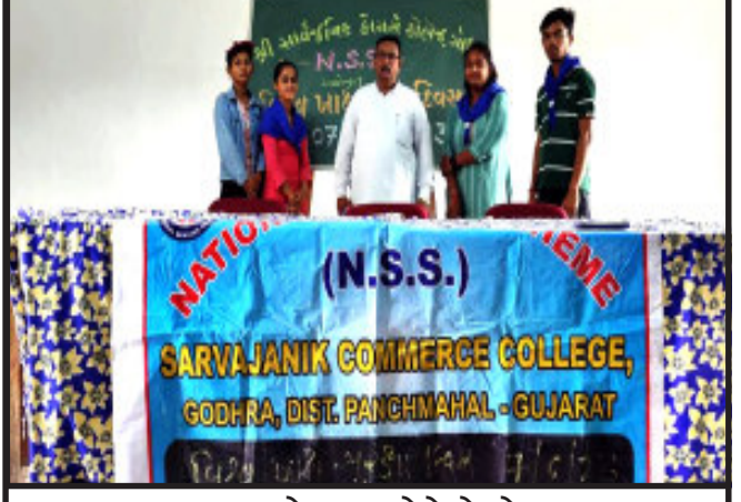
ગોધરા, શકે કે ભેગભેગ વાળા સસ્તા ખાદ્ય પદાર્થો છે કે પછી બજારમાં લારીઓ પર વેચાતા દૂધ, ખાદ્ય તેલ, મીઠાઈઓ કે બેકરીની જે વસ્તુઓ છે. પાન-મસાલા, ગુટખા વિગેરે અંગે લોકોને જાગૃત કરવા વિદ્યાર્થીઓએ આગેવાની લેવાની જરૂર છે તેવું જણાવતા વધુમાં ડો. સોલંકી જણાવ્યું હતું કે, ખાસ કરીને ઠેર ઠેર ફૂટી નીકળી કેરીના રસની હાટડીઓ એટલે કે મેંગો જ્યુસ એના પર પણ વિદ્યાર્થીઓએ નજર રાખવાની જરૂર છે. કાર્યક્રમની આભાર વિધિ એનએસએસ લીડર બની શકે છે. ફૂડ પોઈઝનિંગ થઈ