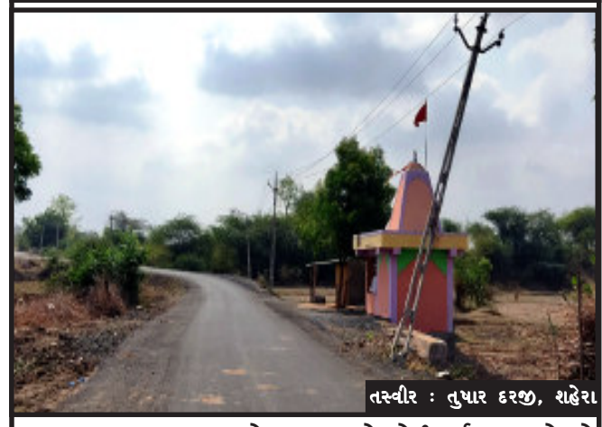
તસ્વીર : તુષાર દરજી, શહેરા

શહેરા, શહેરા તાલુકાના સંભાલી ગામના બસ સ્ટેશન નજીક હરસિદ્ધી માતાજીના મંદિર પાસે પસાર થતા ડામર રોડને અડીને પાછલા એક મહિના ઉપરાંત થી જીવંત વીજ વાચર વાળો વિજ થાંભલો નીચેથી તૂટી જવા સાથે નમી ગયો છે. સતત વાહનોની અવર જવર વાળા ડામર રસ્તા પર હોવા સાથે તૂટી ગયેલ વીજ થાંભલાના કારણે કોઈ દુર્ઘટના બને તો જવાબદાર કોણ તેવા અનેક સવાલો સ્થાનિક ગ્રામજનોમાં ચર્ચાઈ રહ્યા હતા. એમ.જી.વી.સી.એલ. તંત્ર દ્વારા રોડને અડીને થાંભલા એક તૂટી ગયેલ વીજ થાંભલો દૂર કરીને નવો વીજ થાંભલો વહેલી તકે નાખવામાં આવે તેવી આશા અહીંથી પસાર થતા વાહન ચાલકોને સ્થાનિક ગ્રામજનો રાખી રહ્યા છે.