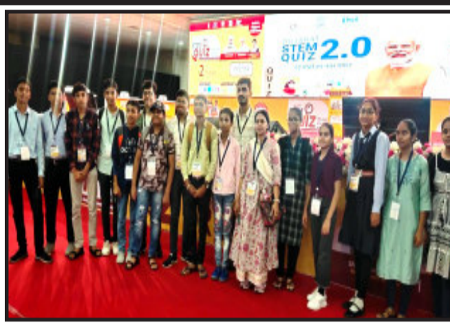
આ સ્પર્ધામાં ભાગ લેવાવામાં આવ્યો હતો. જેમાંથી ૧૯ પસંદ થયેલા બાળકોએ ઉત્સાહભરે

લુણાવાડા, DSI, ગુજકોસ્ટ તથા સાયન્સ સીટી અમદાવાદના સંયુક્ત ઉપક્રમે રાષ્ટ્રીય ક્ષાની સૌથી મોટી સાયન્સ ક્વિઝ STEM 2.0 અમદાવાદમાં સાયન્સ સીટી ખાતે યોજાઈ હતી. જેમાં દેશના વિવિધ રાજ્યોમાંથી ૧ લાખ કરતા પછા વધુ બાળકોએ રજીસ્ટ્રેશન કરાવ્યું હતું. જેમાંથી રાષ્ટ્રીય ક્ષાએ ટોપ ૧૦૦૦ બાળકો ઉત્તીર્ણ થયા હતા. જેમાં મહિસાગર જીદા વિવિધ તાલુકાઓમાંથી મહિસાગર જીદા લોકવિજ્ઞાન કેન્દ્ર દ્વારા બાળકોને