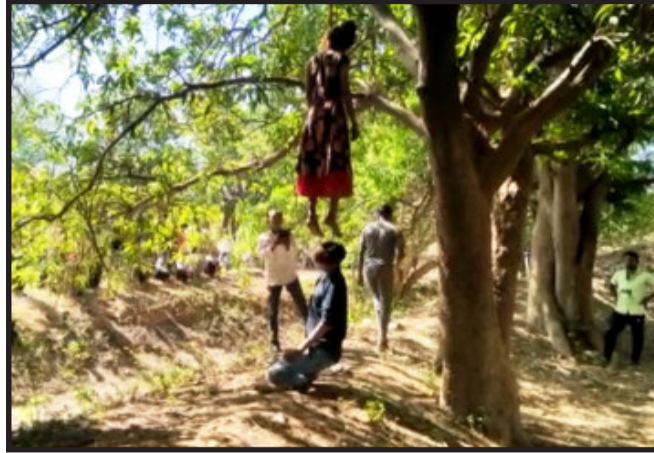
ઝાડની ડાળીએ લડકતી હાલતમાં યુવક-યુવતીનો મૃતદેહ મળી વિસ્તારમાં ચકચાર મચી જવા પામ્યો છે.

લુણાવાડા, મહિસાગર જિલ્લામાં એક ચૌકાવનારી ઘટના સામે આવી છે. એક વૃક્ષના ડાળ પર યુવક-યુવતીનો ગળેફાંસો ખાધેલી હાલતમાં મૃતદેહ મળી આવતા ચકચાર મચી જવા પામ્યો છે. એક જ રસ્તી વડે યુવક અને યુવતીનો ફાંસો ખાધેલી હાલતમાં આ મૃતદેહો મળી આવ્યા. ખાનપુર તાલુકાના મૈયાપુર ગ્રામ પંચાયત વિસ્તારના વાવ્યો ગામની સીમમાં એક વૃક્ષ ઉપર ગળેફાંસો ખાધેલી હાલતમાં યુવક-યુવતીનો મૃતદેહ મળી આવ્યો છે. ખેતરમાં આંબાના