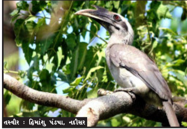
તસ્વીર : હિયાંશુ પંડ્યા, નદીસર

નદીસર, ગોધરા તાલુકાના નદીસર પંથકમાં બે ત્રણ વર્ષ થી મોટા ભાગે જંગલોમાં જોવા મળતા અને ઘણા વર્ષો થી તે પક્ષી મોટાભાગે રહેણાક વિસ્તારમાં જોવા મળતું મળતું તેવું ચીલોગો પક્ષી લગભગ રોજ વહેલી સવારથી બપોર સુધી વિવિધ વિસ્તારો માં જોવા મળતા જાણકારો અને પક્ષી વિદો માં આનંદ જોવા મળ્યો છે.