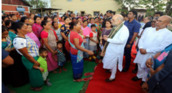
એક્સ-ગ્રેશિયા અને પરિવારના એક સભ્યને નોકરી આપવાની જાહેરાત કરી છે.

ઈસ્લાહ, કેન્દ્રીય ગૃહમંત્રી અમિત શાહ મણિપુરના પ્રવાસે છે. આ દરમિયાન એક પત્રકાર પરિષદને સંબોધતા તેમણે કહ્યું કે, જ્યારથી મણિપુરમાં બીજેપીની ડબલ એન્જિન સરકાર બની છે ત્યારથી રાજ્ય વિકાસના પંથે આગળ વધી રહ્યું છે. પરંતુ ભૂતકાળમાં બનેલી હિંસક ઘટનાઓમાં અહીં અનેક લોકોએ જીવ ગુમાવ્યા હતા. અમે મણિપુરમાં શાંતિ પુનઃસ્થાપિત કરવા માટે કામ કરી રહ્યા છીએ. આ હિંસાની તપાસ હાઈકોર્ટના નિવૃત્ત જજ દ્વારા કરવામાં આવશે. આ હિંસાની તપાસ માટે એક શાંતિ સમિતિની રચના કરવામાં આવી રહી છે.