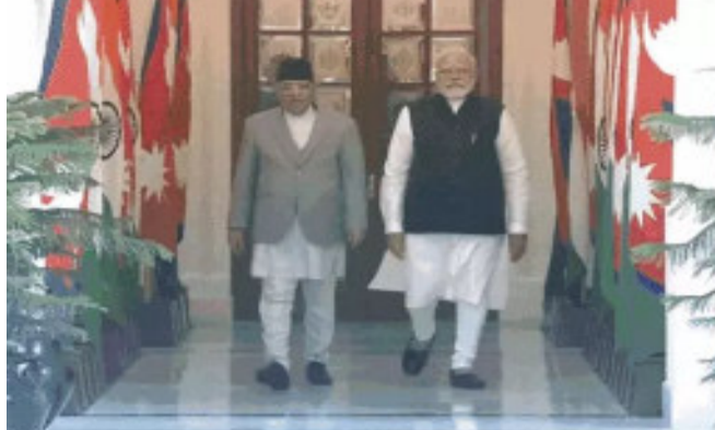
નેપાળના પીએમ પ્રચંડે પ્રેસ કોન્ફરન્સમાં કહ્યું- મેં મોદીજી સાથે સરહદ વિવાદ પર ચર્ચા કરી હતી. હું તેમને અપીલ કરું છું કે આ મામલો દિપ્લોમેટીક વાતચીત દ્વારા ઉકેલવો જોઈએ. આ સાથે જ પીએમ પ્રચંડે વડાપ્રધાન મોદીને નેપાળ આવવાનું આમંત્રણ આપ્યું હતું. હૈદરાબાદ

આજે હું કહી શકું છું કે અમારો સંબંધ હિટ છે. નેપાળના લોકો માટે નવા રેલ રૂટ શરૂ કરવામાં આવશે. આ સિવાય ત્યાં રેલ્વે કર્મચારીઓને પણ ટ્રેનિંગ આપવામાં આવશે. આ પહેલા ગુરુવારે પીએમ પ્રચંડે રાજઘાટ પહોંચ્યા અને મહાત્મા ગાંધીને શ્રદ્ધાંજલિ આપી. પીએમ પ્રચંડના માનમાં હૈદરાબાદ હાઉસમાં વિશેષ લંચનું પણ આયોજન કરવામાં આવ્યું છે. પ્રચંડ બપોર પછી રાષ્ટ્રપતિ દ્રોપદી મુર્મુ અને ઉપરાષ્ટ્રપતિ જગદીપ ધનખરને પણ મળશે. નેપાળના વડાપ્રધાન તરીકે પ્રચંડની આ ચોથી ભારત મુલાકાત છે. તે બુધવારે બપોરે ૩ વાગ્યાની આસપાસ ભારત પહોંચ્યા હતા. ભારતના સાંસ્કૃતિક રાજ્ય મંત્રી મીનાક્ષી લેખીએ તેમનું સ્વાગત કર્યું હતું. પ્રચંડે નવી દિલ્હીમાં નેપાળ-ભારત સંબંધોમાં અવરોધ ન બનવી જોઈએ.