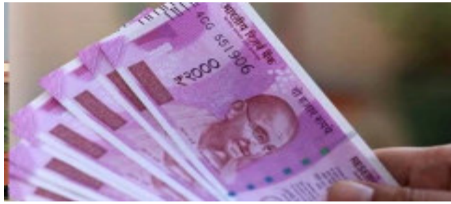
વિના જ ભષ્ટાચારી અને રાષ્ટ્રવિરોધી તત્વોને નોટો બદલીને ફાયદો થઈ રહ્યો છે. ૨૮ મેના રોજ દિલ્હી હાઈકોર્ટે અરજીને નીતિ વિષયક ગણાવીને ફગાવી દીધી હતી.

નવીદિલ્હી, સુપ્રીમ કોર્ટે ઓળખ કાર્ડ બતાવ્યા વિના ૨ હજાર રૂપિયાની નોટ બદલવા વિરુદ્ધની અરજી પર તાત્કાલિક સુનાવણી કરવાનો ઈનકાર કરી દીધો છે. વાત જાણે એમ છે કે, સુપ્રીમ કોર્ટની વેકેશન બેન્ચે કહ્યું કે, આ એવો મામલો નથી કે જેની તાત્કાલિક સુનાવણી કરવાની જરૂર છે. અરજદારે ઉનાળાના વેકેશન પછી ચીફ જસ્ટિસ પાસે સુનાવણીની વિનંતી કરવી જોઈએ. નોંધપાત્ર છે કે, આ પહેલા દિલ્હી હાઈકોર્ટે આ અરજી ફગાવી દીધી હતી. અરજદારને તેને પડકારવા માટે સુપ્રીમ કોર્ટમાં પહોંચ્યા છે.