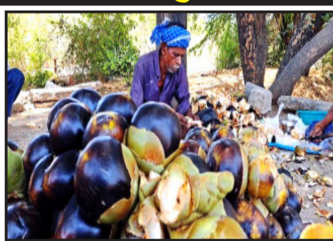
તાડના વૃક્ષનું આયુર્વેદમાં મૂળ જ મહત્વ દર્શાવવામાં આવ્યું છે.

માનવામાં આવે છે આ ઉપરાંત ગિલોરા માંથી ફળ બહાર કાઢવામાં પણ ખૂબ જ મહેનત કરવી પડે છે જેથી તાડ ફળી આરોગતા શોખીનો વેચાણ કરતાં વેપારીઓમાં સાથે ભાવ તાલ ના કરે એ પણ એક ઈચ્છનીય બાબત કહી શકાય. તાડના વૃક્ષનું આયુર્વેદમાં મૂળ જ મહત્વ દર્શાવવામાં આવ્યું છે. પરંતુ જે પૈકી એકમાત્ર તેના ફળ તાડ માટે મોકલી રહ્યા છે, જોકે સસ્તા ભાવે ઉપરાંત અહીંથી તાડફળી વડોદરા સહિતના માર્કેટમાં પણ ખેડૂતો વેચવા માટે મોકલી રહ્યા છે. જોકે સસ્તા ભાવે મળી રહેલી અને મીઠી લાગતી તાડ ના ફળ વૃક્ષ ઉપરથી ઉતારવા માટે ખૂબ જ કઠિન અને પડકાર જનક પણ