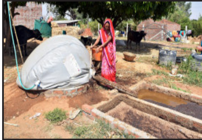
દાહોદ, દાહોદ જિલ્લામાં સૌ પ્રથમવાર સ્વચ્છ ભારત મિશન (ગ્રામીણ) યોજના અંતર્ગત ગોબરધન પ્રોજેક્ટ થકી લીમખેડા તાલુકાના ગામોમાં ૨૦૦ જેટલા કલસ્ટર બેઈઝ વ્યક્તિગત ફલેક્ષી બાયોગેસ પ્લાન્ટ ઇન્સ્ટોલ કરવામાં આવ્યા છે. લીમખેડામાં આ પ્રોજેક્ટની સફળતા બાદ ધાનપુર તેમજ દેવગઢ બારીયામાં પણ આટલા જ પ્લાન્ટ ઇન્સ્ટોલ કરવાની કામગીરી પણ ટૂંક સમયમાં પ્રારંભ કરાશે. આ એક જ પ્રોજેક્ટ થકી ૫૫૫ પશુપાલકોને નિઃશુલ્ક રાધાણગેસ ઉપરકાંત રોજગારી, આપક, આરોગ્ય સહિતના લાભો થઈ રહ્યાં છે.

દાહોદ જિલ્લાના લીમખેડા તાલુકાના કુલ ૬ ગ્રામ પંચાયતોમાં કલસ્ટર બેઈઝ વ્યક્તિગત ફલેક્ષી બાયોગેસ પ્લાન્ટના કુલ ૨૦૦ લાભાર્થીઓનો લક્ષ્યાંક પૂર્ણ કરવામાં આવેલ છે. જેમાં દમખ ખાણ અમલીકરણ એજન્સી દ્વારા હાલમાં દાહોદ જિલ્લામાં કુલ ૨૦૦ લાભાર્થીઓના ઘરે ફલેક્ષી બાયોગેસ પ્લાન્ટના લાંબા સમય સુધી નિઃશુલ્ક ફરેટી રાંધણ ગેસ મળી રહેશે. આ ફરેટી ગેસ સંપૂર્ણ સુરક્ષિત અને સલામત છે. દર માસે બે થી ત્રણ એલ.પી. બોટલ જેટલો ગેસ ઉત્પાદન થાય છે. સાથે સાથે સ્વેલી પણ ઉપજે છે. આ સ્વેલીને ખેતરમાં ઓર્ગેનિક ખાતર તરીકે પણ ઉપયોગ કરી પૂલ સાડે ઉત્પાદન મેળવી શકાય