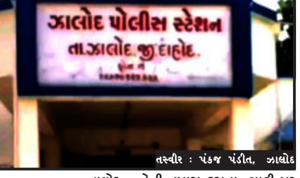
તસ્વીર : પંકજ ચંડીત, ઝાલોદ

ઝાલોદ, તારીખ ૨૩-૦૫-૨૦૨૩ હુદીકંકાસીયા ચેક પોસ્ટ પર સી.પો.સ.ઈ જી.બી.રાહવા તેમજ અન્ય પોલીસ સ્ટાફ હુદીકંકાસીયા ચેક પોસ્ટ પર હાજર હતા તે દરમિયાન ડુંગરા ( રાજસ્થાન ) થી ઝાલોદ તરફ એક ચુવક GJ.20.BA.8028 નંબરની કાળા કલરની ટી.વી.એસ કંપનીની એટોર્ક ટુ વ્હીલર લઈને આવતો હતો. આ ગાડી ચાલક પર શંકા જતાં પોલીસ દ્વારા ઉભો રાખી