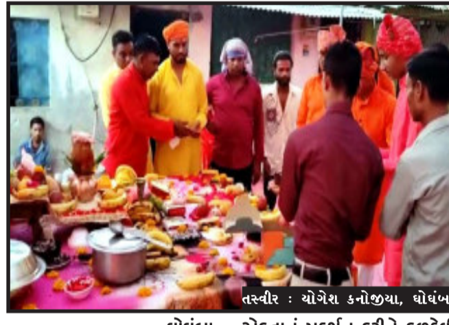
તસ્વીર : યોગેશ કનોજીયા, ઘોંબા

ઘોંબા, ઘોંબા ગામના ઓડ સમાજના લોકો દ્વારા કુળદેવી લાખુમાના જન્મદિવસ નિમિત્તે પૂજા અને હવનની વિધિ કરવામાં આવી. ઓડ સમાજ કદાપ પરિવાર દ્વારા દર વર્ષે કુળદેવી માતાની પૂજા અર્ચના અને હવન વિધિ કરવામાં આવે છે. આજના દિવસે સમગ્ર સમાજ દ્વારા એકતાનું પ્રદર્શન કરીને કુળદેવી લાખુમાના જન્મદિવસની ઉજવણી કરી હતી. ઓડ સમાજના આગેવાનો, ભાઈ-બહેનો, વડીલો અને બાળકો સાથે મોટા સમૂહમાં જનમેદની ઉમટી હતી. સમગ્ર પૂજન પ્રક્રિયા થયા બાદ માતાની પૂજા અર્ચના અને હવન વિધિ કરવામાં આવે છે. આજના દિવસે સમગ્ર સમાજ દ્વારા