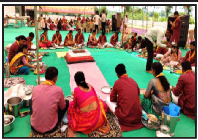
કરવામાં આવેલ હતું. મહાદેવના મંદિરના પ્રાણ પ્રતિષ્ઠાને લઈને પાદેડી રામપુર ગામના યુવા મિત્રો, વડીલો તેમજ ભક્તજનોમાં અનેરો ખુશીનો માહોલ જોવા મળ્યો હતો. આ પ્રસંગે મંદિર ખાતે ત્રણ દિવસથી વિવિધ કાર્યક્રમોનું આયોજન કરવામાં આવેલ હતું. જેમાં શોભાયાત્રા, જળ યાત્રા, ટેવોની સ્નાન વિધિ, સાચ પુજન આરતી, પ્રાણ પ્રતિષ્ઠા, મહા આરતી, મહા પ્રસાદ વગેરે કાર્યક્રમોનું આયોજન કરવામાં આવેલ છે. જ્યારે પંચમહાલના

મલેકપુર, મહિસાગર જિલ્લાના લુણાવાડા તાલુકાના પાદેડી રામપુર ગામ ખાતે આવેલા સિદ્ધેશ્વર મહાદેવના મંદિર ખાતે ત્રિદિવસીય પ્રાણ પ્રતિષ્ઠા મહોત્સવનું આયોજન કરવામાં આવ્યું હતું. પાદેડી રામપુર ગામના બસ સ્ટેશન ખાતે આવેલ ૫૦૦ વર્ષ જૂના સિદ્ધેશ્વર મહાદેવ ભગવાનનું પૌરાણિક મંદિર આવેલ હતું. જ્યારે આ મંદિરનું ગ્રામજનો તેમજ ભક્તજનો દ્વારા નવ નિર્માણ કરવામાં આવેલ હતું અને મંદિરનું નવનિર્માણ કામગીરી પુર્ણ થતા ગ્રામજનો દ્વારા પ્રાણપ્રતિષ્ઠા કાર્યક્રમનું આયોજન ત્રણ દિવસ સુધી વિવિધ કાર્યક્રમોનું આયોજન