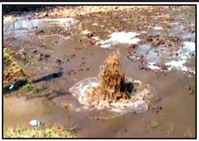
સર્જાયું હતું. જે સંલગ્ન વિભાગ દ્વારા તેનું રીપેરીંગ કરવામાં આવ્યું હતું. અત્રે ઉદ્ધેખની છેકે, ભરઉનાળામાં એક તરફ દાહોદ

દાહોદ, ગરબાડા તાલુકાના દાદુર ગામ ખાતે દિવ્ય જ્યોત શાળાની સામે ગાંગરડી આવતા રોડ ઉપર નર્મદાના પાણીની હાફેશ્વર યોજનાની મેઈન પાણીની પાઈપ લાઈનમાં ભંગાણ સર્જાયું હતું. જેના પગલે પાઈપ લાઈનમાંથી હજારો લીટર પાણીનો ભંગાડ જોવા મળ્યો હતો. પાઈપલાઈનમાં ભંગાણ થવાની જાણ તંત્રને કરતા તંત્ર દ્વારા આ બાબતે પગલાં લેવાની તજ વીજ હાથ ધરવામાં આવી હતી. તો અગાઉ પણ આ જગ્યા ઉપર પાઈપ લાઈનમાં ભંગાણ