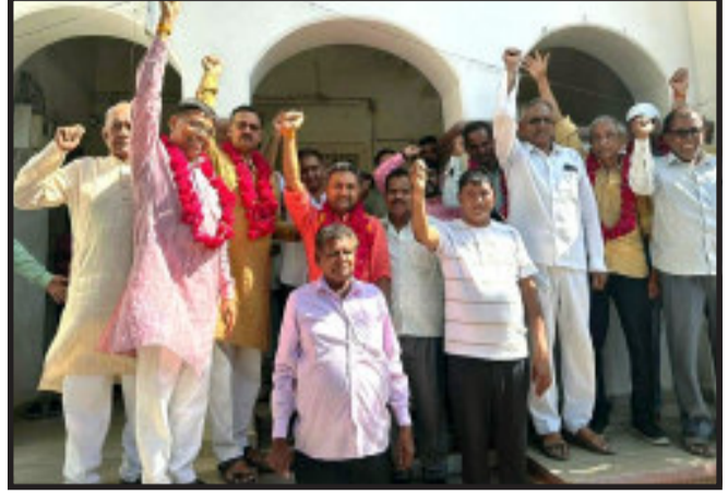
વિભાગ, સહકારી ખરીદ વેચાણ મંડળી મળી ત્રણેય વિભાગો માંથી ૪૬ ફોર્મ માન્ય રહેવા પામ્યા હતા.

ગોધરા, ગોધરા ખેતીવાડી ઉત્પન્ન બજાર સમિતિનું ૩૧ મેના રોજ ચુંટણી યોજનાર છે. તે પહેલા એપીએમસીનું ચુંટણી ચિત્ર થવા પામ્યું. ભાજપ પ્રેરિત સહકાર વિભાગ અને વેપારી વિભાગ પેનલને બિનહરીફ જાહેર કરવામાં આવી હોય ૧૫ ઉમેદવારો વચ્ચે ચુંટણી જંગ યોજાશે.