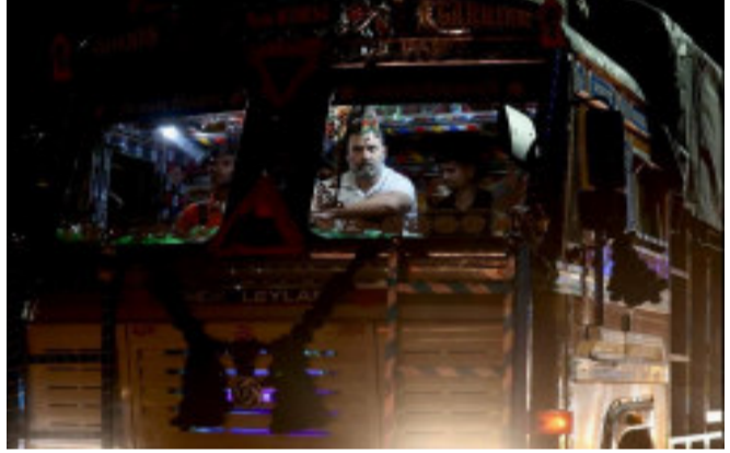
પોતાની સમસ્યાઓ છે. રાહુલે ટ્રક-ડ્રાઈવરોની 'મનની વાત' સાંભળવાનું કામ કર્યું છે. વાસ્તવમાં ભારે વાહનો અને ટ્રક ચલાવતા આ ડ્રાઈવરોને આખી રાત કામ કરવું પડે છે. આ દરમિયાન ઘણી બધી સમસ્યાઓ પડે છે, એ જાણવા માટે રાહુલ તેમની વચ્ચે પહોંચ્યા હતા. કોંગ્રેસનેતા સુપ્રિયા શ્રીને તે રાહુલનો વીડિયો શેર કર્યો છે. તેમણે લખ્યું, 'રાહુલ ગાંધી શા માટે યુનિવર્સિટીના વિદ્યાર્થીઓ, ખેલાડીઓ, સિવિલ સર્વિસની

ચંદીગઢ, કોંગ્રેસનેતા રાહુલ ગાંધીએ સોમવારે રાત્રે અંબાલાથી ચંદીગઢ ૫૦ કિમી સુધી ટ્રકમાં મુસાફરી કરી હતી. ખરેખર તેઓ બપોરે કારમાં દિલ્હીથી સિમલા જવા નીકળ્યા હતા. પાર્ટી કાર્યકર્તાઓએ જણાવ્યું હતું કે રાહુલે આ દરમિયાન ટ્રક-ડ્રાઈવર સાથે વાત કરી અને તેમની સમસ્યાઓ પણ સાંભળી હતી. રાહુલે સવારે ૫:૩૦ વાગ્યે અંબાલા શહેરના શ્રી માંજી સાહેબ ગુરુદ્વારામાં ટ્રક અટકાવી હતી. પછી ગુરુદ્વારામાં માથું ટેકવ્યું હતું. આ પછી તેમણે કોંગ્રેસના કેટલાક કાર્યકરો સાથે પણ વાત કરી હતી. તેમણે ગુરુદ્વારામાં લંગરનો પ્રસાદ પણ લીધો હતો. કોંગ્રેસનેતા સુપ્રિયા શ્રીને તે રાહુલની આ યાત્રાનો એક વીડિયો સોશિયલ મીડિયા પર શેર કર્યો હતો. રિપોર્ટ્સને ટાંકીને કોંગ્રેસ પાર્ટીએ કહ્યું હતું કે ભારતના રસ્તાઓ પર લગભગ ૮૦ લાખ ટ્રક-ડ્રાઈવર્સ છે. આ બધા લોકોની