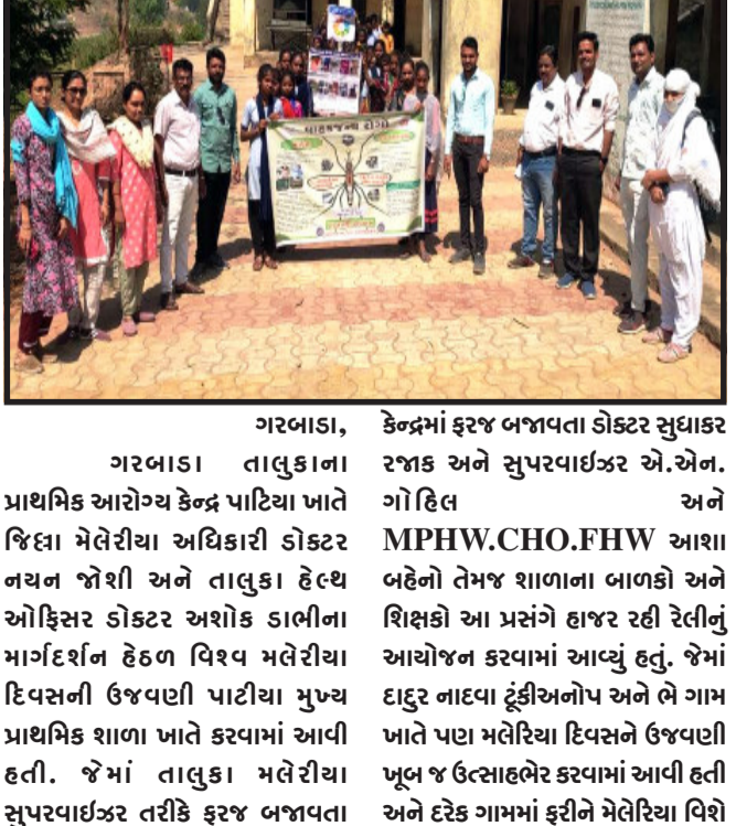
તસ્વીર : ગરબાડા તાલુકાના આરોગ્ય કેન્દ્ર પાટીયા ખાતે