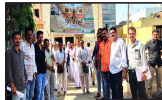
તસ્વીર : પંકજ પંડીત, ઝાલોદ

દાહોદ, દાહોદ તાલુકાના દેલસર ગામના શિવમ ડુપ્લેક્સ ખાતે રહેતા આશરે ૨૩ વર્ષીય યુવકે અગમ્ય કારણોસર ગળે ફાંસો ખાઈ આપઘાત કરી પરિવારજનોમાં માતમ છવાઈ ગયો હતો. આજરોજ તારીખ ૨૫ મી એપ્રિલના રોજ રાત્રીના સમયે શિવમ ડુપ્લેક્સમાં રહેતા ૨૩ વર્ષીય યુવક ધરમાં એકલો હતો. ત્યારે ધરમાં સીલીંગ ફ્રેન સાથે કપડું બાંધી લટકી અગમ્ય કારણોસર આપઘાત કરી