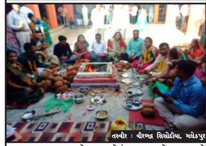
લિંબચીયા સંતાગાળા દ્વારા મલેકપુર લિંબચીયા માતા મંદિર ખાતે ચૈત્રવદ અગિયારસને તા. ૧૬/૦૪/૨૦૨૩ ને રવિવાર નારોજ લિંબચીયા માતા મલેકપુર ખાતે ભવ્યતિ ભવ્ય માતાજીનો પાટોત્સવ રાખેલ હતો.