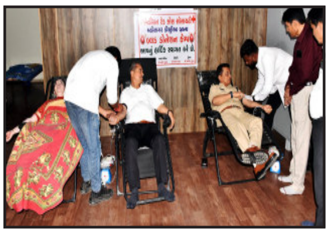
અને મુખ્ય જિલ્લા ન્યાયાધીશ એચ.એ.દવે તેમના ધર્મપત્ની એચ.એચ.દવે અને જિલ્લા પોલીસ અધિક્ષક આર.પી.બારોટે સહયોગે મહિસાગર ખાતે મુખ્ય ન્યાયાધીશ એચ એ દવેની ઉપસ્થિતિમાં યોજાયો હતો.

મહિસાગર, માનવ જિંદગી અમૂલ્ય છે જેને બચાવવા લોહી એક મહત્વનું તત્વ છે. લોહીની આકસ્મિક જરૂરિયાત કોઈપણ વ્યક્તિને ગમે ત્યારે પડી શકે છે અને તેથી જ આવા સંજોગોમાં લોકોની જરૂરિયાતને પહોંચી વળવા અને આકસ્મિક સંજોગોમાં તેઓને મદદરૂપ થવા જિલ્લા કાનૂની સેવા સત્તા મંડળ, મહિસાગર દ્વારા આયોજિત બ્લડ ડોનેશન કેમ્પ જિલ્લા અદાલત મહિસાગર ખાતે મુખ્ય ન્યાયાધીશ એચ એ દવેની ઉપસ્થિતિમાં યોજાયો હતો.