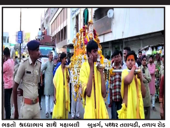
ભક્તો શ્રદ્ધાભાવ સાથે મહાબલી હનુમાનજીના દર્શન કરવા ઉમટી પડ્યા હતા. ગોધરા ખાતે વાવડી બુઝર્ગ, પરથર તલાવડી, તળાવ રોડ તેમજ હમીરપુર ખાતે આવેલ હનુમાનજીના મંદિરોમાં ભક્તો દર્શન

ગોધરા, પંચમહાલ જીલ્લા સહિત ગોધરામાં આજે શ્રી હનુમાન જન્મ જયંતિની શ્રદ્ધાભાવ સાથે ઉજવણી કરવામાં આવી. કેરહેર મંદિરોમાં ભાવિભક્તો વહેલી સવારથી ઉમટી પડ્યા હતા. સાથે ગોધરા સહિતના નગરમાં શ્રીજી હનુમાન જયંતિ નિમિત્તે ભવ્ય શોભાયાત્રા યોજવામાં આવી.