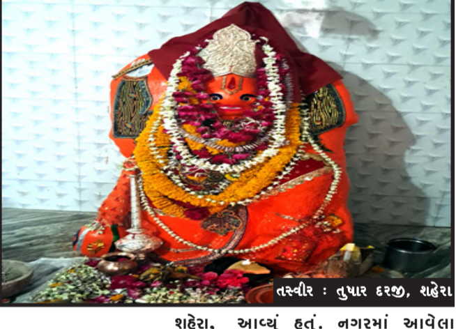
તસ્વીર : તુષાર દરજી, શહેરા

શહેરા, શહેરા તાલુકામાં હનુમાન જયંતિ ની ભકિત ભાવપૂર્વક ઉજવણી કરવામાં આવી હતી. જ્યારે નગર વિસ્તારમાં સીતારામ પરિવાર દ્વારા હનુમાનજીની શોભાયાત્રા નગરના હનુમાનજીની શોભાયાત્રા કાઢવામાં આવતા મોટી સંખ્યામાં હનુમાન ભક્તો જોડાયા હતા. શહેરા સહિત સમગ્ર જિલ્લામાં હનુમાન જયંતિની ભકિતભાવ પૂર્વક ઉજવણી કરવામાં આવી હતી. તાલુકામાં આવેલા હનુમાનજીના વિવિધ મંદિરો ખાતે વહેલી સવારથી તેમજ દિવસ દરમિયાન હનુમાનદાદાના દર્શન કરવા માટે ભક્તોની અવરજવર જોવા મળી રહી હતી. મંદિર ખાતે હનુમાન ભક્તોએ હનુમાન દાદાને સિંદૂર તથા તેલ અર્પણ કરી તેમની આરાધના કરી હતી. જ્યારે નગર વિસ્તારમાં સીતારામ પરિવાર દ્વારા હનુમાનજીની શોભાયાત્રાનું આયોજન કરવામાં આવ્યું હતું. નગરમાં આવેલા સ્વામિનારાયણ મંદિર ખાતેથી નીકળેલી હનુમાનજીની શોભાયાત્રામાં મોટી સંખ્યામાં હનુમાન ભક્તો જોડાયા હતા. હનુમાનજીની શોભાયાત્રા નગરના વ્યાસવાડા, મેઈનબજાર, પરવડી વિસ્તાર, ઠોળી ચકલા સહિત અન્ય માર્ગ ઉપર ફરી હતી. શોભાયાત્રાના રૂટ પર હનુમાનજીના ભકિતમય ભજન સાથે જય હનુમાનના નાંદ થી વાતાવરણ ભકિતમય બની ગયું હતું. સાથે મહા આરતી અને પ્રસાદીનું આયોજન સીતારામ પરિવાર દ્વારા કરવામાં આવતા મોટી સંખ્યામાં ભક્તોએ લહાવો લીધો હતો. રાત્રિના સમયે હનુમાનજીના વિવિધ મંદિરો ખાતે હનુમાન ચાલીસાના પાઠ તેમજ સુંદરકાંડ સહિત અનેક ધાર્મિક કાર્યક્રમો યોજાયા હતા. નગર અને તાલુકામાં હનુમાન જયંતિની આસ્થાભેર ઉજવણી કરાઈ હતી.