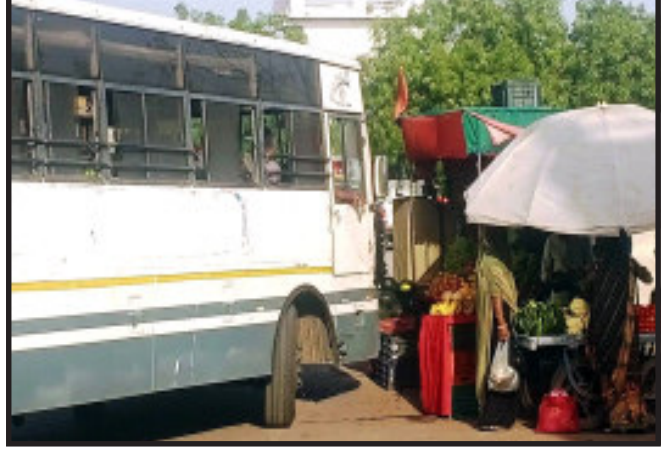
દબાણ થતા અડચણારૂપ દુકાનોને કારણે બસને રિવર્સ લેવી પડતા

મલેકપુર, વીરપુર બસ સ્ટેન્ડ સામે વીરપુર લીમડીયા મુખ્ય માર્ગ પર જાણે કોઈ બાઈકનો શો રૂમ હોય તેમ આડેઘડ બાઈકો પાર્ક કરી દેવાય છે. બસ સ્ટેન્ડની અંદર પણ ફોરવ્હીલર ગાડીઓનો શો રૂમ બની ગયો છે. અંદર પાન-મસાલા અને રસની લારીઓએ માજા મૂકી છે. ત્યારે એસટી પ્રવેશદ્વાર પર અવરજવર કરતા રાહદારીઓને ઘણી હાલાકી વેઠવી પડે છે. પ્રવેશદ્વાર પર પાકી દુકાનોના માલિકોએ પોતાના બળબુતા પર