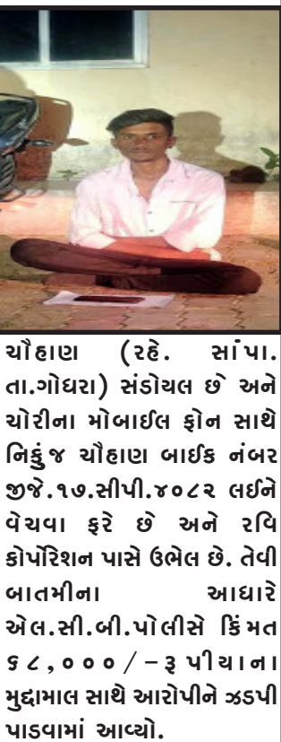
ચોઈહાણ (રહે. સાંપા. તા.ગોધરા) સંડોયલ છે અને ચોરીના મોબાઈલ ફોન સાથે નિહુજ ચોઈહાણ બાઈક નંબર જી.જી.સી.પી.૪૦૮૨ લઈને વેચવા ફરે છે અને રવિ કોપરિશન પાસે ઉભેલ છે. તેવી બાતમીના આધારે એલ.સી.બી.પોલીસે કિંમત ૬૮,૦૦૦/- રૂ પીયાના મુદ્દામાલ સાથે આરોપીને ઝડપી પાડવામાં આવ્યો.

ગોધરા, ગોધરા એલ.સી.બી. પોલીસે ચોરીના મોબાઈલ ફોન અને ચોરીમાં ઉપયોગમાં લેવાયેલ બાઈક મળી કુલ ૬૮ હજારના મુદ્દામાલ સાથે એક ઈસમને ઝડપી પાડવામાં આવ્યો. પ્રાસ વિગતો મુજબ ગોધરા વર્ધમાન હોટલ પાસેથી રાહદારી વ્યક્તિ પાસેથી ચોરી કરેલ મોબાઈલ ફોન ચોરી કરવામાં નિહુજ જ ચચસંવર્સિંહ