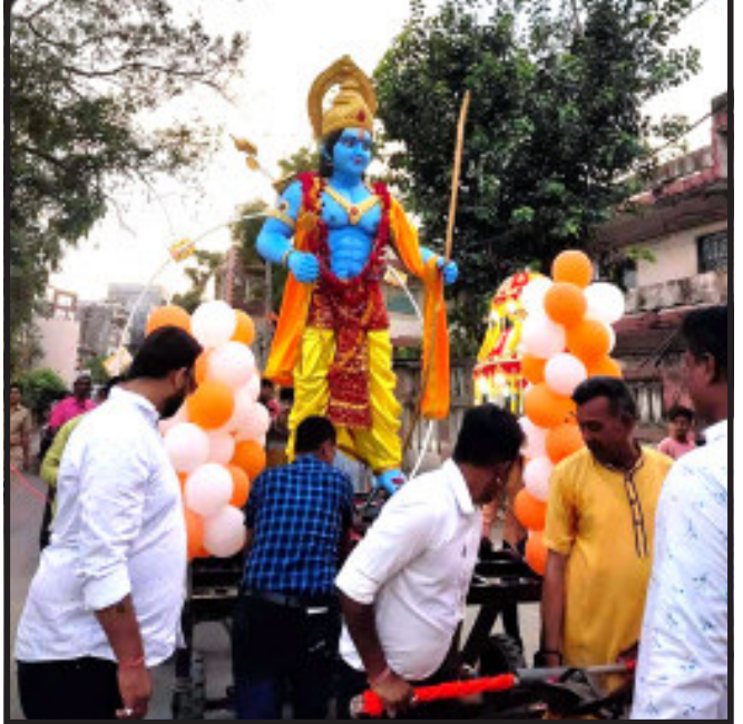
ગોધરા, ગોધરા નગરમાં રામનવમીના પાવન દિવસે શ્રીરામની ભવ્ય શોભાયાત્રાનું આયોજન કરવામાં આવ્યું. ડી.જે.ના તાલે શોભાયાત્રા નગરના રાજમાર્ગો ઉપરથી ફરીને રામજી મંદિર ખાતે પહોંચી મોટી