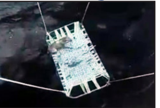
વનરાજી થી ઘેરાયેલા દાહોદ સહિત આસપાસના વિસ્તારમાં વસવાટ કરતા વન્ય પ્રાણીઓ ઘણી વખત ખોરાક તેમજ પાણીની શોધમાં માનવ વસાહત માં આવી જવાનાં કિસ્સાઓ ભૂતકાળમાં ઘણી વખત બન્યા છે. એમાં જ ખાસ કરીને વન્યપ્રાણી દીપડો અવારનવાર માનવ

દાહોદ, દાહોદ તાલુકાના ખરેડી ગામે શિકારની શોધમાં માનવ વસાહત તરફ ઘસી આવેલો શિયાળ ખેતરમાં આવેલા પાણી ભરેલા કુવામાં ખાબક્યો હતો. જોકે, આસપાસના ભેગા થયેલા લોકોએ શિયાળ અંગેની જાણ દાહોદ વન વિભાગને કરતા વન વિભાગના એસીએફના માર્ગદર્શનમાં વન વિભાગની ટીમે રેસ્ક્યુ હાથ ધરી ભારે જહેમત બાદ આ શિયાળને પાણી ભરેલા કુવામાંથી બહાર કાઢ્યો હતો. આદિવાસી બાહુલ્ય ધરાવતા દાહોદ જિલ્લો અફાટ વનરાજીથી ઘેરાયેલો છે. આ વનરાજીમાં બંને પ્રાણી દીપડા, રીંછ, સાબર, નીલગાય સહિતના વન્ય પ્રાણીઓ તેમજ પક્ષીઓ મોટી સંખ્યામાં વસવાટ કરે છે.