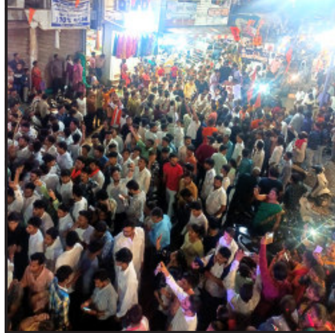
જોડાયા હતા. શોભાયાત્રા રૂટ ઉપર પોલીસ દ્વારા ચુસ્ત પોલીસ બંદોબસ્ત ગોઠવવામાં આવ્યો હતો. ભગવાન શ્રીરામના જન્મ મહોત્સવની ઉજવણી માટે શોભાયાત્રા ભવ્ય મનમોહક પ્રતિમાના સાથે યોજવામાં આવી હતી.

શોભાયાત્રા કાઢવામાં આવી હતી. શોભાયાત્રા ડી.જે.ના તાલે ભક્તિમય માહોલમાં નગરના રાજમાર્ગો ઉપર કાઢવામાં આવી હતી. શોભાયાત્રા રામજી મંદિરથી નગર પાલિકા રોડ થી ચાંચર ચોક ત્યાંથી બગીચા રોડ, કાઠીઆવાડ થઈ નિજ રામજી મંદિર ખાતે પહોંચી હતી. ભગવાન શ્રીરામના જન્મ મહોત્સવે યોજાયેલ શોભાયાત્રા મોટી સંખ્યામાં ભાવિ ભકતો