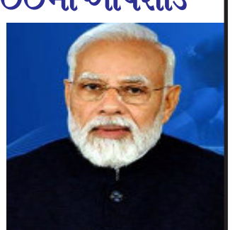
ભાજપના મુખ્યમંત્રી અને વરિષ્ઠ નેતા પણ સાથે રહેશે. દરેક લોકસભા ભેત્રમાં ૧૦૦ જગ્યાઓ પર ૧૦૦ લોકો મન કી બાત સાંભળશે. પંચાભૂષણ અને પંચશ્રીથી સન્માનિત તે લોકોને પણ સન્માનિત કરવામાં આવશે જેમના ઉદ્દેશ્ય પીએમ મોદીએ મન કી બાતમાં કર્યા છે. પીએમ મોદીના મન કી બાત દેશભરના જે લોકોનો ઉલ્લેખ આ કાર્યક્રમમાં કર્યો છે તેમને પણ ૩૦ એપ્રિલે જોડવાની યોજના છે. તેના માટે