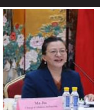
સરહદ પર પરિસ્થિતિ મૂળ જ નાજુક છે, તેના જવાબમાં જિયાએ કહ્યું કે, આ જ કારણ છે કે બંને પક્ષો રાજદ્વારી અને લશ્કરી ચેનલો દ્વારા વાતચીત કરી રહ્યા છે.

નવીદિલ્હી, ચીને ભારત સાથેના સંબંધોને લઈને ઘણી વાત કરી છે. ચીને કહ્યું છે કે, તે ભારત સાથે યુદ્ધ નથી ઈચ્છતું. ભારતમાં ચીની દૂતાવાસના પ્રભારી મા જિયાએ કહ્યું હતું કે, લદાખમાં એલએસી નજીક ભગડાડી પરિસ્થિતિને કારણે ભારત અને ચીન વચ્ચેના સંબંધોમાં ખટાશ આવી ગઈ હશે, પરંતુ વાસ્તવમાં બંને પક્ષો સરહદી વિસ્તારોમાં યુદ્ધ ઈચ્છતા નથી. પત્રકારો સાથેની વાતચીત દરમિયાન જિયાએ કહ્યું કે, સરહદ પર સ્થિતિ સ્થિર છે. તેમણે કહ્યું કે બંને પક્ષો સરહદ પર સ્થિતિને નિયંત્રિત કરવા માટે વાતચીત કરી રહ્યા છે. તેજ સમયે, જ્યારે ચીનના રાજદૂતને પૂછવામાં આવ્યું કે, ભારતના વિદેશ પ્રધાન એસ જયશંકરે તાજેતરમાં કહ્યું હતું કે,