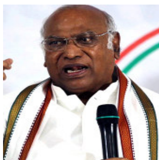
રાજસ્થાનના મુખ્યમંત્રી અશોક ગેહલોતે કહ્યું, અમે કહી રહ્યા છીએ કે

અમારી લોકશાહી ખતરામાં છે કારણ કે ન્યાયતંત્ર, ચૂંટણી પંચ, ઈડી અને આ તમામનો દુરુપયોગ થઈ રહ્યો છે. તમામ નિર્ણયો અમલમાં લેવામાં આવે છે. આવી ટિપ્પણીઓ સામાન્ય છે. રાહુલ ગાંધી એક હિંમતવાન માણસ છે અને તેઓ જ NDA સરકાર સાથે સ્પર્ધા કરી શકે છે. કોંગ્રેસ મહાસચિવ પ્રિયંકા ગાંધી વાડાએ પોતાના દિવતા પ્રતિક્રિયા આપતા કહ્યું કે, ડરી ગયેલી સત્તા, દામ, દંડ, ભેદ લગાવીને રાહુલ ગાંધીનો અવાજ દબાવવાનો પ્રયાસ કરી રહી છે. મારા ભાઈ ક્યારેય ડર્યા નથી અને ક્યારેય થશે પણ નહિ. સત્ય બોલતા જીવ્યા છે, સત્ય બોલતા રહીશું. દેશના લોકોનો અવાજ બુલંદ કરતા રહીશું. સત્યની શક્તિ અને કરોડો