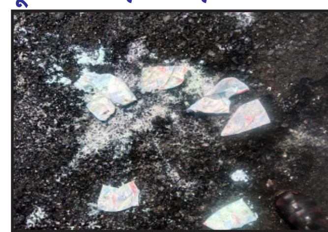
સંજેલી, સંજેલી તાલુકાના તારમી કરંબા રસ્તા પર સંજીવની દૂધના પાઉચો ફેંકી દેવાતા ફોટા થયા વાયરલ. સરકાર દ્વારા લાખોના ખર્ચે બાળકો કુપોષિત ન રહી જાય તે માટે

દૂધનું મફત વિતરણ કરવામાં આવે છે. તો બીજી બાજુ આ રોડ વચ્ચે દૂધ કોણ ફેંકી ગયું હશે. તેવા અનેક સવાલો ઊભા થયા સરકારી પૈસાનો દુરુપયોગ કેટલાક સમયથી થતો હશે. તેવા અનેક સવાલો ઉઠવા પામ્યા છે.