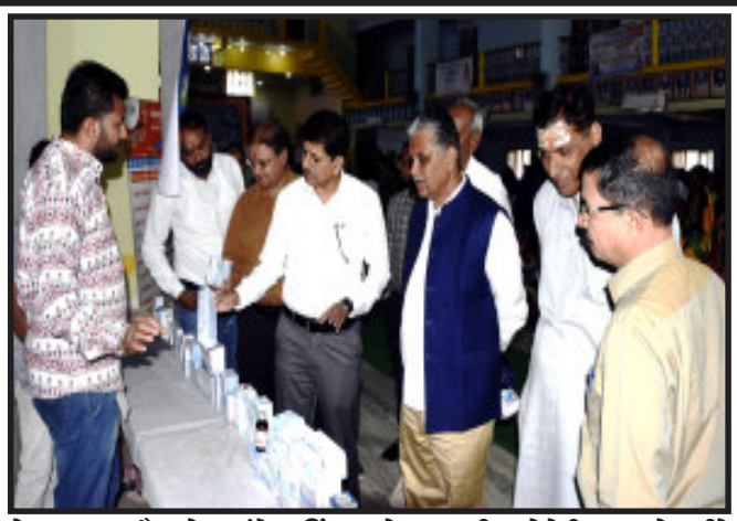
સરકાર સૌ માટે હરહંમેશ ચિંતા કરે છે. ત્યારે દરેક વ્યક્તિએ સરકારી યોજનાઓનો લાભ લેવો જોઈએ મહત્તમ લોકો જરૂરિયાતના સમયે આ યોજનાનો લાભ લે અને જન ઔષધિ