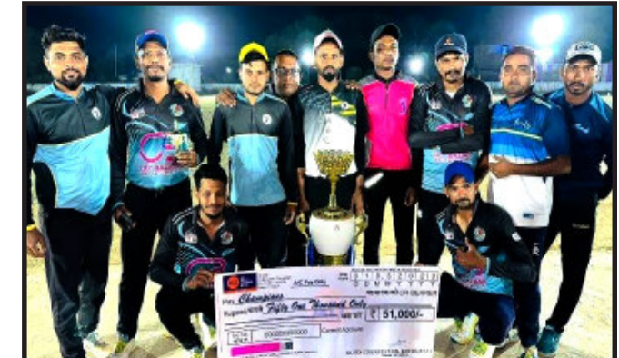
લુણાવાડા, મહિસાગર જિલ્લાના યુવા ફાઉન્ડેશન ટીમને અનાથ દિવ્યાંગ બાળકોને શિયાળાની ઋતુમાં પણ સ્વેટર વિતરણની સારી કામગીરી બદલ ખાનપુર તાલુકાની ખાનપુર પ્રાથમિક શાળા અને કડાણા તાલુકાની વેલણવાડા પ્રાથમિક શાળામાં વાર્ષિક ઉત્સવમાં સારી કામગીરી બદલ ટ્રોફી અને સાલ થી સન્માન કરવામાં આવ્યું હતું.