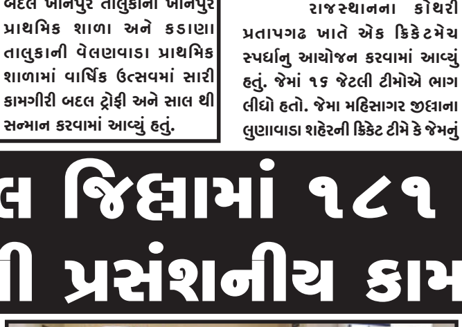
જિલ્લામાં છેલ્લા આઠ વર્ષમાં મહિલા હેલ્પલાઇન થકી સલાહ, સૂચન, મદદ અને માર્ગદર્શન માટે કુલ ૪૩૧૭૫ મહિલાઓને મદદ કરી

ગોધરા, ગુજરાત રાજ્યની વિશેષતા એ છે કે, પ્રત્યેક બાબતમાં આગવી રીતે પહેલ કરી લોકોને સરળતાથી યોજનાઓનો લાભ પહોંચાડી શકાય તેવા અનેક સંવેદનશીલ નિર્ણયો લેવામાં આવેલ છે. મહિલાઓને ઘરેલુ હિંસા સહિતની વિવિધ પ્રકારની હિંસા તેમજ મુશ્કેલીની બાબતમાં તાત્કાલિક ધોરણે બચાવ અને સલાહ-માર્ગદર્શન ઉપરાંત મહિલાલક્ષી યોજનાઓની જાણકારી મળી રહે તે માટે “ મહિલા હેલ્પલાઇન ”ની સુવિધાની ઉપલબ્ધીની આવશ્યકતા જણાતા ગુજરાત સરકારના મહિલા અને બાળ વિકાસ વિભાગ, ગૃહ વિભાગ, રાજ્ય મહિલા આયોગ અને GVK EMRI દ્વારા સંકલિત રીતે ૮ માર્ચ ૨૦૧૫ના આંતરરાષ્ટ્રીય મહિલા દિવસના રોજ રાજ્યભર્યાપી ૧૮૧ અભયમ મહિલા હેલ્પલાઇન શરૂ કરવામાં આવી હતી.