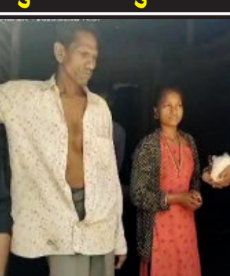
લુણાવાડા, મહિસાગર કડાણાના યુવા ફાઉન્ડેશન દ્વારા હોળીનો તહેવારના દિવસે અનાથ, દિવ્યાંગ બાળકો તથા વિધવા અને વિધુર વ્યક્તિઓને હોળી ના શુભપર્વ નિમિત્તે લાડુ સ્વરૂપે મીઠાઈ તેમજ થોખાનુ કીટનું વિતરણ કરવામાં આવ્યું હતું.

લુણાવાડા, મહિસાગર જિલ્લાના યુવા ફાઉન્ડેશન ટીમને અનાથ દિવ્યાંગ બાળકોને શિયાળાની ઋતુમાં પણ સ્વેટર વિતરણની સારી કામગીરી બદલ ખાનપુર તાલુકાની ખાનપુર પ્રાથમિક શાળા અને કડાણા તાલુકાની વેલણવાડા પ્રાથમિક શાળામાં વાર્ષિક ઉત્સવમાં સારી કામગીરી બદલ ટ્રોફી અને સાલ થી સન્માન કરવામાં આવ્યું હતું.