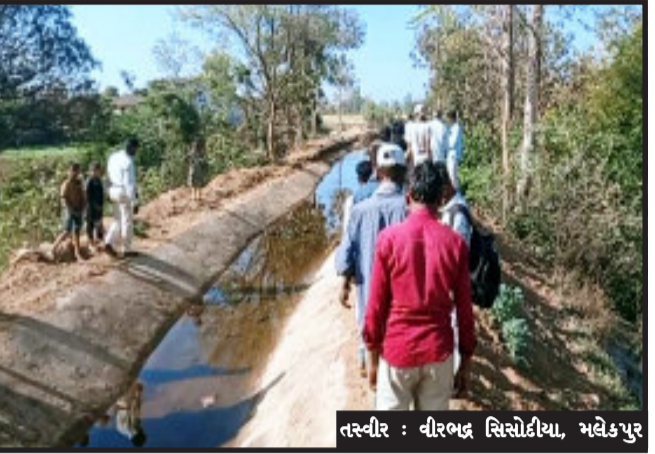
કેનાલ નિયમિત રીતે શરૂ થઈ નથી. ત્યાંજ કેનાલની દીવાલના અસ્તર કામમાં ગાબડા પાડવાની શરૂઆત થતા ખેડૂત લાભાર્થીઓમાં રોષની લાગણી ઉભી થઈ છે. આવા ગાબડા

મલેકપુર, કડાણા તાલુકાના ઢીગલવાડા ગામે ખેડૂતોને સિંચાઈના પાણી મળી રહે તે માટે શરૂ કરાયેલ કાંકરિયા તળાવ માંથી નાની સિંચાઈ યોજના કેનાલ મારફતે ખેડૂતોને પાણી આપવામાં આવ્યું હતું. જૂની કેનાલ હતી એ વખતે ખેડૂતોને પૂરતા પ્રમાણમાં પાણી મળી રહેતું કેનાલ રીપેરીંગ કર્યા પછી કોન્ટ્રાક્ટરે લેવલ વગરનું અને હલકી ગુણવત્તા વાળું કામ કરેલ હોઈ ખેડૂતોને પાણી મળતું નથી. કેનાલનો બીપ બનાવ્યા પછી પાણી છોડતામાં જ ગાબડું પડ્યું હોવાનું સ્થાનિક ખેડૂતો જણાવી રહ્યા છે. આ બાબતે અવાર નવાર ફરિયાદ ઉભી થઈ હોવા છતાં સિંચાઈ વિભાગ દ્વારા યોગ્ય ધ્યાન અપાયું નથી. હજુ