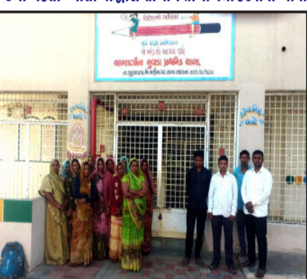
લુણાવાડા, ભારતીય સંસ્કૃતિની સભ્યતાનો બાળકો અને યુવાનો આદર કરે અને યાદરિત્ય નિર્માણ દ્વારા રાષ્ટ્ર નિર્માણના ઘડવૈયા બને તે હેતુસર મહિસાગર જિલ્લા પ્રાથમિક શિક્ષણાધિકારીની કચેરી દ્વારા જિલ્લાની પ્રાથમિક શાળાઓમાં માતાપિતા પૂજન દિવસની ઉજવણી કરવાનું આયોજન કરવામાં આવ્યું. ત્યારે લુણાવાડા તાલુકાની જામપગીના મુવાડા અને કડાણા તાલુકાની રણકપુર સરકારી પ્રાથમિક શાળામાં બનાતકારી આશારામનું બેનર લગાવવામાં આવ્યું તેમજ ખુશીમાં આશારામનો ફોટો મૂકી તેના પર ફૂલ હાર ચઢાવીને તેની આરતી ઉતારવામાં આવી હતી. જામપગીના મુવાળા અને રણકપુર પ્રાથમિક શાળામાં યોજાયેલ માતૃ પિતૃ પૂજન દિવસના કાર્યક્રમ દરમિયાન જેલમાં