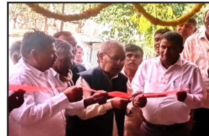
વીરપુર, જમાલપુર દૂધ મંડળીના નવીન મકાન માટે પશુપાલન દૂધધર યોજના હેઠળ રૂ.૫,૦૦,૦૦૦ લાખ જેટલી માતબર રકમની મંજૂરી હેઠળ નવીન મકાનનું બોધકામ કરવામાં આવ્યું. તેના ઉદ્ઘાટન નિમિત્તે ૧૨૧ બાલાસિનોર વિધાનસભાના ધારાસભ્ય માલસિંહજી ચૌહાણની ઉપસ્થિતિમાં