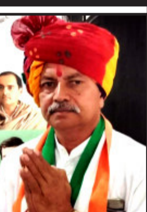
કોંગ્રેસના ધારાસભ્ય તરીકે મારી વાતના સ્વીકારી હાલ તો તાલુકા પ્રમુખ થી લઈ વડાપ્રધાન સુધી ભાજપની સરકાર છે, તો શું તકલીફ છે, તળાવો ભરવામાં પ્રજાના હિતમાં તાત્કાલિક તળાવો ભરવા તેમજ પીવાના પાણીની જોગવાઈ કરવીએ સરકારની ફરજ છે.

બાલાસિનોર, ગુજરાત સરકારની તળાવો ભરવાની વાતો એક લોલીપોષ જેવી સાબિત થઈ રહી છે. ઉનાળાની શરૂઆત થઈ ચૂકી છતાં ૧૪ વિધાનસભામાં અંદાજપત્રમાં જાહેરાત કરવામાં આવી હતી કે, ૨ કિમીને બદલે હવે ૩ કિમી સુધી લંબાઈવાળા તળાવો ભરવામાં આવશે, પણ આજ દિન સુધીમાં પરિપત્ર જ કર્યો નથી અને વાતો કરવામાં આવે છે કે તળાવ ભરવામાં આવશે. ૨૦૨૧ના પહેલા સત્રમાં ૧૨૧ વિધાનસભાના MLA તરીકે વિધાનસભામાં રજુઆત કરેલીને જેમાં ૧૦ જેટલા તળાવો ભરવાની રજુઆત કરેલી પણ સરકારે કોઈ પ્રગતિ આજ દિન સુધીમાં કરી નથી. કદાચ