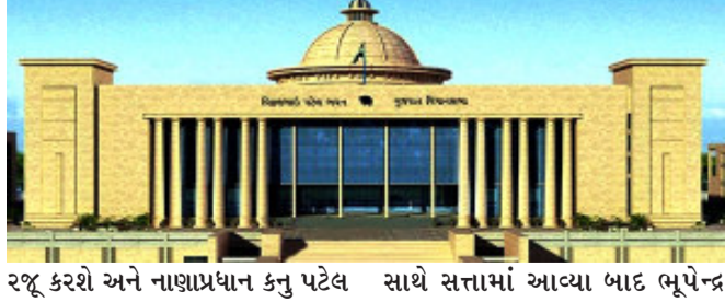
ગાંધીનગર, ગુજરાત વિધાનસભાના બજેટ સત્રનો આવતીકાલ તારીખ ૨૩ ફેબ્રુઆરીના રોજ પ્રારંભ થશે. આ સત્રની શરૂઆત રાજ્યપાલ આચાર્ય દેવવ્રતના સંબોધનથી શરૂ થશે. બજેટ સત્રના પ્રારંભે સૌ પ્રથમ દિવંગત સાભ્યોને શ્રદ્ધાંજલિ અપાશે અને ત્યારબાદ બપોરે રાજ્ય સરકાર ગુજરાત જાહેર પરીક્ષા વિધેયક ૨૦૨૩ ગુજરાત રજૂ કરશે. પેપરલીક વિરોધી બિલને રાજ્ય સરકાર સર્વાનુમતે પસાર કરવાનો પ્રયાસ કરી શકે છે. તો બજેટ સત્ર દરમિયાન ૨૪ ફેબ્રુઆરીએ ભૂપેન્દ્ર પટેલ સરકાર પોતાનું બીજું બજેટ રજૂ કરશે અને નાણાપ્રધાન કનુ પટેલ વિધાનસભામાં નાણા પ્રધાન તરીકે બીજું બજેટ રજૂ કરશે. તો ૨૯ માર્ચ સુધી બજેટ સત્ર ચાલશે, જ્યારે બજેટ સત્રમાં વિનયપિત્ર વિકાસ નિયંત્રણ સુધારા વિધેયક ૨૦૨૩ પણ રજૂ કરવામાં આવશે. નોંધનીય છે કે ગુજરાતીઓની નજર આ બજેટ ઉપર રહેશે કે બહુમતી સાથે સત્તામાં આવ્યા બાદ ભૂપેન્દ્ર પટેલની સરકાર ગુજરાતીઓ માટે બજેટ ૨૦૨૩-૨૪માં નવું શું લઈને આવશે. પ્રાસ કરીને ખેડૂતો માટે, શિક્ષણ માટે, મિનઅધિકૃત વિકાસ નિયંત્રણ સુધારા, મુડીરોકાણ અંગે બજેટમાં શું નવું આપવામાં આવે છે. ગુજરાત વિધાનસભામાં નાણા પ્રધાન કનુ પટેલ, નાણાકીય વર્ષ ૨૦૨૨-૨૦૨૩નું પૅ૫૦કરોડની પુરાંતવાળું અંદાજપત્ર રજૂ કર્યું હતું. જેમાં ગુજરાતમાં ૧૨૦૦૦ સુધીનો પગાર મેળવનારાઓને વ્યવસાયવેરામથી સંપૂર્ણ મુક્તિ આપવામાં આવી હતી. વર્ષ ૨૦૨૧-૨૦૨૨ની સરખામણીએવર્ષ ૨૦૨૨-૨૦૨૩ના બજેટમાં નાણાકીય ફાળવણી વધુ કરાઈ હતી. ગત વર્ષે નાણાપ્રધાન કનુભાઈ દેસાઈ તેમની કારકિર્દીનું પ્રથમ બજેટ, ગુજરાત વિધાનસભામાં ગુલ સમક્ષ રજૂ કર્યું હતું. જેમાં નાણાકીય વર્ષના અંતે રૂપિયા ૫૬૦.૦૯ કરોડની પુરાંત રહેવાનો અંદાજ રાખવામાં આવ્યો હતો.