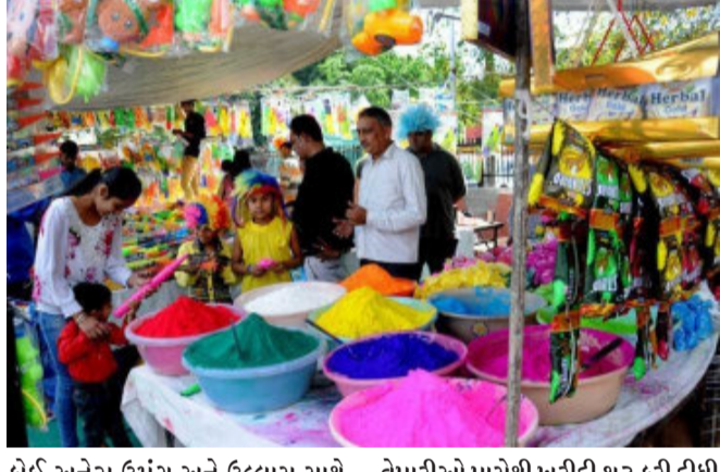
અમદાવાદ, અબાલ-વૃદ્ધોમાં લોકપ્રિય એવા ધૂળેટીના પર્વ આરંભે એકાદ પખવાડિયાનો સમય માંડ બાકી રહ્યો છે, ત્યારે પૂર્વ અમદાવાદના વિવિધ વિસ્તારમાં છુટાછવાયા પિયકારીનું વેચાણ શરૂ થઈ ગયું છે. ધીમે ધીમે નાના-મોટા સ્ટોલ ખૂલવા માંડ્યા છે. કોરોનાના ગ્રહણ બાદ મોંઘવારીએ અજગરી ભરડો લીધો હોવાથી લોકોએ આ વખતે પિયકારીની ખરીદીમાં ૨૫થી ૩૦ ટકા ભાવ વધારો આપવા તૈયાર રહેવું પડશે. અમદાવાદ શહેરની બજારોમાં વેચાતી મોટાભાગની પિયકારી ચાઈના અને દિલ્હીથી મગાવવામાં આવે છે. શહેરના સિઝનલ બજારોના વેપારીઓએ જથ્થાબંધ પિયકારીની ખરીદી શરૂ કરી દીધી છે.

અમદાવાદ, અબાલ-વૃદ્ધોમાં લોકપ્રિય એવા ધૂળેટીના પર્વ આરંભે એકાદ પખવાડિયાનો સમય માંડ બાકી રહ્યો છે, ત્યારે પૂર્વ અમદાવાદના વિવિધ વિસ્તારમાં છુટાછવાયા પિયકારીનું વેચાણ શરૂ થઈ ગયું છે. ધીમે ધીમે નાના-મોટા સ્ટોલ ખૂલવા માંડ્યા છે. કોરોનાના ગ્રહણ બાદ મોંઘવારીએ અજગરી ભરડો લીધો હોવાથી લોકોએ આ વખતે પિયકારીની ખરીદીમાં ૨૫થી ૩૦ ટકા ભાવ વધારો આપવા તૈયાર રહેવું પડશે. અમદાવાદ શહેરની બજારોમાં વેચાતી મોટાભાગની પિયકારી ચાઈના અને દિલ્હીથી મગાવવામાં આવે છે. શહેરના સિઝનલ બજારોના વેપારીઓએ જથ્થાબંધ પિયકારીની ખરીદી શરૂ કરી દીધી છે. ધૂળેટીના તહેવારની નાના બાળકોથી માંડીને વૃદ્ધ સુધીના સહુ