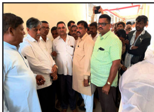
પંચમહાલ સાંસદ અને લુણાવાડા ધારાસભ્યએ હોસ્પિટલ ખાતે ઈજાગ્રસ્તોની મુલાકાત લીધી