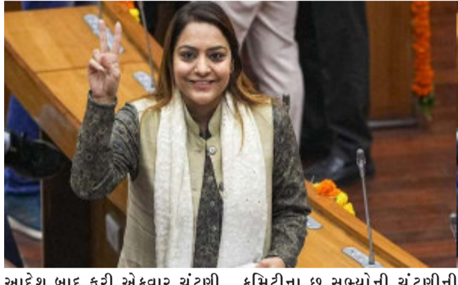
દિલ્હી મેયરની ચૂંટણીનું મતદાન સવારે ૧૧.૩૦ વાગ્યે શરૂ થયું હતું અને ૨ કલાકથી વધુ સમય સુધી ચાલ્યું હતું. કુલ ૧૦ નામાંકિત સાંસદો, ૧૪ નામાંકિત ધારાસભ્યો અને દિલ્હીના ૨૫૦ ચૂંટાયેલા કાઉન્સિલરોમાંથી ૨૪૧એ મેયરની ચૂંટણીમાં મતદાન કર્યું હતું. કોંગ્રેસના ૮ કાઉન્સિલરોએ પોતાનો મત આપ્યો નથી. બીજાની સાંસદ મનોજ તિવારીએ દિલ્હીના મેયરની ચૂંટણીમાં મતદાન કર્યું હતું.

દિલ્હી મેયરની ચૂંટણીનું મતદાન સવારે ૧૧.૩૦ વાગ્યે શરૂ થયું હતું અને ૨ કલાકથી વધુ સમય સુધી ચાલ્યું હતું. કુલ ૧૦ નામાંકિત સાંસદો, ૧૪ નામાંકિત ધારાસભ્યો અને દિલ્હીના ૨૫૦ ચૂંટાયેલા કાઉન્સિલરોમાંથી ૨૪૧એ મેયરની ચૂંટણીમાં મતદાન કર્યું હતું. કોંગ્રેસના ૮ કાઉન્સિલરોએ પોતાનો મત આપ્યો નથી. બીજાની સાંસદ મનોજ તિવારીએ દિલ્હીના મેયરની ચૂંટણીમાં મતદાન કર્યું હતું. આજે પણ સવારે ૧૧ વાગે સિવિક સેન્ટરમાં હંગામા જેવી પરિસ્થિતિ જોવા મળી હતી આપ કાઉન્સિલરોનો પોલીસ સાથે થોડો વિવાદ પણ થયો. આપ સદનમાં બીજાની વિધાયક વિજેન્દ્ર ગુપ્તાની એન્ટ્રીનો વિરોધ કરી રહ્યા હતા.