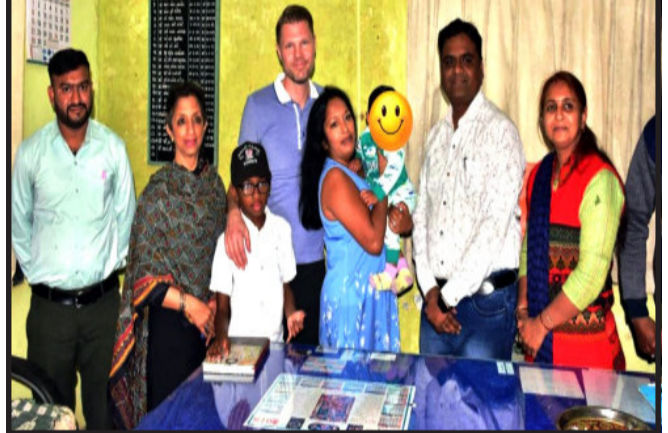
નામનું બાળક મહિસાગર જિલ્લાના ખેતરમાંથી ત્યજી દેવાયેલી હાલતમાં મળી આવ્યું હતું અને ગોધરા ચિલ્ડ્રન હોમ લાવવામાં આવ્યું હતું. ચિલ્ડ્રન હોમમાં સતત સારવાર અને ઠૂંકને