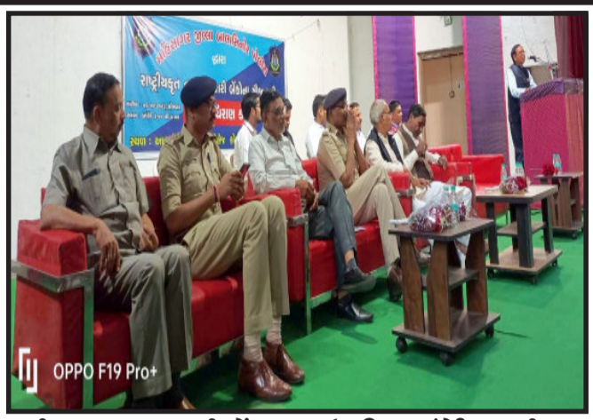
રાષ્ટ્રીયકૃત તથા સહકારી બેંકના મેનજરશ્રી હાજર રહ્યા હતા. જેથી બાલાસિનોર તાલુકાના જરૂરિયાતમંદ નાગરિકો કે.એ.ઓ. લઘુઉદ્યોગ તથા

બાલાસિનોર, મહિસાગર જિલ્લાના બાલાસિનોર પોલીસ દ્વારા બાલાસિનોર આર્ટ્સ એન્ડ કોમર્સ કોલેજના હોલ ખાતે તમામ રાષ્ટ્રીયકૃત તથા સહકારી બેંકના સૌજન્ય થી લોન/ધિરાણ કેમ્પનું આયોજન કરવામાં આવ્યું.