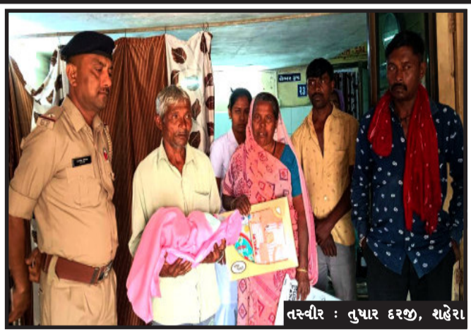
શહેરા તાલુકાના હાંસાપુર ગામે આવેલા તળાવ વિસ્તારમાં એક બાળક રફતુ હોવાનું ધ્યાને આવતા એક નાગરિકે તાત્કાલિક તેને ૧૦૮ની

શહેરા, શહેરા તાલુકાના હાંસાપુર ગામના તળાવ પાસે આવેલા ઝાડી-ઝાંખરા માંથી આશરે ૧૫ દિવસનું ત્યજ દીધેલું બાળક મળી આવતા ચક્રચાર મચી જવા પામી હતી. એક નાગરિકને આ બાબત ધ્યાને આવતા તેમને તાત્કાલિક ૧૦૮ સેવાને જાણ કરી હતી. હાલ આ બાળક સરકારી હોસ્પિટલ ખાતે લાવીને સારવાર હેઠળ રાખવામા આવવા સાથે બાળકની માતા ભદ્રાલા ગામની હોય અને અસ્થિર મગજની હોવાનું