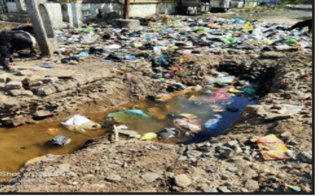
ગોધરા, ૧૦માં પાલિકા દ્વારા પાણીની પાઈપ લાઈનની રીપેરિંગની કામગીરી કરવામાં

આવ્યા બાદ કેટલાય દિવસો વીતવા છતાં ખાદા પૂરવામાં નહિ આવતા સ્થાનિકોને હાલાકી ભોગવવી પડી રહી છે. ગોધરા નગર પાલિકાના વોર્ડ ૧૦ માં ગોંદ્રા વિસ્તારમાં આવેલી મન્સૂરી સોસાયટી સુબ્હાની મસ્જિદ આગળ પાણીની પાઈપ તૂટી ગઈ હોય તે મામલે પાલિકા દ્વારા રીપેરિંગની કામગીરી કરવામાં આવી પરંતુ કામગીરી પૂર્ણ થયા બાદ ખાદા પુરવામાં આવતા નથી. અહીં સ્થાનિક વિસ્તારમાં ધાર્મિક સ્થાન આવેલું હોય ત્યારે સ્થાનિક રહીશો દ્વારા આ મામલે માંગ ઉઠવા