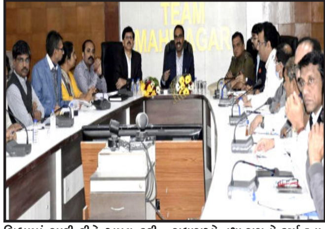
જિલ્લામાં સારી રીતે અમલ કરી શકાય તે અંગે માર્ગદર્શન પુરંપાડવું હતું. વધુમાં તેઓએ કોરોનાની આવાનરી કોઈ પણ પ્રકારની પરિસ્થિતિને પહોંચી વળવા જિલ્લા વહીવટી તંત્ર દ્વારા ઓકિસજન, આઈ.સી.યુ બેડ, વગેરે અંગે કરેલી તૈયારીઓની સમીક્ષા કરતા જરૂરી સુધારાઓ તથા સુચનો કર્યા હતા.