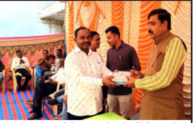
કડાણા તાલુકાના ડોડીયા મઠ મુકામે આદિજાતિ વિકાસ અને પ્રાથમિક, માધ્યમિક અને પ્રૌઢ શિક્ષણના કેબિનેટ મંત્રી પ્રો.ડો. કુબેરભાઈ ડીંગોર સાહેબે અશોકભાઈના નિવાસથાને જનસંપર્ક કાર્યક્રમ ચોજ્યો. સાથે પાર્ટીનાં આગેવાનો, હોદ્દેદારો, કાર્યકરો સહિત મોટી સંખ્યામાં ગ્રામજનો હાજર રહ્યા હતા.

ઉપયોગ કરવો ગેરકાનૂની અને ગુનો બનતો હોય છે અને સંતરામપુરના વેચાણ પર કરી શકતા નથી જો ચાઈનીઝ દોરી ઉપર પ્રતિબંધ મુકેલો