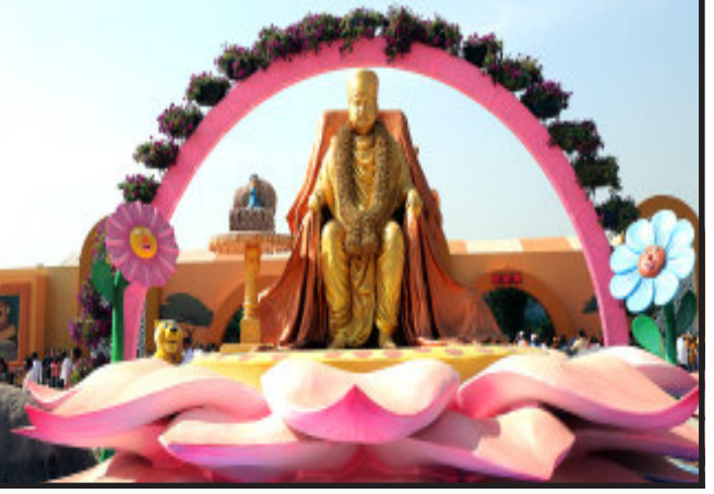
: બાળ સંસ્કાર દિન :

બ્રહ્મસ્વરૂપ યોગીજી મહારાજ દ્વારા ૧૯૫૪માં શરૂ કરાયેલી બાળપ્રવૃત્તિને પ્રમુખસ્વામી મહારાજે વિશાળ વટવૃક્ષરૂપે વિસ્તારી