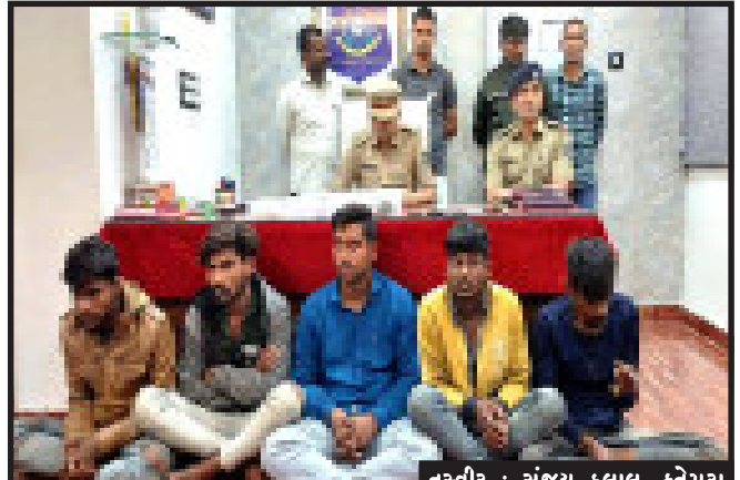
તસ્વીર : સંજય કલાધ, ફતેપુરા

ફતેપુરા, ફતેપુરા તાલુકા માં ગત ૧૭ ડિસેમ્બર ના રોજ ફતેપુરા નગરમાં હનુમાન ટેકરી વિસ્તાર સહીત અન્ય વિવિધ જગ્યાએ ચોરીના બનાવો બન્યા હતા. જે ચોરીનો ભેદ પોલિસે ઉકેલી નાખતા પાંચ શખ્સને દબોચી ઉપયોગમાં લેવાયેલ હથિયાર સહીત ચોરી કરેલ રોકડા રકમ અને સોના ચાંદીના દાગીના સહીતનો મુદ્દા માલ કબ્જે કરી પાંચ શખ્સો ની સઘન પુછપરછ હાથ ધરવા માં આવી રહી છે.