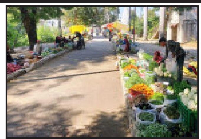
પોતાની મનમાની થી વસુલ કરાઈ છે જેની ઈજારાદાર ને કોઈ ખબર નથી. જ્યારે પાલિકા વિસ્તારના લોકો પાસે ૨૦ રૂપિયા ની એકજ પહોંચ અપાતી હોય છે. આ અંગે કોઈપણ અપીલ કે દલીલ ગામડાના લોકો કરના લીધે ફરી શકાતી નથી. અને કેમ બે પહોંચ

દાહોદ, દેવગઢબારીયા પાલિકા વિસ્તાર માં હાથલારી, લારીગઘા, શાકભાજી વાળા, મોચીકામ, રમકડાં વેચનાર, કપડા વેચનાર, ખાણીપીણી ની લારીઓ, ચા વાળા આ દરેક નાના મોટા ઘંઘાવાળા પાસે પાલિકા દ્વારા ઈજારો આપીને રોજિંદી બજાર ફી વસુલ કરવામાં આવે છે. પાલિકામાં આ ઈજારાદારનો ઈજારો અમુક સમય માટે સીમિત હોય છે અને ફરીથી નવેસર તેને રીન્યુ કરવું અથવા બીજુ કોઈ આ ઈજારો લેતા હોય છે. જેમાં પાલિકા દ્વારા નક્કી કરાયેલ ઈજારાદારે બજાર ફી લેવાનું હોય છે. પરંતુ આ બજાર ફી ની રકમ ગામડા માંથી આવતા છૂટક શાકભાજી વેચનારા પાસે શુક્રવારે હાટમાં ૨૦ રૂપિયા ની બે પહોંચ આપી ૪૦ રૂપિયા ઈજારાદારના વહીવટી સ્ટાફ દ્વારા