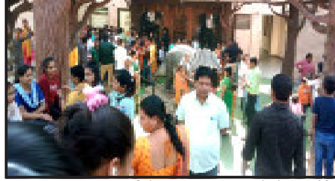
બાલાસિનોર, ડાયનાસોર ફોસિલ પાર્ક ફિજ

વિશ્વવિખ્યાત ડાયનાસોર ફોસિલ પાર્ક એ વિશ્વના ત્રીજા નંબરનું અને દેશનું પ્રથમ નંબરનું ડાયનાસોર ફોસિલ પાર્ક આવેલું છે. બાલાસિનોર થી આશરે ૧૨ કિલોમીટરના અંતરે આવેલું ડાયનાસોર ફોસિલ પાર્ક રૈથોલી પ્રવાસીઓ માટે આકર્ષણનું કેન્દ્ર બન્યું છે અને શાનિ-રવિની રજાઓ હોવાને કારણે અને નવું પર્વ હોવાને કારણે આજે ડાયનાસોર પાર્ક ખાતે માનવ મહેરામણ ઉમટી પડ્યું હતું. ડુ નું ઉદઘાટન કર્યા પછી પ્રવાસીઓનો ઘસારો જોવા મળે છે જ્યારે આ બાબતે પ્રવાસીઓને પુષ્ટતો પ્રવાસીઓએ જણાવ્યું હતું કે સરકાર દ્વારા સુવિધાઓ સારી કરવામાં આવી છે પરંતુ અહીંયા સારી હોટલ તેમજ આરામ જેવી સુવિધાઓ અભાવ જોવા મળી રહ્યો છે આ બાબતે તંત્રએ અને સરકારે જરૂરી સુવિધાઓ ઊભી કરવી જોઈએ જેથી કરીને પ્રવાસીઓને સુગમતા ખાતે માનવ મહેરામણ ઉમટી પડ્યું હતું. રહે અને પ્રવાસીઓનો વધારો થાય તેમ છે.