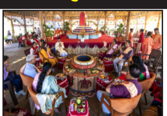
પરમ પૂજ્ય મહંત સ્વામી મહારાજના આશીર્વાચન : સંધ્યા સભામાં મહાનુભાવોના ઉદ્ગારોના અંશો અન્વ્ય કોક્રુએન્ટમાં સમાવિષ્ટ છે.