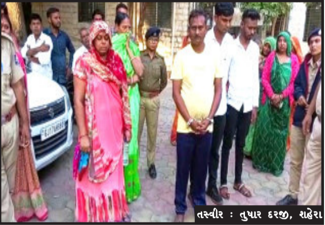
તસ્વીર : તુષાર દરશ, શહેરા

શહેરા, તાલુકાના મીરાપુર ગામ નજીક હાઈવે માર્ગ ઉપર જમીન બાબતે નસીકપુર ગામના યુવકની કરાયેલી હત્યાના મામલે પંચમહાલ જિલ્લા સેશન્સ કોર્ટે દ્વારા હુમલો કરનાર આખા પરિવારને આજીવન કેદની સજા ફટકારી હતી. વર્ષ ૨૦૨૦માં શહેરા પોલીસ મથકે બે મહિલા સહિત પાંચ વ્યક્તિઓ સામે નોંધાયેલા હત્યાના ગુનેહમાં ઝડપી નિર્દોષ લઈ સેશન્સ કોર્ટે ઐતિહાસિક ચૂકાદો આપ્યો હતો. પ્રાપ્ત વિગતો અનુસાર