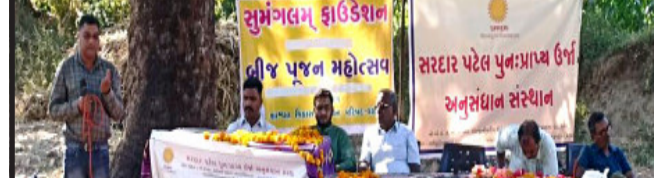
ઘોઘંબા તાલુકાના સરસવા ગામે શાશ્વત વિકાસ પ્રબોધન પરિષદ વડોદરાના માર્ગદર્શન હેઠળ સુમંગલમ ફાઉન્ડેશન સંચાલિત હાથપી માતા પરિસર સેવા સમિતિ દ્વારા સરસવા ગામે હાથપી માતા ફળિયામાં બીજ પૂજન મહોત્સવની ઉજવણી કરવામાં આવી હતી.