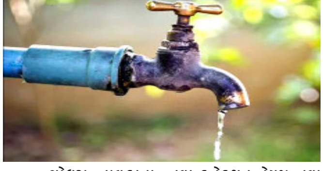
ગોધરા તાલુકાના જુની ઘરી ગામે નલ સે જલ યોજનામાં ગામમાં કોન્ટ્રાક્ટર દ્વારા પાઈપ લાઈન અને નવી પાઈપના ટાંકાનું કામ કરવામાં આવ્યું હતું. તેમાં પાણીના ટેસ્ટીંગ દરમિયાન પંચકો નિકળતા યોજનામાં મોટા પ્રમાણમાં ભ્રષ્ટાચાર થયો હોવાનું રજુઆત વાસ્તો કચેરીના ના.કાર્યપાલક ઈજનેરને કરવામાં આવી.

ટેસ્ટીંગ કરવામાં આવ્યું ત્યારે અલગ અલગ ફળીયા-મહોદામાં ૨૦૦ થી વધુ પંચરો નિકળ્યા હતા. બાદમાં પંચરો બનાવીને ટેસ્ટીંગ કરતા વધુ પંચરો નિકળ્યા હતા. જુનીઘરી ગામે પાઈપના ટાંકાની મેઈન લાઈનમાં ૨૦ થી વધુ પંચરો છે. કૈલાશ નગરમાં જુની પાઈપ લાઈનમાં કનેક્શનો આપેલ છે. તેમાં એક જ ટેન્સીંગ ડબલ પાઈપ નાખેલ છે. પાઈપના ટાંકામાં પણ હલ્કી ગુણવત્તાનો