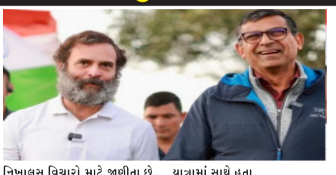
નિખાલસ વિચારો માટે જાણીતા છે. એન રઘુરામ રાજને રાહુલ ગાંધી સાથે હાથ મિલાવ્યા હતા. રઘુરામ રાજને ભાદોતીથી ચાલવાનું શરૂ કર્યું અને રાહુલ ગાંધી સાથે લાંબી ચર્ચા કરી. નોંધનીય છે કે ભારત જોડો યાત્રામાં વિવિધ ક્ષેત્રની જાણીતી ડસ્તીઓ સતત જોડાઈ રહી છે. અગાઉ ફિલ્મ ઈન્ડસ્ટ્રીના અનેક લોકો આ યાત્રામાં ભાગ લેવા આવ્યા હતા. આ ઉપરાંત ત મુખ્યમંત્રી અશોક ગેહલોત, સચિન પાચલટ, ગોવિંદ સિંહ દોતાસરા અને પ્રતાપ સિંહ ખાચરિયાવાસ પણ રાહુલ ગાંધીની યાત્રામાં સાથે હતા. તમને જણાવી દઈએ કે મનમોહન સિંહ જ્યારે પીએમ હતા ત્યારે રઘુરામ રાજનેને રિઝર્વ બેંક ઓફ ઈન્ડિયાના ગવર્નર બનાવવામાં આવ્યા હતા અને જ્યારથી તેઓ સત્તામાં આવ્યા છે ત્યારથી રાજન ખુલ્લેઆમ મોટી સરકારની ટીકા કરી રહ્યા છે. રાજને અનેક વખત કેન્દ્ર સરકારની આર્થિક નીતિઓ પર પ્રહારો કર્યાં છે અને સુધારાની વાત કરી છે. આવી સ્થિતિમાં રાજનનો ભારત જોડો યાત્રામાં સામેલ થયા બાદ અને રાહુલ ગાંધી સાથે તાલ

સવાઈમાધોપુર, આજે બુધવારે રાહુલ ગાંધીની 'ભારત જોડો યાત્રા'નો રાજસ્થાનમાં ૧૦મો દિવસ હતો આજે બુધવારે સવાઈ માધોપુરના ભાદોતીથી ભારત જોડો યાત્રા નીકળી હતી. રાહુલ ગાંધીની યાત્રા આજે ઈોસા જિલ્લામાં પ્રવેશ કરશે. આ યાત્રા સવારે ૧૦ વાગ્યે બામણવાસના બાઢહશ્યામપુરા ટોડ પહોંચી હતી અહીં મુસાફરો ટોડમાં બપોરનું ભોજન લીધું હતું ત્યારબાદ યાત્રાનો બીજો તબક્કો બપોરે ૩:૩૦ વાગ્યાથી શરૂ થઈ હતી આ યાત્રામાં આરબીઆઈના પૂર્વ ગવર્નર એન. રઘુરામ રાજને પણ ભારત જોડો યાત્રામાં ભાગ લીધો હતો. આ યાત્રા દરમિયાન રાહુલ ગાંધી અને રઘુરામ રાજન વચ્ચે લાંબી વાતચીત થઈ હતી. યુપીએ સરકારમાં રઘુરામ રાજનને આરબીઆઈના ગવર્નર બનાવવામાં આવ્યા હતા. રઘુરામ રાજન આર્થિક મુદ્દાઓ પર પોતાના