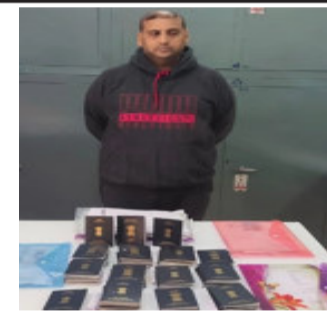
યુએસ-કેનેડા બોર્ડર પર ગત ૧૮ જાન્યુઆરીએ અમેરિકામાં ગેરકાયદે રીતે ધૂસવા જતાં ભારે ઠંડીને કારણે થીજી જવાથી મૃત્યુ પામેલાં એક બાળક સહિતની ચારેય વ્યક્તિ ગુજરાતના ડીંગુયા ગામની હોવા અંગેની પુષ્ટિ કેનેડાની મોનિટોરિંગ રોયલ કેનેડિયન માઉન્ટેડ પોલીસે કરી હતી. આ અંગેની માહિતી તેમણે ભારતના