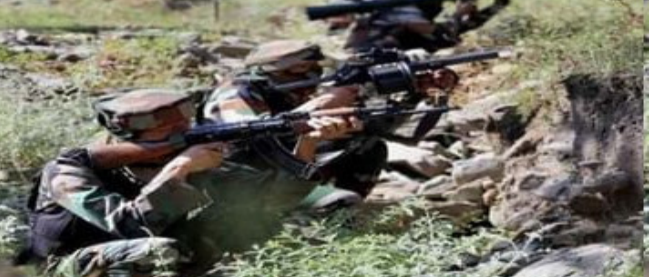
તવાંગ સેક્ટરમાં એલએસી પર ૯ ડિસેમ્બરે પીએલએ સૈનિકો સાથે અથડામણ થઈ હતી. અમારા સૈનિકોએ નિશ્ચય સાથે ચીની સૈનિકોનો સામનો કર્યો. આ અથડામણમાં બંને પક્ષના કેટલાક સૈનિકોને સામાન્ય ઈજાઓ થઈ હતી. સૂત્રોએ જણાવ્યું હતું કે બંને પક્ષો તરત જ વિસ્તારમાંથી પીછેહઠ કરી ગયા હતા. ચીન અરુણાચલ પ્રદેશના તવાંગને તિબેટનો ભાગ માને છે. ચીનની ફાઈવ ફિંગર્સ ઓફ તિબેટ નીતિમાં તવાંગનો પણ સમાવેશ થાય છે. ૨૦૧૭માં ડોકલામમાં પણ ચીનની ફાઈવ ફિંગર્સ પોલિસી હેઠળ

નવીદિલ્હી, ડોકલામ અને લદાખ બાદ હવે ચીને તવાંગમાં પણ ઘુસણખોરીનો પ્રયાસ કર્યો છે, જે બાદ ભારતીય અને ચીની સૈનિકો વચ્ચે અથડામણ થઈ છે. ૯ ડિસેમ્બરે પેટ્રોલિંગ દરમિયાન બંને દેશોની સેના આમને-સામને આવી ગઈ હતી. મળતી માહિતી મુજબ આ વિવાદ ચીન તરફથી શરૂ થયો હતો. ત્યારબાદ ભારતીય સૈનિકોએ જવાબી કાર્યવાહી કરી અને ૩૦૦ ચીની સૈનિકોનો પીછો કર્યો. જેમાં ૨૦-૩૦ સૈનિકો ઘાયલ થયા હતા. આ અથડામણ તવાંગ સેક્ટરમાં ત્યારે થઈ જ્યારે બંને દેશોની સેના પેટ્રોલિંગ દરમિયાન એકબીજાની સામે આવી ગઈ. ચીનની સેના એલએસી સુધી પહોંચવાનો પ્રયાસ કરી રહી હતી. તે જ સમયે, ભારતીય સૈનિકોએ ચીની સૈનિકોનો મજબૂતીથી સામનો કર્યો. આ અથડામણ ૯ ડિસેમ્બરે થઈ હતી. એક સૂત્રએ જણાવ્યું કે,