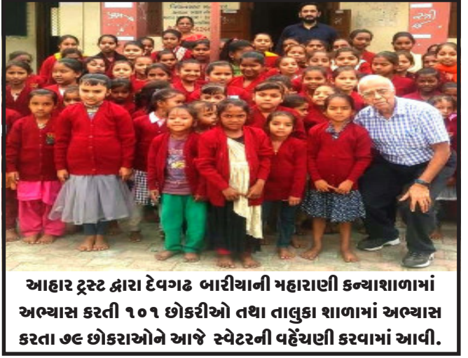
તસ્વીર : ચંકજ પંડીત, ઝાલોદ

દાહોદ, ભારતીય હવામાન વિભાગ દ્વારા કરાયેલી આગાહી મુજબ આગામી તા. ૧૪ ડિસેમ્બરના રોજ મધ્ય તેમજ દક્ષિણ ગુજરાતમાં સામાન્ય થી હળવો વરસાદ થવાની આગાહી છે. જે અન્યથે દાહોદના નિવાસી અધિક કલેક્ટરએ એપીએમસી તથા અનાજના અન્ય ગોડાઉનમાં અનાજના જથ્થાને નુકશાન ના થાય એ માટે જરૂરી વ્યવસ્થા કરવા સંબંધિત અધિકારીઓને જણાવ્યું છે.