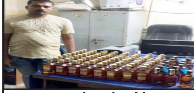
હાલોલ, શુ. ૧૭.સીસી.૬૮૯૩ ના ચાલક

હાલોલ શીવ વાટીકા સોસાયટીના નાકા પાસે સ્કુટર ઉપર થેલામાં લઈ જવાતા ઈંગ્લીશ દારૂ કિંમત ૪૮,૨૩૦/- રૂપિયાના મુદ્દામાલ સાથે એક ઈસમને ઝડપી પાડવામાં આવ્યો. આ બાબતે હાલોલ શીવ વાટીકા સોસાયટીના હાલોલ પોલીસ મથકે ફરિયાદ નોંધાવા પામી છે.