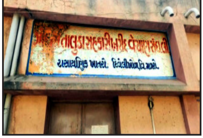
સીઝનના પાકનું વાવેતર કરેલ છે. ખેડૂતોને રવિ પાક માટે ખાતરની ખુબ જરૂરીયાત ઉભી થયેલ છે.

ગોધરા, પંચમહાલ જીલ્લામાં રવિ સીઝનમાં ખેડૂતોએ પાકની વાવણી કરેલ છે અને પાકને ખાતરની જરૂરીયાત ઉભી થયેલ છે. ખાતરની અછત ઉભી થતાં ખાતર ખરીદી કેન્દ્રો ઉપર ખેડૂતોને લાંબા લાઈનોમાં ઉભા રહેવું પડે છે. ત્યારે જીલ્લામાં રવિ સીઝન માટે ખેડૂતોની જરૂરીયાત મુજબ ખાતરનો જથ્થો ફાળવવામાં આવે તેવી માંગ સાથે કૃષિ મંત્રીને ગુજરાત પ્રદેશ ભાજપ કારોબારી સભ્ય દ્વારા લેખિત રજુ કરાઈ.