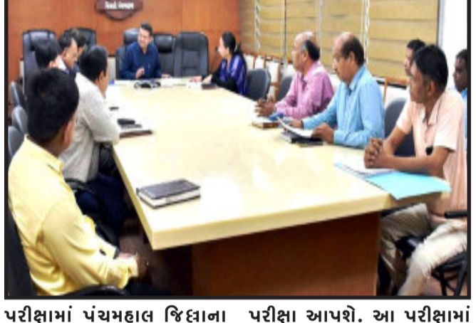
પરીક્ષામાં પંચમહાલ જિલ્લાના ગોધરા, કાલોલ, હાલોલ, શહેરા અને મોરવા(હ)ના ૩૧ કેન્દ્રો ખાતે થી ૮,૬૭૦ ઉમેવારો

ગોધરા, ગુજરાત જાહેર સેવા આયોગ, ગાંધીનગર દ્વારા મુખ્ય અધિકારી(નગરપાલીકા), વર્ગ-૩ ( જાહેરાત ક્રમાંક:૧૧/૨૦૨૨-૨૩)ની જગ્યાઓ પર ભરતી કરવા માટેની પ્રિલિમિનરી (પ્રાથમિક) પરીક્ષા તા.૧૮/૧૨/૨૦૨૨ને રવિવારના રોજ યોજનાર છે. આ પરીક્ષાના સુચાઈ સંચાલન, આયોજન અને જરૂરી વ્યવસ્થાના પરામર્શ અર્થે જિલ્લા કલેક્ટરની કચેરી ગોધરા-પંચમહાલ ના વી.સી.હોલમાં નિવાસી અધિક કલેક્ટર એમ.ડી.યુ.ડી.સમાન। અધ્યક્ષસ્થાને પરીક્ષા સમિતિના સભ્યો સાથે જિલ્લા સ્થાયી પરીક્ષા સમિતિની બેઠક યોજાઈ હતી.