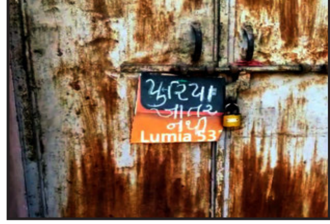
ઉપર ખેડૂતો ખાતર ખરીદવા લાંબી લાઈનોમાં ઉભા રહેવું પડે છે. જીલ્લામાં ચાલુ વર્ષ અંદાજિત ૬,૦૦૦ મે.ટન ખાતરની જરૂરીયાત છે. તેની સામે ખાતર વિતરણ કરતી કંપનીઓ દ્વારા

લક્ષ્યાંક મુજબની ફાળવણી થયેલ નથી. જેને કારણે ખેડૂતોને ખાતરનું વિતરણ થઈ શકતું નથી અને ખેડૂતોના ઉભા પાકને નુકશાન થઈ રહ્યું છે. પંચમહાલ જીલ્લામાં ખાતરનું વિતરણ કરતી કંપનીઓ ઈફ્કો, કુંભકો, નર્મદા કંપનીઓ દ્વારા સહકારી સંસ્થાઓને ફાળવણી કરવાની જગ્યાએ એત્રો સેન્ટરો અને પ્રાઈવેટ સેન્ટરોને ખાતરની વધારે ફાળવણી કરે છે. સાથે રાસાયણિક ખાતર કંપનીઓ સહકારી સંસ્થાઓને વધારાની પ્રોડક્ટ ખરીદવા દબાણ કરવામાં આવે છે. જ્યારે એત્રો સેન્ટરો અને પ્રાઈવેટ