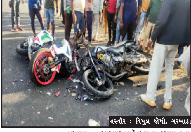
તસ્વીર : વિષ્ણુ જોષી, ગરબાડા

ગરબાડા, ગરબાડા તાલુકાના દાહોદ નેશનલ હાઈવે પર ખરજ નજીક બે બાઈકો વચ્ચે અકસ્માત સર્જાતા હોય છે. જેમાં અજાણ્ય વ્યક્તિઓને ઈજાઓ ગંભીર પહોંચી હતી અકસ્માતની જાણ થતા સ્થાનિક લોકો ઘટના સ્થળે દોડી આવ્યા હતા અને ૧૦૮ દ્વારા ઈજાગ્રસ્તોને સારવાર માટે રવાના કરાયા હતા. ઉદ્દેશનીય છે કે દાહોદ ગરબાડા રોડ ઉપર ઘૂમ રટાઈલમાં બાઈકો ચલાવવાનું ચલાવે જ વધી ગયું છે પોલીસ તંત્ર દ્વારા આ બાબતને ગંભીરતાથી લઈને આવા તત્વો પાસે વાહન ચલાવવા માટેનું લાયસન્સ છે કે નહીં તે સિવાય અન્ય દસ્તાવેજી પુરાવો છે કે નહીં તેની સાધન તપાસ કરવામાં આવે છે. તે બાબત જરૂરી બની છે અહીંયાના વિસ્તારમાં વાહન ચાલકો નીતિ નિયમોને નેવી મૂકી ચૂક્યા હોય તેમ લાગી રહ્યું છે, તેમને પૂછવાનું કોઈ જ નથી.