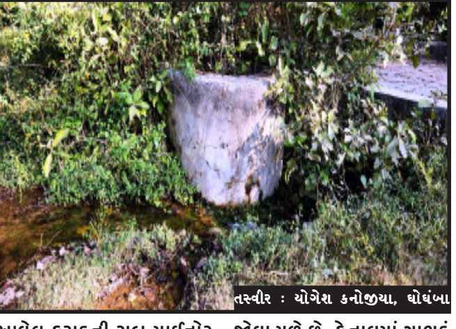
તસ્વીર : ચોગેશ કનોજીયા, ઘોઘંબા

ઘોઘંબા, ઘોઘંબા તાલુકાના નવાગામ પાસે આવેલી કરાડ નદીની મુખ્ય કેનાલ માંથી નીકળતી સબ માઈનોર કેનાલમાં ગાભડું પડતા હજારો ગેલન પાણીનો વેદફાટ થઈ રહ્યો છે. જેના કારણે ખેડૂતો પાણીથી વંચિત રહી જાય છે. નહેરના પાણી ગામમાં આવતા ગટરના ગંદા પાણીમાં કેનાલના પાણી ભેગાં રસ્તા ઉપર પાણી ફળી વળ્યા હતાં. નવાગામ પાસે