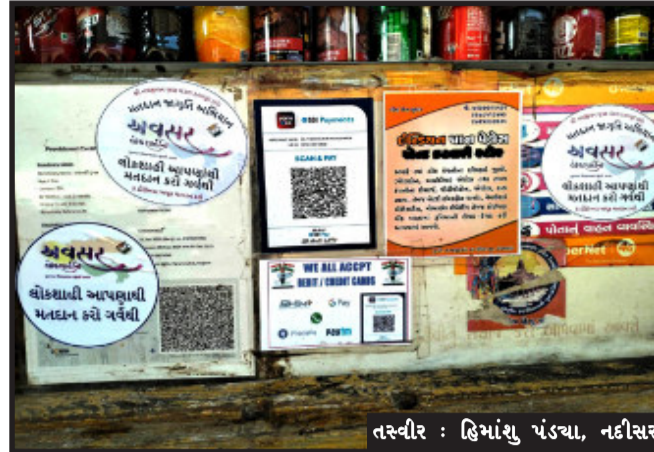
તસ્વીર : હિમાંશુ પંડ્યા, નહીસર

પંચમહાલ જિલ્લામાં રતનપુર ગામના યુવાન દુકાનદાર દ્વારા અનોખું મતદાન જાગૃતિ અભિયાન