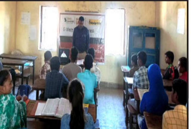
તા.૨૮/૧૧/૨૨ ના રોજ નવચેતના માધ્યમિક શાળા, ગોધરા ખાતે હેલ્પએજ ઈન્ડિયાના સોશયલ પ્રોટેક્શન ઓફિસર અને ફિલ્ડ રિસ્પોન્સ ઓફિસર દ્વારા ઈ-વેસ્ટ સ્કૂલ અવેરનેસ કાર્યક્રમ અંતર્ગત વિદ્યાર્થીઓને ઈ-વેસ્ટ (ઇલેક્ટ્રોનિક કચરા) વિશે, તેના નિકાલ અંગે, તેના લાભ-ગેરલાભ વિશે યોગ્ય માર્ગદર્શન આપવામાં આવ્યું હતું.

જી.આઈ.ડી.સી. સુવિધાનો અભાવ જેવા મુદ્દાઓ મુખ્ય રહેશે. શહેરા વિધાનસભા ચૂંટણીમાં ઉમેદવારોનું ભાવિ શહેરા મત વિસ્તારમાં ૧,૩૨,૫૦૫ પુરૂષ મતદારો, ૧,૨૫,૫૨૦ સ્ત્રી મતદાર મળી કુલ ૨,૫૮,૦૨૫ મતદારો નક્કી કરશે. આ બેઠક ઉપર જો જાતિગત સમીકરણ જોવા જઈએ તો ઓબીસી મતદારોનું મુખ્યત્વે રહેલ છે. ઓબીસી મતદારોની સંખ્યા ૧,૭૮,૫૮૦, એસ.ટી. ૨૯,૫૬૮, એસ.સી. ૧૬,૭૮૨, રાજપૂત ક્ષત્રિય ૧૩,૯૬૮ મતદારો જે તરફ મતદાન કરે તે ઉમેદવારની જીત નિશ્ચીત મનાઈ રહી છે