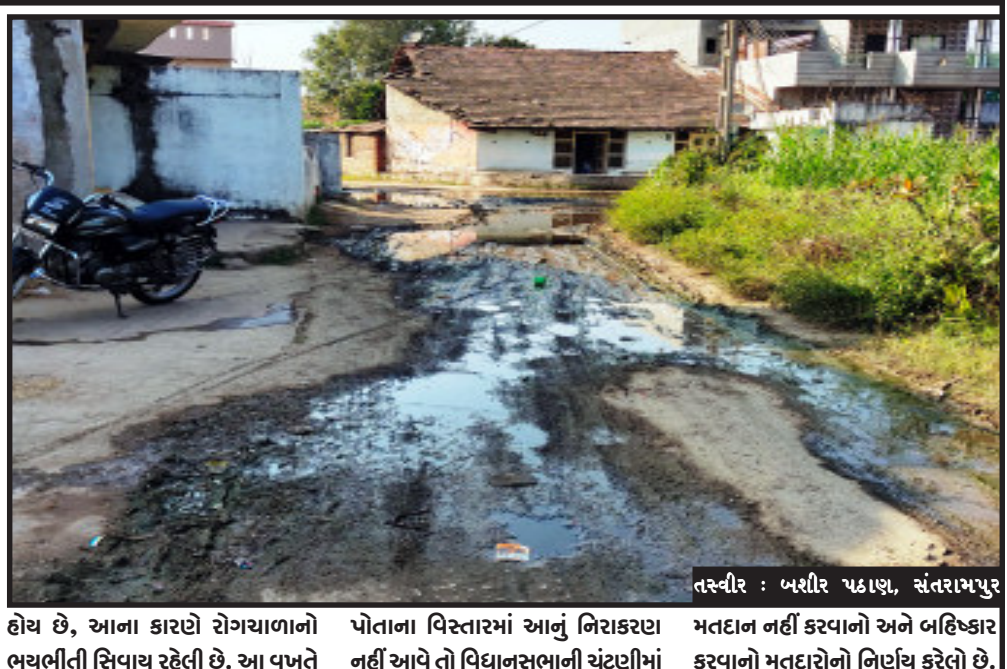
તસ્વીર : બશીર પકાણ, સંતરામપુર

સંતરામપુર, સંતરામપુર તાલુકાના મોટી સરસણ ગામના રહીશોને ઘર આંગણે ઉભરતું ગંદું પાણી, કાદવ-કિચડ સંતરામપુર તાલુકાના મોટી સરસણ વહાકરવાસ ફળિયામાં ગંદા પાણીનો નિકાલ ના થતા અને ગ્રામજનોના ઘરની આંગણે જ કાદવ-કિચડના કારણે ઘરની બહાર પસાર થવા માટે પાણી ભરેલા કાંચની બોગવની પડતી હોય છે. સરપંચ, તલાટી, તાલુકા વિકાસ અધિકારી, ઉચ્ચ કક્ષાએ આ વિસ્તારના રહીશોએ વારંવાર રજૂઆત કરવા છતાં કોઈ નિરાકરણ આવેલ નથી. આ વિસ્તારમાં આશરે ૩૦૦ થી ૪૦૦ જેટલા માણસો અહીંયા રહે છે. કાચમ માટે દરેક વ્યક્તિને આવા કાદવ-કીચડમાં જ પગ મૂકીને પસાર થવું પડતું