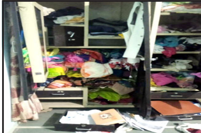
સવારના રૂપાખેડા ગામના પાડોશી

ફતેપુરા, ફતેપુરા તાલુકાના ગ્રામ્ય વિસ્તારોમાં ચોર લોકો રાત્રિ સમયે બંધ મકાનોને નિશાન બનાવી રહ્યા છે. જેમાં ગતરોજ રાત્રિના ફતેપુરા તાલુકાના સુખસર પાસે આવેલ રૂપાખેડા ગામે ત્રણ બંધ મકાનોને ચોર લોકોએ નિશાન બનાવી દરવાજાના નકુચા કાપી એક મકાન માંથી સોના-ચાંદીના દાગીના તથા રોકડ રૂ.૨૫,૦૦૦/- ની ચોરી કરી પલાયન થઈ ગયા હોવા બાબતે મકાન માલિક દ્વારા સુખસર પોલીસ સ્ટેશનમાં લેખિત જાણ કરવામાં આવી હોવાનું જાણવા મળે છે. જ્યારે રૂપાખેડા ગામમાં જ અન્ય બે મકાનોમાં ચોર લોકોએ ચોરી કરવાનો પ્રયાસ કરતા પાડોશીઓ જાગી જતા ચોર લોકો મોટર સાયકલો ઉપર ભાગી છૂટ્યા હોવાનું જાણવા મળે છે.