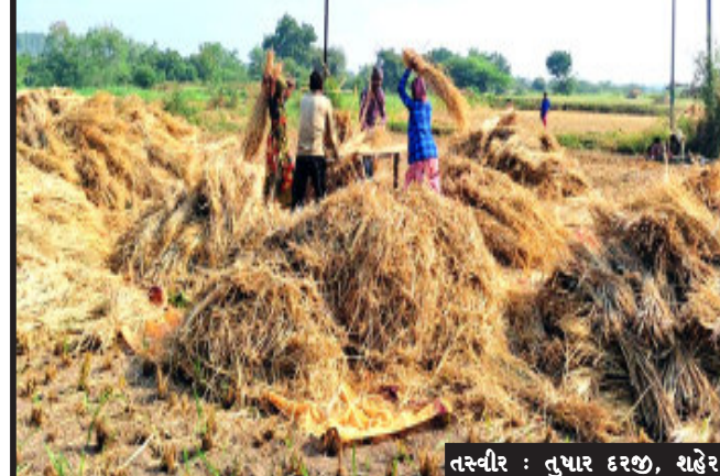
શહેરા, શહેરા તાલુકાના ગ્રામીણ વિસ્તારોમાં ડાંગરના પાકની કાપણી શરૂ થતા ખેત મજૂરોને રોજગારી મળી રહી છે. ખેડૂત અને ખેડૂતના પરિવાર ખેતરમાં ડાંગરને ચૂડતા જોવા મળતા હોય છે. ખેડૂતોના જણાવ્યા અનુસાર ખેત ઉત્પાદનના પોષણક્ષમ ભાવ મળી રહ્યા નથી. શહેરા તાલુકાના ગ્રામીણ વિસ્તારમાં મૂખ્યત્વે ડાંગર અને મકાઈની ખેતી કરવામાં આવે છે. ગોધરાના સીટી ટીકા નં.૧૪/૨૨૮ વાળી મિલકતો કાચદા વિરૂદ્ધ ગેરકાયદેસર વેચાણ કરેલ સામે યોગ્ય કાયદેસર જીલ્લા કલેક્ટર પંચમહાલ ગોધરા કરે અને તત્કાલીક રેવન્યુ સાહે પકેલ નોંધો નામંજુર કરી કરાવી મહાલક્ષ્મી માતાના દુસ્ત તથા નોંધણી નંબર દર્શાવવા કાયદેસરની હિન્દુ સંગઠનની માંગો ઉઠવા પામેલ છે અને આ મિલકતો ઉપર તત્કાલીક કોઈપણ જાતનો ફેરફાર ના કરે કરાવે તેવો મનાઈ હુકમ કરી યોગ્ય કાર્યવાહી કરી કરાવી વિનંતી લાગતા વળગતા વિભાગોની જરૂરી સુચનાઓ આપી અપાવી જવા સાડું..