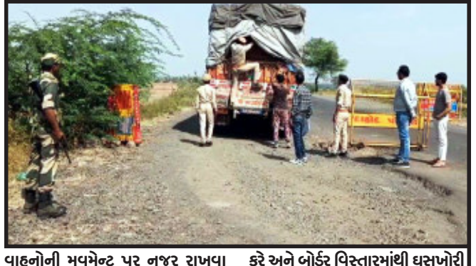
વાહનોની મુખ્યેન્ટ પર નજર રાખવા તથા ચૂંટણી દરમિયાન અવ્યવસ્થા ફેલાવવા માટે કેટલાંક તત્ત્વો આંતરકી પ્રવૃત્તિ કે અન્ય ગેરકાયદેસર પ્રવૃત્તિના કરે અને બોર્ડર વિસ્તારમાંથી ઘૂસાખોરી ના કરે તે માટે બીએસએફ જવાનો તથા ગરબાડા પોલીસ સ્ટાફ દ્વારા બોર્ડર પર સઘન ચેકીંગ હાથ ધરવામાં આવી છે.

ગરબાડા, ગુજરાત વિધાનસભાની ચૂંટણી સંદર્ભમાં કાયદા અને વ્યવસ્થાની સ્થિતિને લઈને ગુજરાત પોલીસ સહિતની તમામ સુરક્ષા એજન્સી એક્શન મોડમાં આવી છે. ત્યારે ગરબાડા મિનાક્યાર બોર્ડર ચેક પોસ્ટ પર બીએસએફના જવાનોને પોલીસ સ્ટાફ દ્વારા સઘન ચેકીંગ હાથ ધરવામાં આવી છે. ગુજરાત વિધાનસભાની ચૂંટણીને લઈને ચૂંટણી પંચ દ્વારા આપવામાં આવેલી સુચનાઓ અને આચાર સંહિતાનો કડક અમલ થાય તે માટે ચેક પોસ્ટ પર થતી શંકાસ્પદ વાહનોની મુખ્યેન્ટ પર નજર રાખવા તથા ચૂંટણી દરમિયાન અવ્યવસ્થા ફેલાવવા માટે કેટલાંક તત્ત્વો આંતરકી પ્રવૃત્તિ કે અન્ય ગેરકાયદેસર પ્રવૃત્તિના કરે અને બોર્ડર વિસ્તારમાંથી ઘૂસાખોરી ના કરે તે માટે બીએસએફ જવાનો તથા ગરબાડા પોલીસ સ્ટાફ દ્વારા બોર્ડર પર સઘન ચેકીંગ હાથ ધરવામાં આવી છે.