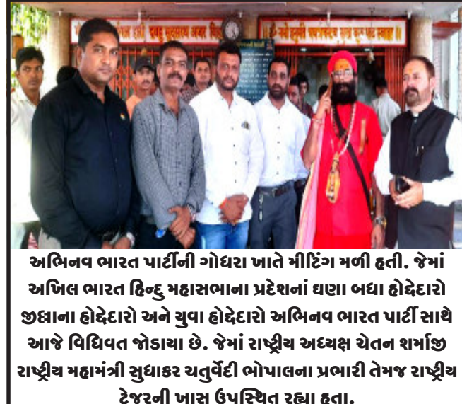
અભિનવ ભારત પાર્ટીની ગોધરા ખાતે મીટિંગ મળી હતી. જેમાં અભિલ ભારત હિન્દુ મહાસભાના પ્રદેશનાં ઘણા બધા હોદ્દેદારો જીલ્લાના હોદ્દેદારો અને યુવા હોદ્દેદારો અભિનવ ભારત પાર્ટી સાથે આજે વિધિવત જોડાયા છે. જેમાં રાષ્ટ્રીય અધ્યક્ષ ચેતન શર્માજી રાષ્ટ્રીય મહામંત્રી સુધાકર ચતુર્વેદી ભોપાલના પ્રભારી તેમજ રાષ્ટ્રીય ટ્રેજરની ખાસ ઉપસ્થિત રહ્યા હતા.

કાપણી શરૂ થતા ખેત મજૂરોને પણ રોજગારી મળી રહી છે. ખેતરમાં ખેત મજૂરો સહિત ખેડૂત અને તેમનો પરિવાર પણ ડાંગરની કાપણી કરતા જોવા મળી રહ્યા હતા. આ વર્ષે તાલુકામાં વરસાદ પડ્યો પણ તેની સમય અનુકૂળતા પ્રમાણે પડ્યો હોવાને કારણે ડાંગરના પાકમાં ઉત્પાદન ઓછું મળશે એવું ખેડૂતો પાસેથી જાણવા મળ્યું છે. ડાંગરના પાકની કાપણી બાદ ડાંગરને ચૂડવાની કામગીરી જોરજોરથી ચાલી રહી હતી. ડાંગરના સારા ભાવની આશા ખેડૂતો રાખી રહ્યા છે.