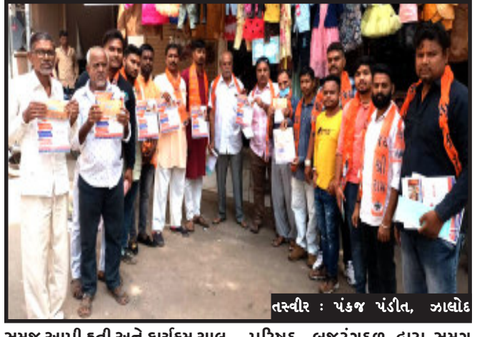
સમજ આપી હતી અને કાર્યક્રમ ચાલુ કરવામાં આવ્યું હતું. વિશ્વ હિન્દુ પરિષદ, બજરંગદળ દ્વારા સમગ્ર વિશ્વના ૩૨ દેશોમાં કાર્ય ચાલે છે,

ઝાલોદ, સમગ્ર ભારત દેશમાં હિન્દુ એકતા અને સંગઠનને વધુ મજબૂત બનાવવા માટે વિશ્વ હિન્દુ પરિષદ અને બજરંગ દળ પ્રયત્નશીલ રહે છે. આજ રોજ ઝાલોદ નગરમાં બજરંગ દળ અને વિશ્વ હિન્દુ પરિષદના કાર્યકરો ભરત ટાપર પર મોટા પ્રમાણમાં ભેગા થયા હતા અને ભારત માતાકી જયનાં નારા સાથે હિન્દુ હિતચિંતક અભિયાનનો પ્રારંભ કરવામાં આવ્યું હતું તેમાં નગરમાં વસતા દરેક ઘર, દુકાન અને ઓફિસ પર જઈ હિન્દુ હિતચિંતક અભિયાન વિશે લોકોને