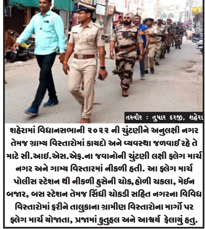
શહેરામાં વિધાનસભાની ૨૦૨૨ ની ચૂંટણીને અનુલક્ષી નગર તેમજ ગ્રામ્ય વિસ્તારોમાં કાચદો અને વ્યવસ્થા જળવાઈ રહે તે માટે સી.આઈ.એસ.એફ.ના જવાનોની ચૂંટણી લક્ષી ફ્લેગ માર્ચ નગર અને ગામ્ય વિસ્તારમાં નીકળી હતી. આ ફ્લેગ માર્ચ પોલીસ સ્ટેશન થી નીકળી હુસેની ચોક, હોળી ચકલા, મેઈન બજાર, બસ સ્ટેશન તેમજ સિંધી ચોકડી સહિત નગરના વિવિધ વિસ્તારોમાં ફરીને તાલુકાના ગ્રામીણ વિસ્તારોના માર્ગો પર ફ્લેગ માર્ચ યોજાતા, પ્રજામાં કુતુહલ અને આશ્ચર્ય ફેલાયું હતું.

દવેની દલીલો ધ્યાને લઈ તારીખ ૨૮/૯/૨૨ ના રોજ રોજમદાર કામદારોને સરકારના તારીખ ૧૭/૧૦/૮૮ ના પરિપત્ર મુજબ તમામ લાભો આપવા તેમજ જે અરજદારોએ વર્ષ ૨૦૦૫ પહેલા નોકરીમાં જોડાયેલા હોય તેઓને જૂની પેન્શન યોજનાનો લાભ આપવાનો આજરી આદેશ ફરમાવેલ છે. આદેશથી ૮ કામદારો ઉપરાંત ફોરેસ્ટ વિભાગના ૨૦૦૫ વર્ષ પહેલા જે કામદારો રોજમદાર તરીકે ફરજ માં હાજર થયા હશે તેમને પણ જૂની પેન્શન યોજનાનો લાભ આપવાનો રહેશે આ આદેશથી આઠ કામદારો સહિત અન્ય ફોરેસ્ટ વિભાગમાં નોકરી કરતા રોજમદાર કામદારોને પણ જૂની પેન્શન યોજનાનો લાભ મેળવવા ના હકદાર બનશે. આમ, આ ૮ કામદારો ઉપરાંત ફોરેસ્ટ વિભાગના અન્ય કામદારને પણ જૂની પેન્શન યોજનાનો લાભ મળશે. આ આદેશથી ફોરેસ્ટ વિભાગના તમામ કામદારોમાં આનંદ છવાયો છે.