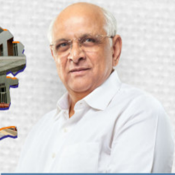
SHRI BHUPENDRA PATEL Hon'ble Chief Minister of Gujarat