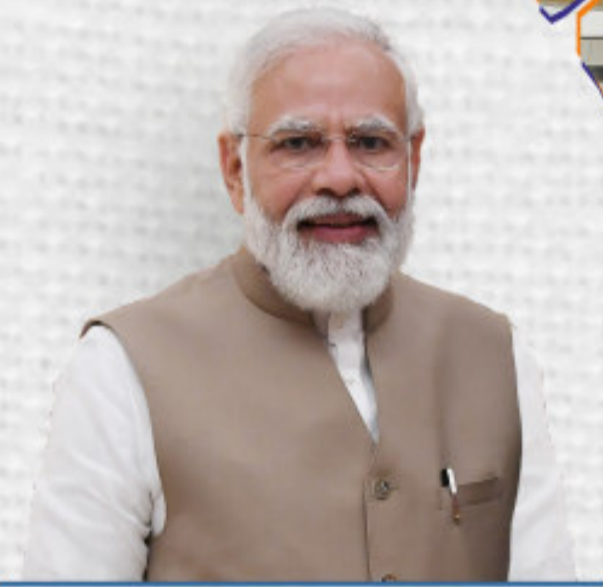
SHRI NARENDRA MODI Hon'ble Prime Minister of India