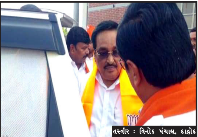
તસ્વીર : વિનોદ પંચાલ, દાહોદ

પ્રમુખ સી.આર.પાર્ટીલ તાબડતોડ દાહોદ જિલ્લાની મુલાકાતે ઘોડી આવ્યા હતા અને કમલમ ખાતે ખાનગી મિટિંગ મારફતે નારાજ કાર્યકર્તાઓને મનાવવા માટે પ્રયાસો હાથ ધરી કેમેજ કંટ્રોલના અંતિમ પ્રયાસો કરતા મળ્યા હતા. ગુજરાત વિધાનસભાની ચૂંટણીને હવે ગણતરીના દિવસો બાકી રહ્યા છે. ત્યારે દાહોદ જિલ્લામાં સમાવેશ કુલ છ વિધાનસભા બેઠકો પર આઈબીના રિપોર્ટ પ્રમાણે પાંચ વિધાનસભા બેઠકો પર કોંગ્રેસ અને આમ આદમી પાર્ટી વચ્ચે સીધી ટક્કર જોવા મળી રહી છે. તેમ હાલના તબક્કે કહેવાય રહ્યું છે. સાથે સાથે ટિકિટોની વહેંચણી બાદ અસંતુષ્ટો