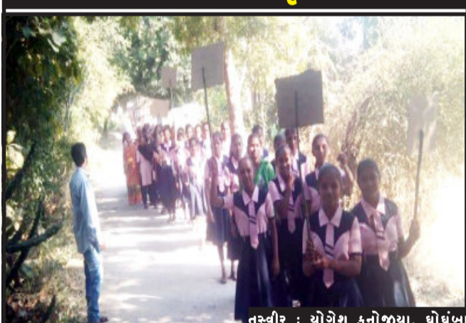
ઘોંબા, દિન બી.બી.પટેલ ઉ.બુ.શાળા, ખાન પાટલા, તા.ઘોંબા, જી.પંચમહાલના વિદ્યાર્થીઓ દ્વારા અવસર લોકશાહી વિધાનસભા ૨૦૨૨ સામન્ય ચૂંટણીમાં મોટી સંખ્યામાં મતદાન પ્રતિક્ષા ભાગ લઈ મતદાન કરે તે માટે પ્રોત્સાહિત કરવા માટે શાળાના