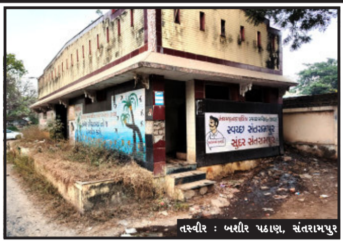
તસ્વીર : બશીર પઠાણ, સંતરામપુર

સંતરામપુર, સંતરામપુર નગર પાલિકા દ્વારા મામલતદાર કમ્પાઉન્ડમાં શહેરી વિકાસ યોજના માંથી માતલર રકમ ખર્ચ કરીને લોકો માટે બનાવવામાં આવેલું હતું, પરંતુ જાહેર શૌચાલય ૨૦૦૮માં તેને બનાવવામાં આવેલું હતું પરંતુ આજ દિન સુધી તેનો ઉપયોગ કરવામાં આવેલો જ નથી. કોબી પ્રકારની જાળવણી રાખવામાં આવતી નથી. જાહેર શૌચાલય બનાવ્યા ૧૫ વર્ષ હજુ સુધી તેનો ઉપયોગ કરી શકાતો જ નથી. સંતરામપુર મામલતદાર કચેરીમાં મોટી સંખ્યામાં ગ્રામ્ય વિસ્તારો માંથી મહિલાઓને