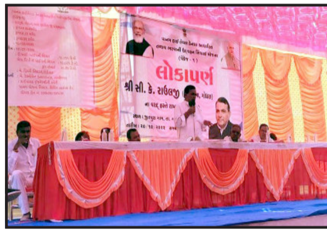
મારફતે કુલ ૧૩ ગામના ૨૧ તળાવો ભરવાની યોજના છે. આ યોજના પાઈપલાઈનમાં ૬૨૫૦૦ મી. કુવાઓ બનાવી. આ વિસ્તારના અંદાજે