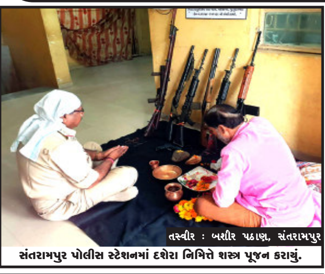
સંતરામપુર પોલીસ સ્ટેશનમાં દશેરા નિમિત્તે શસ્ત્ર પૂજન કરાયું.