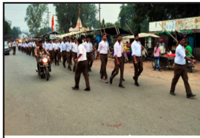
સંતરામપુરમાં દશેરા નિમિત્તે રાષ્ટ્રીય સેવમ સંઘ દ્વારા રેલી યોજાઈ અને સાઈબાબા પાલકી શોભા યાત્રા યોજાઈ.

ગરબાડા, તૂટેલા રસ્તાના કારણે તહેવારીયા દિવસોમાં નિર્દોષ લોકોએ મોતાનો જીવ ગુમાવવો પડે છે. ગરબાડા રિલાયન્સ પમ્પ થી પાંચવાડા સુધીનો ડામર રસ્તો હાલમાં એકદમ જર્જરિત બન્યો છે જેને કારણે આડાઓ પડી ગયા છે જેના કારણે બાઈક ચાલકો સહિત ફોરવીલર ના ચાલકો સ્ટેરીંગ પરનું કાબુ ગુમાવતા હોય છે તેમજ આટલા વિસ્તારમાં અકસ્માતોની ઘટના પણ અવારનવાર ઘણાવારે બનતી હોય છે પરિણામે તહેવારના દિવસોમાં નિર્દોષ લોકોએ મોતાનો જીવ ગુમાવવો પડી રહ્યો છે હાલમાં જ સાહસા ગામે અકસ્માતમાં મહિલાનું મોત નિબંધું હતું સ્થાનિક તંત્ર દ્વારા વહેલી તકે આ ડામર રસ્તાનું સમારકામ કરવામાં આવે તે અવશ્યક બાબત બની છે.