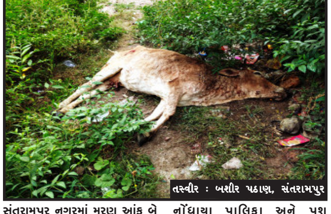
સંતરામપુર નગરમાં મરણ આંક બે નોંધાયા પાલિકા અને પશુ

સંતરામપુર, સંતરામપુર નગરમાં રખડતા પશુઓમાં લંપી વાચરસથી ગાયનું વધુ એક મોત સંતરામપુર નગરમાં ગ્રામ્ય વિસ્તારોમાં ફરીથી વધી રહેલો લંપી વાચરસ નો કેર હજુ પણ સંતરામપુર નગરના રખડતા પશુઓમાં અને ગ્રામ્ય વિસ્તારોમાં રોજિંદા સંખ્યાબંધ પશુઓમાં વાચરસ વધુ જોવા મળી રહેલો આવેલો છે આજ રોજ રખડતા પશુઓમાં અમરદીપ સોસાયટીમાં લંબી ગ્રસ્ટ થી વધુ એક ગાયનું મોત લીધેલું હતું