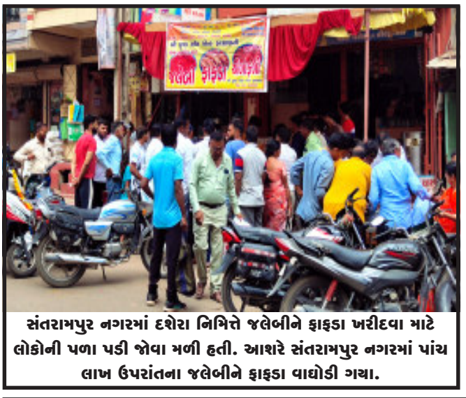
સંતરામપુર નગરમાં દશેરા નિમિત્તે જલેબીને ફાફડા ખરીદવા માટે લોકોની પળા પડી જોવા મળી હતી. આશરે સંતરામપુર નગરમાં પાંચ લાખ ઉપરાંતના જલેબીને ફાફડા વાણીકી ગયા.