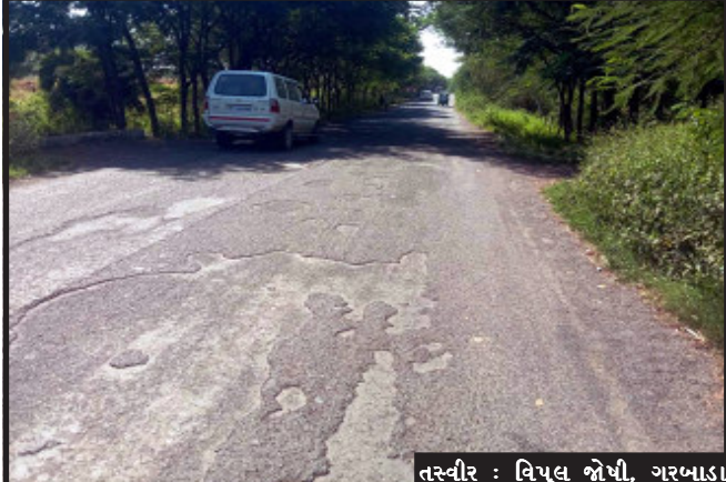
તસ્વીર : વિપુલ જોષી, ગરબાડા

ગરબાડા, તૂટેલા રસ્તાના કારણે તહેવારીયા દિવસોમાં નિર્દોષ લોકોએ મોતાનો જીવ ગુમાવવો પડે છે. ગરબાડા રિલાયન્સ પમ્પ થી પાંચવાડા સુધીનો ડામર રસ્તો હાલમાં એકદમ જર્જરિત બન્યો છે જેને કારણે આડાઓ પડી ગયા છે જેના કારણે બાઈક ચાલકો સહિત ફોરવીલર ના ચાલકો સ્ટેરીંગ પરનું કાબુ ગુમાવતા હોય છે તેમજ આટલા વિસ્તારમાં અકસ્માતોની ઘટના પણ અવારનવાર ઘણાવારે બનતી હોય છે પરિણામે તહેવારના દિવસોમાં નિર્દોષ લોકોએ મોતાનો જીવ ગુમાવવો પડી રહ્યો છે હાલમાં જ સાહસા ગામે અકસ્માતમાં મહિલાનું મોત નિબંધું હતું સ્થાનિક તંત્ર દ્વારા વહેલી તકે આ ડામર રસ્તાનું સમારકામ કરવામાં આવે તે અવશ્યક બાબત બની છે.