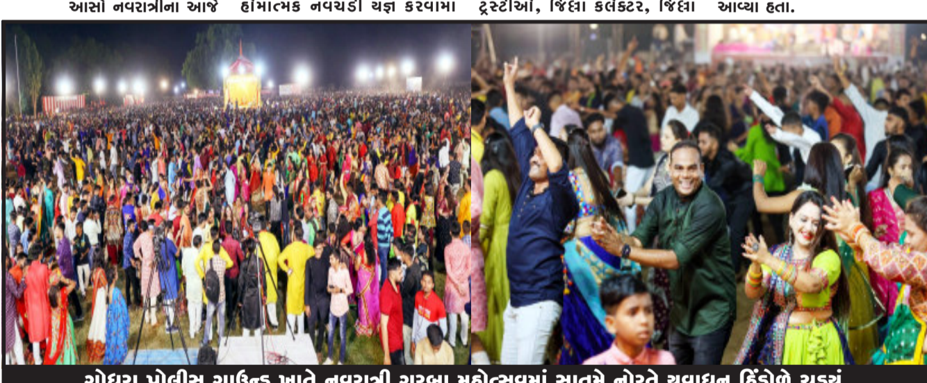
ગોધરા પોલીસ ગ્રાઉન્ડ ખાતે નવરાત્રી ગરબા મહોત્સવમાં સાતમે નોરતે સુવાદ્યન હિંદોળે ચડ્યું.

પોલીસ અધિકારી, હાલોલ પ્રાંત અધિકારી, હાલોલ ડીવાયઝેસપી, એસીએફ સહિત અનેક અધિકારીઓએ યજ્ઞ પૂજા કરી માતાજીની આરતીની પૂજાનો હિસ્સો બન્યા હતા અને શ્રી ઇશની આહુતિ આપી હતી. શાસ્ત્રોક્ત વિધિથી યોજવામાં આવેલા યજ્ઞ પૂજાની આહુતિ સાંજે ૪.૩૦ વાગ્યે પૂર્ણ થઈ હતી. માતાજીની આરતી ઉતારવામાં આવી હતી, પછી ઉપસ્થિત ઉચ્ચ અધિકારીઓ દ્વારા યજ્ઞ પૂજા કરી નવચંડીનું સમાપન કરવામાં આવ્યું હતું. અનેક ભકતો યજ્ઞની પૂજા માટે આવ્યા હતા.