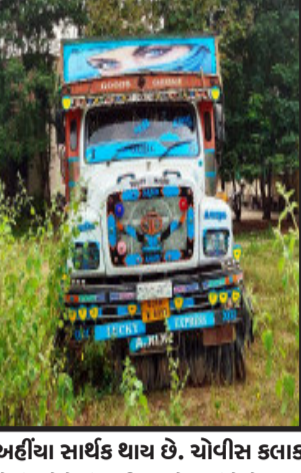
અહીયા સાર્થક ધાય છે. ચોપીસ કલાક મોટી ટ્રકો રેતી માફિયાઓ ભરીને તે પછા પાછી નિતરતી મામલતદાર ચોકિસ

સામે થી પસાર કરવામાં આવતી હોય છે. જે મેંક્રા ચોકડી થી બારીયા શહેર પસાર કરવાના રૂા.૫૦૦/- ચુકવવા હોય છે. આવી અનેક રેતી ભરીને પસાર કરાવવામાં પોલીસના મળતિયાઓ આમા કામે લાગેલા છે. નાના જે એક ફેરા મારી પોતાનું ગુજરાન ચલાવે છે. તેઓને પકડી પાડી પોતાના પાયલોટીંગ કરી ઓપર લોડીંગ રેતી ભરીને નિકળે છે. તે કોની રહેમનજરે થાય છે. તે યક્ષ પ્રશ્ન છે. આપણી ગુજરાતની સરકારમાં ખાણ અને ખનિજ વિભાગ અલગ થી કાર્યરત ક્યો છે. તે વિભાગ કેમ આંખ આડા કાન કરી રહ્યો છે. શું ? ખાણ અને ખનિજ વિભાગ રેતી માફિયાઓ સાથે સાંઘાંઘ થયેલી હોય તેવું દેખાઈ રહ્યું છે. રેતી માફિયાઓ પોતાના ગોરખ ઘંઘાઓ છુપાવવા ખાતર નાના વેપારીઓ જેઓ એક ફેરો માંડ કરતા હોય તેઓને બલીના બકરાં બનાવીને મોટા રેતી માફિયાઓ બચી જાય છે શું ? ખાણ અને ખનિજ વિભાગ જે રેતી માફિયાઓ સ્ટોક કરીને અને મોટા રેતીના કારખાના બમણી કમાણી કરતા વેપારીઓ ઉપર ક્યારે કાર્યવાહી કરવામાં આવશે કે નહિ તે મોટો સવાલ આમ જનતામાં ચર્ચાઈ રહ્યો છે. મોટ માચલીઓ બચી જાય છે.