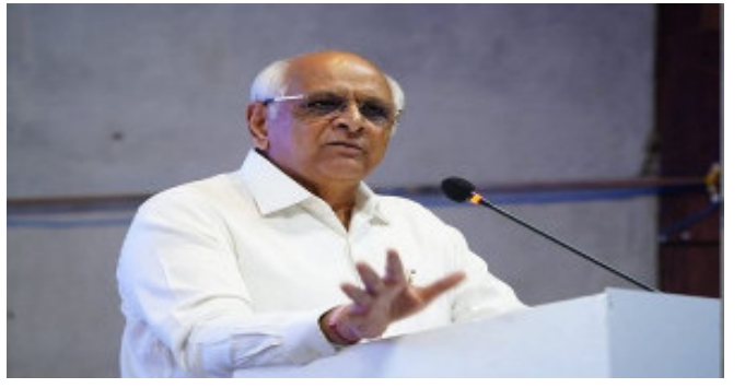
ઉકત કાયદાની જોગવાઈ અથવા તેના અંતર્ગત બનાવાયેલા નિયમો તથા તેની સૂચનાઓની જરૂરી પુર્તતા કે ભંગ બદલ, કોઈ પણ જાતના વાજબી કારણો વિના જોગવાઈઓનું પાલન કરવામાં નિષ્ફળ જતાં, જો દોષિત ઠરતા, ત્રણ માસ સુધીની જેલની સજા અથવા મહત્તમ રૂપિયા બે લાખ સુધી અથવા બંનેની સજાની જોગવાઈ કરવામાં આવેલ છે અને જો આવી જોગવાઈનો ભંગ થાય હોય તો, નિયમની અમલવારીના દોષિત થયાના હેલા દિવસથી રોજના રૂ. ૧૦,૦૦૦/- પહેલા કલમ-૫૪માં વીજ લાયસન્સ અને અન્ય વ્યક્તિ દ્વારા, જેલની સજા અથવા મહત્તમ રૂપિયા બે લાખ સુધી અથવા બંનેની સજાની જોગવાઈ કરવામાં આવેલ છે અને તેના હેઠળ ઘડાયેલ નિયમોનું પાલન સુનિશ્ચિત કરવા માટે કરવામાં

ક્રીમીન લાઈઝ કરી, માત્ર ઉચ્ચ શ્રેણીમાં વર્ગીકૃત કરાયેલા કૃત્યોના ઉલ્લંઘન માટે જ જેલની સજાની જોગવાઈ આપવી કરવા અંગેનો સુધારો કરવાનો નિર્ણય કરવામાં આવેલ છે. રાજ્ય સરકાર દ્વારા કાયદાના પાલનમાં સરળીકરણ કરવાના આશયથી તથા ગંભીર પ્રકારની જોગવાઈના ભંગ બદલ, જેલની સજાની જોગવાઈ આપવી કરવાનો નિર્ણય કરવામાં આવેલ છે અને તે અંતર્ગત ગુજરાત વિદ્યુત ઉદ્યોગ (પુનર્ગઠન અને નિયમન) સુધારા બિલ, ૨૦૨૨ ઘડવામાં આવી છે. સુચિત બિલની જોગવાઈઓ બંધારણના ૭૩મું શિલ્ડુબની યાદી નં. ૨ અને ૩માં આવે છે. બિલની જોગવાઈઓ કેન્દ્રીય કાયદાઓને સ્પર્શતી હોઈ, બંધારણની કલમ ૨૫૪-(૨) હેઠળ સદર સુધારા બિલ વિધાનસભામાં પસાર થયા બાદ માનનીય રાષ્ટ્રપતિ મહોદયની મંજૂરી માટે મોકલવામાં આવશે. આ ગુજરાત વિદ્યુત ઉદ્યોગ (પુનર્ગઠન અને નિયમન) (સુધારા) વિધેયક-૨૦૨૨ વિધાનસભા ખાતે સર્વાનુમતે પસાર કરાયું હતું.