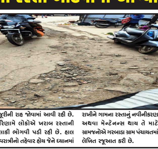
મંજૂરીની રાહ જોવામાં આવી રહી છે. પરિણામે લોકોએ ખરાબ રસ્તાની હલાકી ભોગવી પડી રહી છે. હાલ નવરાત્રીનો તહેવાર હોય જેને ધ્યાનમાં રાખીને ગામના રસ્તાનું નવીનીકરણ અથવા મેન્ટેનન્સ થાય તે માટે ગ્રામજનોએ ગરબાડા ગ્રામ પંચાયતમાં લેખિત રજૂઆત કરી છે.

ગરબાડા, નગરમાં અંદાજિત દોઢ બે માસ પહેલા નલ સે જલ યોજનાની પાઈપ લાઈન નાખવા માટે ગામના રસ્તા ખોદી નાખવામાં આવ્યા હતા. રસ્તાનું ખોદકામ કર્યા બાદ ગ્રામ પંચાયત દ્વારા નવીન પાઈપલાઈન માટે જિલ્લામાં આ બાબતની રજૂઆત કરવામાં આવી હતી. ખરેખર જો ગ્રામ પંચાયત નવીન પાઈપ લાઈન નાખવી જ હતી, તો ગામના રસ્તા એક- દોઢ માસ પહેલા ખોદવાની જરૂર ન હતી. હાલમાં નલ સે જલ યોજનાની કામગીરી પડા બાકી છે અને હાલ નવી નળ લાઈનની