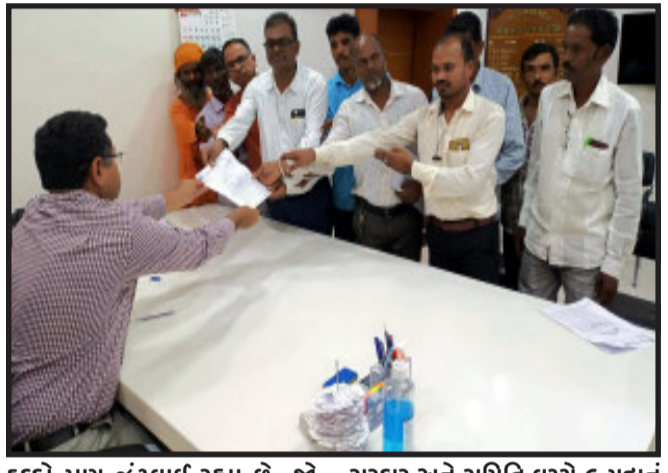
હક્કો પણ ઝૂંટવાઈ રહ્યા છે. જો જણાવ્યા અનુસાર ગુજરાત રાજ્યમાં આદિવાસીઓના ખોટા જાતિ પ્રમાણપત્રોના લીધે સાચા આદિવાસી વિદ્યાર્થીઓને અને અભ્યાસ કરવામાં આવતા હકોનો નુકશાન બે લાખ જેટલા આદિવાસીઓના ખોટા પ્રમાણપત્રો થકી મોટા પાયે ગેરબંધારણીય રીતે હનન થઈ રહ્યું છે. હજુ લાખોની સંખ્યામાં વધુ ખોટા પ્રમાણપત્ર આપવાની તૈયારી પ્રસાશન કરી રહ્યું છે. અમારું ભવિષ્ય જેના પર નિર્ભર છે. તે જળ, જંગલ, જમીન, ખાણ-ખનીજનાં હક્કો ઉપરાંત નોકરીના

ગોધરા, આદિવાસી વિકાસ ફાઉન્ડેશન, ગોધરા દ્વારા રાજ્યના મુખ્યમંત્રીને ઉદ્દેશીને પંચમહાલ જિલ્લા નિવાસી અધિક કલેક્ટરને આવેદનપત્ર આપવામાં આવ્યું. જેમાં અનુસૂચિત જન જાતિના ખોટા પ્રમાણપત્રની ગંભીર સમસ્યા, ગુજરાત સરકાર અને સાચા આદિવાસી અધિકાર સમિતિ વચ્ચે થયેલા સમાધાન બાબતે પ્રસાશન દ્વારા થયેલા ઉદ્દેશન મામલે ધ્યાન દોરવામાં આવ્યું હતું.