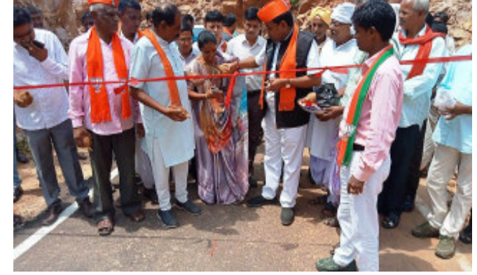
આપેલ વિસ્તારક, પ્રવાસીઓ, પ્રભારી, નવસારીના યુવા મિત્ર