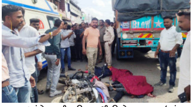
બાબા આંબેડકરની પ્રતિમા પાસેથી શનિવાર ઢળતી સાંજે એક ટ્રક પસાર થઈ રહી હતી. તે સમયે ઝાલોદ તાલુકાના થેરકા

બાલાસિનોર, બાલાસિનોર બસ સ્ટેશન નજીક શનિવારે ઢળતી બપોરે ગમપવાર અકસ્માત સર્જાયો હતો. ઝાલોદના થેરકાથી અમદાવાદ જવા નીકળેલી પરિવાર આગળ જતી ટ્રકને ઓવરટેક કરવા જતા ટ્રકના પેડા નીચે આખો પરિવાર આવી જતા કમકમાટી ભર્યા મોત નીપજ્યું હતું. પોલીસે કાર્યવાહી હાથ ધરી છે. પ્રાસ વિગતો અનુસાર બાલાસિનોર બસ સ્ટેશન પાસેના