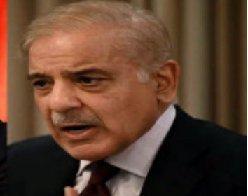
ભારતની હાજરી અત્યંત મહત્વપૂર્ણ છે. આ એટલા માટે છે કારણ કે સમરકંદમાં આ સમિટના અંતે ભારત એસસીઓનું

રોટેશનલ પ્રેસિડન્સી સંભાળશે. દિલ્હી સપ્ટેમ્બર ૨૦૨૩ સુધી આખા વર્ષ માટે આ જૂથની અધ્યક્ષતા કરશે. આ જ કારણ છે કે ભારત આવતા વર્ષે એસસીઓ સમિટનું આયોજન કરશે, જેમાં રશિયા, ચીન અને પાકિસ્તાનના નેતાઓ સામેલ થશે. એસસીઓ સમિટની બાજુમાં, ભારત કોઈપણ અન્ય સભ્ય દેશ સાથે દ્વિપક્ષીય બેઠક કરે તેવી પણ શક્યતા છે.