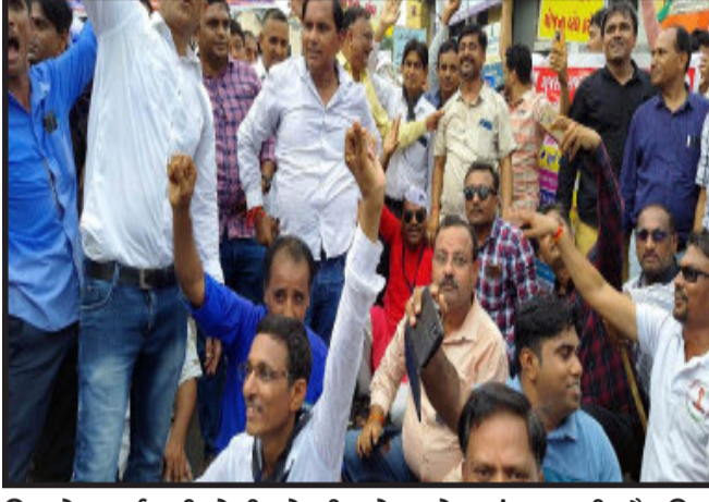
નિમાચેલ કર્મચારીઓની નોકરી હેતુ માટે સળંગ ગણાવી, શૈક્ષણિક મુળ નિમણૂક તારીખ થી તમામ કર્મચારી સિવાયના કર્મચારીઓને

ગોધરા, પંચમહાલ જીલ્લા સંયુક્ત કર્મચારી મોરચાના નેજા હેઠળ આજરોજ જીલ્લા કર્મચારીઓ ગોધરા ન્યુઈરા હાઈસ્કૂલ ખાતે એકઠા થયા હતા અને ૩ થી ૪ હજાર શિક્ષકો સહિતના કર્મચારીઓ પેન્શન યોજના પુનઃશરૂ કરવા તથા અન્ય પડતર પ્રશ્નો અંગે રેલી યોજી કલેક્ટર કચેરી પહોંચી કલેક્ટરને આવેદનપત્ર આપવામાં આવ્યું. પંચમહાલ જીલ્લા સંયુક્ત કર્મચારી મોરચા દ્વારા