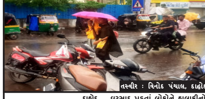
દાહોદ, જિલ્લામાં છેલ્લા બે-ત્રણ દિવસથી મેઘરાજ મહેરબાન રહેતાં વિજળીના કડાકા અને ઘડાકા સાથે વરસાદ વરસી રહ્યો છે. ત્યારે બીજી તરફ હવામાન વિભાગ દ્વારા દાહોદ જિલ્લામાં ૦૫ દિવસ સુધી ભારે વરસાદની આગાહી વ્યક્ત કરી રહી છે. હવામાન વિભાગ દ્વારા ભારે વરસાદની આગાહીને પગલે તંત્ર દ્વારા વરસાદની આગાહીને પગલે તંત્ર દ્વારા સાવચેતીના ભાગરૂપે તૈયારીઓ પણ કરી હોવાનું જાણવા મળી રહ્યું છે. દાહોદ શહેર સહિત જિલ્લામાં તમામ તાલુકાઓમાં વીજળીના કડાકા અને ઘડાકા સાથે વરસાદ વરસી રહ્યો છે. નીચાળવાળા વિસ્તારોમાં

વરસાદ પડતાં લોકોને હાલાકીનો સામનો પણ કરવો પડી રહ્યો છે. ત્યારે છેલ્લા બે દિવસમાં દાહોદ જિલ્લામાં આકાશી વિજળી પડતાં જ વ્યક્તિઓના મોત નીપજ્યાં છે. જ્યારે બે મુંગા પશુઓના પણ મોત નીપજ્યાં છે. આવા સમયે હવામાન વિભાગ દ્વારા દાહોદ જિલ્લામાં ૦૫ દિવસ ભારે વરસાદની આગાહી કરવામાં આવી છે. છેલ્લા બે-ત્રણ દિવસથી દાહોદ જિલ્લામાં વીજળીના કડાકા અને ઘડાકા સાથે મુશળધાર વરસાદ વરસી રહ્યો છે. હવામાન વિભાગની આગાહીને પગલે દાહોદ જિલ્લા વહીવટી તંત્રએ પણ સાવચેતીના પગલા લેવાની તૈયારીઓ કરી દીધી છે.