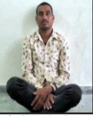
દાહોદ, જિલ્લાના દે.બારીયામાં ચાર દિવસ અગાઉ યુવાન પ્રેમિકાનું અન્ય સાથે આડા સંબંધની શંકાએ કાસળ કાઢી નાખનાર માસાએ પણ પોલીસ કસ્ટડીમાં પોતાની જીવન લીલા સંકેલી લેતા ચકચાર મચી જવા પામી છે.

દાહોદ, જિલ્લાના દે.બારીયામાં ચાર દિવસ અગાઉ યુવાન પ્રેમિકાનું અન્ય સાથે આડા સંબંધની શંકાએ કાસળ કાઢી નાખનાર માસાએ પણ પોલીસ કસ્ટડીમાં પોતાની જીવન લીલા સંકેલી લેતા ચકચાર મચી જવા પામી છે. પોતાના ચાર સંતાનો અને પત્નીને પણ વિલય કરતા મૂકી જીવન ટુંકાવી નાખનાર માસાની આત્મહત્યા સમગ્ર પંથકમાં ચર્ચાનો વિષય બની છે. તાજેતરમાં બામરોલી ગામના જંગલ વિસ્તારમાંથી યુવતીની લાશ મળી આવી હતી. જેમાં પોલીસે ગણતરીના કલાકોમાં સમગ્ર હત્યાકાંડનો ભેદ ઉકેલી દીધો હતો. જેમાં ચાર સંતાનોના પિતા તેમજ યુવતીના કુટુંબી માસા એ જ અન્ય યુવક જોડે