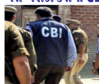
નવીદિલ્હી, દિલ્હીના લેફ્ટનન્ટ ગવર્નર વિનય કુમાર સક્સેનાએ દિલ્હી ટ્રાન્સપોર્ટ કોર્પોરેશન દ્વારા ૧,૦૦૦ લો-ફ્લોર બસોની ખરીદીમાં કથિત ભ્રષ્ટાચાર સંબંધિત ફરિયાદ CBIને મોકલવા માટે મુખ્ય સચિવ નરેશ કુમારના પ્રસ્તાવને મંજૂરી આપી દીધી છે. સત્તાવાર નિવેદન અનુસાર, એલજીએલોફ્લોર વાહનોના અમલદારોને આ મામલે ફરિયાદ મળી હતી. હાલમાં જ સીબીઆઈએ દિલ્હીના નાયબ મુખ્યમંત્રી મનીષ સિસોદિયાના ઘર અને તેમના અન્ય સ્થળો પર સર્ચ કર્યું હતું. જે બાદ બંને પક્ષો એકબીજા પર

ભ્રષ્ટાચારના આરોપો લગાવી રહ્યા છે. ભાજપ દિલ્હી સરકાર પર માત્ર દારૂની નીતિમાં જ નહીં પરંતુ શિક્ષણના ક્ષેત્રમાં પણ ભ્રષ્ટાચારનો આરોપ લગાવી રહી છે. ગયા મહિને મુખ્યમંત્રી અરવિંદ કેજરીવાલે આરોપ લગાવ્યો હતો કે ભાજપ દિલ્હીમાં ચૂંટાયેલી સરકારને તોડી પાડવાનો પ્રયાસ કરી રહી છે. કેજરીવાલે એવો પણ દાવો કર્યો હતો કે ભાજપે તેમના ધારાસભ્યોને ખરીદવા માટે ૮૦૦ કરોડ રૂપિયા ફાળવ્યા છે. કેજરીવાલે વિધાનસભામાં ફ્લોર ટેસ્ટ કરાવ્યો હોવા છતાં, કેજરીવાલે કહ્યું કે તે એક સંદેશ છે કે સરકારને તોડી પાડવાનો પ્રયાસ નિષ્ફળ ગયો છે.