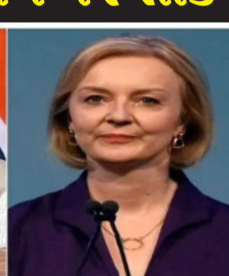
અવસાન થયું નોંધપાત્ર રીતે, બ્રિટનની રાષ્ટ્રી એલિઝાબેથ-૨ નું ગુરુવારે સ્કોટલેન્ડના બાલમોરલ કેસલમાં નિધન થયું હતું. રાષ્ટ્રી એલિઝાબેથ-૨ એ ૯૬ વર્ષની વયે અંતિમ શ્વાસ લીધા. તેમના અંતિમ સંસ્કાર ૧૯ સપ્ટેમ્બરે કરવામાં આવશે. આ દરમિયાન બ્રિટનમાં રાષ્ટ્રીય શોક યાત્રા રહેશે. રાષ્ટ્રી એલિઝાબેથના અવસાન બાદ તેમના

મોટા પુત્ર ચાર્લ્સ ત્રીજાને આજે બ્રિટનના નવા રાજા જાહેર કરવામાં આવ્યા છે. પીએમ મોદીએ શોક વ્યક્ત કર્યો ગુરુવારે પણ પીએમ મોદીએ ટ્વિટ કરીને રાષ્ટ્રીના નિધન પર શોક વ્યક્ત કર્યો હતો અને તેમના પ્રેરણાદાયી નેતૃત્વની પ્રશંસા કરી હતી. વડા પ્રધાને ૨૦૧૫ અને ૨૦૧૮ માં બ્રિટનની તેમની મુલાકાતો દરમિયાન રાષ્ટ્રી એલિઝાબેથ-II સાથેની તેમની મુલાકાતોને યાદ કરવા માટે ટ્વિટર પર લીધો હતો. પીએમ મોદીએ ટ્વિટ કર્યું હતું કે, “હું તેમની હુંફ અને દયાને ક્યારેય ભૂલીશ નહીં. એક મીટિંગ દરમિયાન, તેમણે મને તે રૂમાલ બતાવ્યો જે મહાત્મા ગાંધીએ તેમના લગ્નમાં તેમને બેઠકમાં આપ્યો હતો. હું તે યાદોને હંમેશા યાદ રાખીશ.