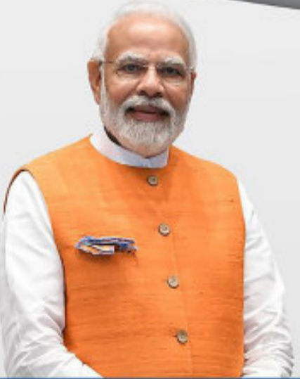
શ્રી નરેન્દ્રભાઈ મોદી માનનીય વડાપ્રધાન

12 TH SEPTEMBER 2022 MAHATMA MANDIR, GANDHINAGAR