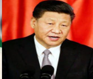
પહોંચે, અને ૧૬ સપ્ટેમ્બરે ભારત પરત કરે તેવી શક્યતા છે. અહેવાલ મુજબ સમિટમાં