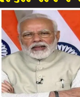
બંને નેતાઓએ ભારત અને યુકે વચ્ચે વ્યાપક વ્યૂહાત્મક ભાગીદારીને વધુ મજબૂત કરવા અંગે વાત કરી હતી. બંને નેતાઓએ રોડમેપ ૨૦૩૦ના અમલીકરણમાં પ્રગતિ, FTA વાટાઘાટો, સંરક્ષણ અને સુરક્ષા સહયોગ અને બંને દેશો વચ્ચે દ્વિપક્ષીય હિતના વિવિધ મુદ્દાઓ પર ચર્ચા કરી હતી. બાલમોરલ કેસલમાં રાષ્ટ્રીનું

નવીદિલ્હી, વડાપ્રધાન નરેન્દ્ર મોદીએ બ્રિટનના નવનિયુક્ત વડા પ્રધાન લિઝ ટ્રસ સાથે ફોન પર વાત કરી હતી અને રાષ્ટ્રી એલિઝાબેથ દ્વિતીયના નિધન પર શોક વ્યક્ત કર્યો હતો. એક સરકારી અખબારી યાદીમાં જણાવવામાં આવ્યું છે કે, ભારતના લોકો વતી વડાપ્રધાન મોદીએ રાષ્ટ્રી એલિઝાબેથ દ્વિતીયના દુઃખદ અવસાન પર શાહી પરિવાર અને બ્રિટનના લોકો પ્રત્યે ઊંડી સંવેદના વ્યક્ત કરી છે. પીએમ મોદીએ પણ લિઝ ટ્રસને યુકેના વડાપ્રધાન તરીકેનો કાર્યભાર સંભાળવા બદલ અભિનંદન પાઠવ્યા હતા. તેમણે વેપાર સચિવ અને વિદેશ સચિવ તરીકેની તેમની અગાઉની ભૂમિકાઓમાં ભારત-યુકે દ્વિપક્ષીય સંબંધોમાં લિઝ ટ્રસના યોગદાનની પણ પ્રશંસા કરી હતી.