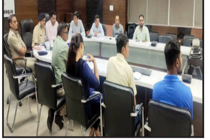
વાગ્ચે શેઠ પી ટી આર્ટસ એન્ડ સાયન્સ કોલેજ ખાતે જિલ્લા કક્ષાનો કોલેજ/યુનિવર્સિટી ગેમ્સ, ૧૩ સપ્ટેમ્બરના રોજ સવારે ૯.૩૦

ગોધરા, ૩૬મી નેશનલ ગેમ્સના કરાચેલા આયોજનના ભાગરૂપે જિલ્લા કક્ષાએ નેશનલ ગેમ્સ અંગે હાથ ધરાયેલા જાગૃતિ અભિયાનના ભાગરૂપે પંચમહાલ જિલ્લામાં ૧૨મી સપ્ટેમ્બરથી ૧૬ મી સપ્ટેમ્બર, ૨૦૨૨ સુધી પંચમહાલ જિલ્લાની કુલ ૧૮૪૩ શાળાઓ જેમાં ૧૫૨૫ પ્રાથમિક શાળાઓ અને ૩૧૮ માધ્યમિક અને ઉચ્ચતર માધ્યમિક શાળાઓ તથા ૩૪ કોલેજોમાં વિવિધ રમતોના આયોજન અને જાગૃતિ અભિયાન અંતર્ગત કેમ્પેઈન ચોજાશે.