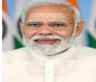
૧૪ જૂનના રોજ કિર્ગિસ્તાનના બિશ્કેકમાં યોજાઈ હતી. સૂત્રોના જણાવ્યા અનુસાર વડાપ્રધાન ૧૪ સપ્ટેમ્બરે સમરકંદ

નવીદિલ્હી, વડાપ્રધાન નરેન્દ્ર મોદીએ શાંઘાઈ કોઓપરેશન ઓર્ગેનાઈઝેશન (એસસીઓ) સમિટની તૈયારીઓ પૂર્ણ કરી લીધી છે. ઉઝબેકિસ્તાનના સમરકંદમાં યોજાનારી આ બે દિવસીય સમિટમાં તમામ સભ્ય દેશોના રાષ્ટ્રપતિઓ હાજરી આપશે. વર્ષ ૨૦૧૮ (જૂન) પછી આ પ્રથમ સામ-સામે ઉપસ્થિત રહેવા સાથેની કોન્ફરન્સ હશે. ૨૦૧૯ માં, એસસીઓ સમિટ ૧૩ અને