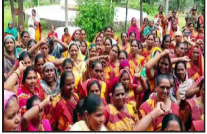
દાહોદ, છાપરીમાં જિલ્લા કલેક્ટર કચેરી બહાર આંગણવાડીની બહેનોએ પડતર માંગણીઓને લઈને વિરોધ દર્શાવ્યો હતો જેમાં સરકારનું સંજ્ઞાની દૂધ યોજના બંધ કરવા માટે પહોંચી રહ્યા હતાં. તેવું તેમણે જણાવ્યું હતું તેમજ વિવિધ પડતર માંગણીઓને લઈને દાહોદ જિલ્લાની આંગણવાડી બહેનોએ જિલ્લા કલેક્ટરને આવેદનપત્ર આપી આંગણવાડી બહેનોની પડતર માંગણીઓને પૂર્ણ કરવા માટે જણાવ્યું હતું.

સરકારની સંજ્ઞાની દૂધ યોજના બંધ કરવા માટે પહોંચી આંગણવાડી બહેનોએ રજૂઆત કરી હતી જેમાં આંગણવાડીની બહેનોએ જણાવ્યું હતું કે, દાહોદ જિલ્લામાંથી અનેકોપાર સરકારની સંજ્ઞાની દૂધની શેલીઓ રૂઝતી મળતી હોય છે અને આ શાળામાંથી ફૂડી દેવામાં આવે છે અને આંગણવાડી બહેનો ઉપર આક્રોષ થતા હોય જેથી સરકાર પાસે માંગ કરવામાં આવી હતી. જેમાં આંગણવાડીની બહેનોએ માગ કરી હતી કે સરકાર દ્વારા સંજ્ઞાની દૂધ યોજના બંધ કરવામાં આવે જેથી આંગણવાડી સંજ્ઞાની દૂધ આપવું હોય છે તેથી બાળકો તે દૂધ પીતા નથી અને તે દૂધ રસ્તામાં જતા તે લોકો નાખી દેતા હોય છે. જેથી શાળાના બાળકો નાખી દેતા હોય અને આંગણવાડી બહેનો ઉપર આક્રોષ થતા હોય જેથી સરકાર પાસે માંગ કરવામાં આવી હતી.