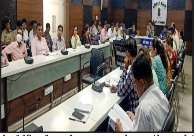
પોતાની લેખિત ફરીયાદ રાષ્ટ્રીય બાળ અધિકાર સંરક્ષણ આયોગ સમક્ષ મુકી શકે છે.

તાલુકા વિકાસ અધિકારીની કચેરી, શિક્ષણ સંબંધિત જિલ્લા શિક્ષણાધિકારી અને જિલ્લા પ્રાથમિક શિક્ષણાધિકારી કચેરી આરોગ્ય સંબંધિત મુખ્ય જિલ્લા આરોગ્ય અધિકારી તેમજ ઉકત બાબતોના બાળકો પ્રશ્નોના જુ આત જિલ્લા કક્ષાએ લેખિત સ્વરૂપમાં રૂબરૂ, ટપાલ અથવા ઈ-મેઈલના માધ્યમથી જિલ્લા સમાજ સુરક્ષા અધિકારીની કચેરી અને જિલ્લા બાળ સુરક્ષા એકમ, રૂમ નં. ૫૯ અને ૬૦, પ્રથમ માળ, જીલા સેવા સદન ૨, કલેક્ટર કચેરી કંપાઉન્ડ, ગોધરા જી.પંચમહાલ, ફોન નં. ૦૨૬૭૨-૨૪૩૪૮૦ ઈ-મેલ: dcpu-gsepsspangujaraLgov.in