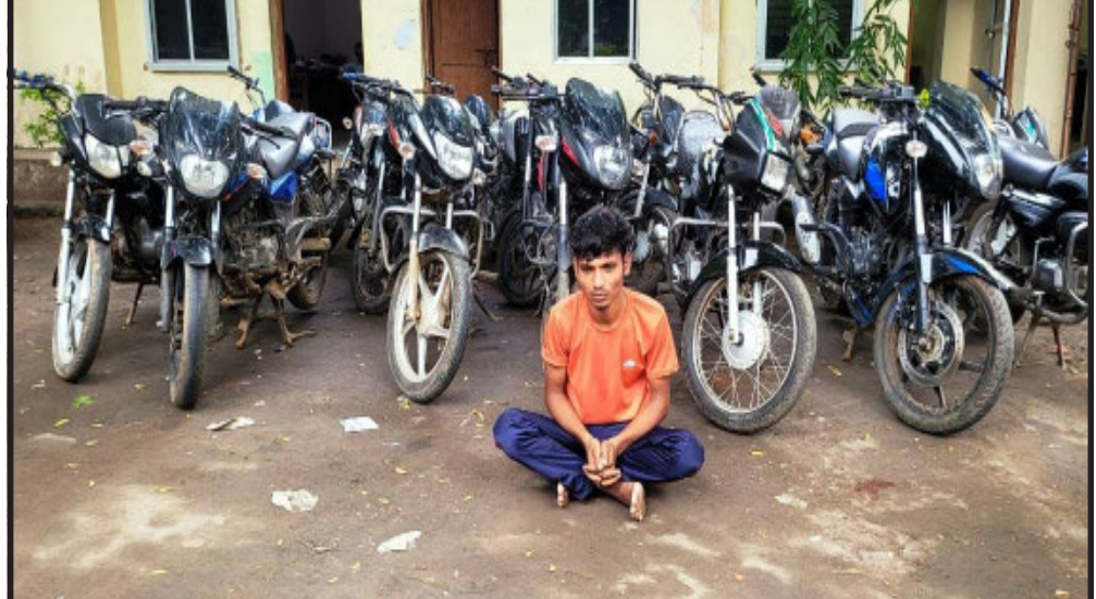
ચોરીના બાઈકો રીકવર કરવામાં આવી. પ્રાપ્ત વિગતો મુજબ ગોધરા એલ.સી.બી.પોલીસ પરવડી ચોકડી પાસે વાહન ચેકીંગમાં હતા. દરમિયાન નંબર વગરની બાઈક લઈ પસાર થતાં ઈસમને રોકીને બાઈકના કાગળો માંગતા પુરાવા રજૂ કર્યા ન હતા. પોલીસે શંકાના આધારે પોકેટકોપ તથા ઈ-ગુજકોપમાં સર્ચ કરી તપાસ કરતાં બાઈક ચોરીની ફરિયાદ દાખાવાય નોંધાઈ હતી. પોલીસે પકડાયેલ ઈસમની પુછપરછ કરતાં તેના ત્રણ સાગરીતો એ તેના ઘરે મુકી રાખેલ ૧૯

- ચોરીની ૨૦ બાઈકો રીકવર કરી. - એક ઈસમને ઝડપ્યો.