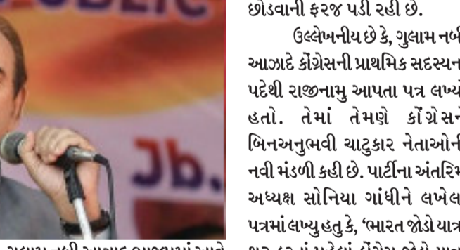
સિનિયર નેતા હતા પરંતુ દુઃખની વાત એ છે કે અત્યારે અમે મોંઘવારી, બેરોજગારી અને ધુવીકરણ સામે લડાઈ લડી રહ્યા છીએ અને ૭ સપ્ટેમ્બરે ભારત જોડો યાત્રા શરૂ થવાની છે. પરંતુ ગુલાબ નબી આઝાદે તેવા સમયે રાજીનામું આપીને કોંગ્રેસનો સાથ અને લડાઈ છોડવાનો નિર્ણય કર્યો છે.

નવીદિલ્હી, કોંગ્રેસમાં એકપછી એક રાજીનામાની લાઈનો લાગી છે ત્યારે આજે કોંગ્રેસના સિનિયર નેતા ગુલાબ નબી આઝાદે પણ છોડી નાંખ્યો છે. તેઓ છેલ્લા ઘણા સમયથી પાર્ટીથી નારાજ હતા. વરિષ્ઠ નેતા ગુલાબ નબી આઝાદના રાજીનામા બાદ કોંગ્રેસ પાર્ટીની પ્રતિક્રિયા સામે આવી છે. કોંગ્રેસ નેતા જયરામ રમેશે મીડિયાને સંબોધતા કહ્યું કે આ સમયે ગુલાબ નબીનું રાજીનામું દુર્ભાગ્યપૂર્ણ છે. તેમનું રાજીનામું અમારા માટે દુઃખની વાત છે. ગરીબોનો અવાજ ઉઠાવવાનો સમય હતો પરંતુ તેમણે રાજીનામું આપી દીધું. કોંગ્રેસ આ સમયે સરકાર સામે જોરશોરથી ઝુંબેશ ચલાવી રહી છે, પાર્ટીના નેતા જયરામ રમેશે કહ્યું હતું કે, ભારત જોડો યાત્રા ૭ સપ્ટેમ્બરે શરૂ થવાની હતી. ૩૨ પ્રેસ કોન્ફરન્સ શિફ્ટ્સ હતા. આ સૌથી દુઃખદ ઘટના છે કે આ સમયે અમારે આ પત્ર વાંચવો પડ્યો છે.