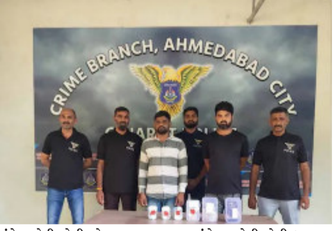
બંને પાસેથી પોલીસને ૧૯.૮૦૦ ગ્રામ મેફેટ્રોન ડ્રગ્સનો જથ્થો મળી આવ્યો છે.