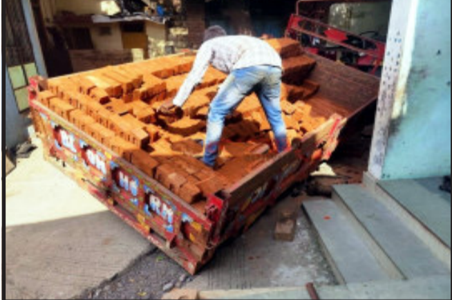
હાલોલ, હાલોલ નગર પાલિકા વિસ્તારમાં મુખ્ય માર્ગ ઉપર વિસ્તારમાં મુખ્ય માર્ગ ઉપર ભુર્ગભ ગટર લાઈનની કામગીરી માટે ખોદી પુરણ નહિ કરવામાં આવતાં વાહન ચાલકો પરેશાન થઈ રહ્યા છે. લીમડી ફળીયામાં ઈંટો ભરેલ ટ્રેક્ટર ફસાયું.