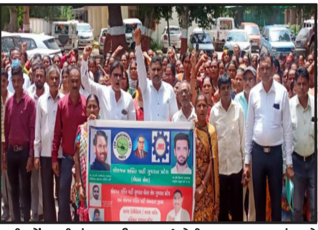
જતી મોંઘવારીમાં ઘર પરિવાર ચલાવવું મુશ્કેલ બન્યું છે. આશા વર્કર બહેનોને માનદ વેતન ૨,૦૦૦/- રૂપિયા અને

ગોધરા, પંચમહાલ જિલ્લાના આરોગ્ય વિભાગમાં ફરજ બજાવતી ફેસીલિટર અને આશા વર્કર બહેનોના પડતર પ્રશ્નોનો નિકાલ બાબતે જિલ્લા લોક જનશક્તિ પાર્ટી દ્વારા વડાપ્રધાનને ઉદ્દેશી આવેદનપત્ર જિલ્લા કલેક્ટરને આપવામાં આવ્યું. ગુજરાત રાજ્યના તમામ જિલ્લાઓમાં ૧૧ માસના કરાર થી ૧૦ આશા વર્કર દીઠ- ૧ ફેસીલિટરની નિમણૂક કરવામાં આવી છે. તેઓને ખાતાકીય ટ્રેનિંગ આપવામાં આવેલ છે અને તમામ ૧૨ પાસ થી ગ્રેજ્યુએટ તેમજ તેનાથી વધારે ડીગ્રી ધરાવે છે. આશા ફેસીલિટર અને આશા વર્કરો આરોગ્યલક્ષી તમામ કામગીરી સંભાળે છે. તેમજ વધારાની જેમ કે, પોલીયો, સ્વરછ ભારત, કોવિડ-૧૯ની કામગીરીમાં જોડાયેલ છે. ફેસીલિટરને ૨૦ દિવસના ૬,૦૦૦/- રૂપિયા ચુકવવામાં આવે છે અને ૨૦૧૮માં ૨,૦૦૦/- રૂપિયા વધારો કરીને ૮,૦૦૦/- રૂપિયા વેતનનો વધારો કરવામાં આવેલ છે. તેના હુકમમાં સુધારો કરવામાં આવ્યો નથી. વધતી