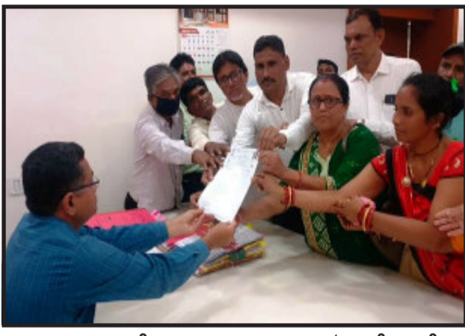
આ પ્રથા ૨૬ કરી ગુજરાત સરકાર નાણાં વિભાગ હાલ મળતા માનદ વેતનને ૨૬ કરી ૨૬ દિવસની નોકરી ગણીને ૧૪,૮૦૦/- રૂપિયા ફીક્સ પગાર તેમજ જાહેર રજાનો લાભ, બોનસ, પી.એફ., પેન્શનના લાભો સાથે કાયમી કરવામાં

ગણવાના હુકમ કરે તેવી માંગ કરી છે. સરકાર મહિલાઓને રોજગારી આપવાના બહાને અન્યાય કરવામાં આવે છે. ત્યારે સરકાર દ્વારા વિચાર વિમ્શ કરી આશા ફેસીલિટર અને આશા વર્કર બહેનોને ન્યાય મળે તેવી કાર્યવાહી કરી આશા વર્કર અને આશા ફેસીલિટરની માંગણી કરવામાં આવી છે. જેમાં ૧૧ માસના કરાર પાંચ વર્ષ પૂર્ણ થતાં કર્મચારીને કાયમી કરવામાં આવે તેવી જોગવાઈ છે પરંતુ ૧૫ વર્ષ માનદ વેતન થી કામ કરતા હોવા છતાં કાયમી કરવામાં આવ્યા નથી. આશા ફેસીલિટરની ખાલી પડેલ જગ્યાએ સીનીયોરીટીના ધોરણે પ્રમોશન આપવામાં અને સમાવેશ કરવામાં આવે, નવી ભરતી કરવામાં આવે, આશા વર્કર અને આશા ફેસીલિટર વર્ગ-૪, પગાર સ્તરીપ, આઈકાર્ડ અને વિમા સુરક્ષા, મોંઘવારી ભથ્થાનો લાભ આપવામાં આવે તેવી માંગ સાથે પંચમહાલ જિલ્લા લોકજન શક્તિ પાર્ટી દ્વારા વડાપ્રધાન, મુખ્યમંત્રી, જિલ્લા આરોગ્ય અધિકારીને લેખિત આવેદન આપવામાં આવ્યું.