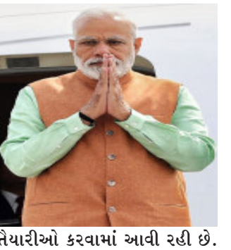
તૈયારીઓ કરવામાં આવી રહી છે.

અમદાવાદ, ગુજરાત વિધાનસભા ચૂંટણી આ વર્ષના અંત સુધીમાં યોજાવાની છે. ત્યારે આ પહેલા ગુજરાતના મતદારોને રીઝવવા દરેક પક્ષ અત્યારથી જ પ્રયાસો કરી રહ્યા છે. કેન્દ્રીય નેતાઓ પણ વારંવાર ગુજરાતના પ્રવાસે આવી રહ્યા છે. વડાપ્રધાન નરેન્દ્ર મોદી પણ વારંવાર ગુજરાતના પ્રવાસે આવી રહ્યા છે.