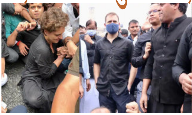
સહિત અનેક કોંગ્રેસ સાંસદોની અટકાયત કરી. કોંગ્રેસ ઓફિસથી માર્ચ કાઢી રહેલા પ્રિયંકા ગાંધીની પણ અટકાયત કરવામાં આવી છે. સંસદ ભવનથી પાર્ટી સંસદોની માર્ચ શરૂ થતા

નવીદિલ્હી, મોંઘવારી વિરુદ્ધ આજે દેશભરમાં કોંગ્રેસે વિરોધ પ્રદર્શન કર્યા હતાં. વિરોધ પ્રદર્શન દરમિયાન દિલ્હી પોલીસે કોંગ્રેસના નેતા રાહુલ ગાંધી, પ્રિયંકા ગાંધીની અટકાયત કરી આ ઉપરાંત કોંગ્રેસના અનેક સાંસદો વિજય ચોક પર ધરણા ધરીને બેઠા હતાં ત્યારે પોલીસે તેમની પણ અટકાયત કરી હતી રાહુલ ગાંધી કોંગ્રેસ સાંસદો સાથે સંસદ ભવનથી રાષ્ટ્રપતિ ભવન સુધી માર્ચ કાઢી રહ્યા હતા. પરંતુ પોલીસે તેમને વિજય ચોક ઉપર જ રોકી દીધા અને રાહુલ ગાંધી, પ્રિયંકા ગાંધી સહિત અનેક કોંગ્રેસના નેતાઓની અટકાયત કરી છે. રાહુલ