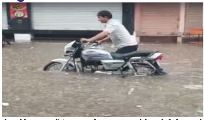
રોડ વગેરે મુખ્ય માર્ગો ઉપર વરસાદી પાણી ભરાઈ જતાં વાહનચાલકોને ભારે હાલાકીનો સામનો કરવો પડ્યો હતો, અનેક જગ્યાએ ગોઠણસમા પાણી ભરાયાં હતાં. રસ્તા પર વરસાદી પાણીને કારણે અનેક વાહનચાલકોનાં વાહનો પણ બંધ થઈ ગયાં હતાં, જેથી

સુરેન્દ્રનગર, જિલ્લાના ધ્રાંગધ્રામાં આજે વહેલી સવારથી જ કડાકાભડાકા સાથે મુશળધાર વરસાદ વરસ્યો હતો, જેથી શહેરની મુખ્ય બજારોમાં વરસાદી પાણી ભરાયાં હતાં. ધ્રાંગધ્રામાં મુખ્ય બજારો જાણે સ્વિમિંગ પૂલ બની ગયા હોય એવાં દેશ્યો જોવા મળ્યાં હતાં. ધ્રાંગધ્રા શહેરમાં ઠેર ઠેર વરસાદી પાણી ભરાવાથી વેપારીવર્ગ અને શહેરીજનોને ભારે હાલાકીનો સામનો કરવાની નોબત આવી હતી.