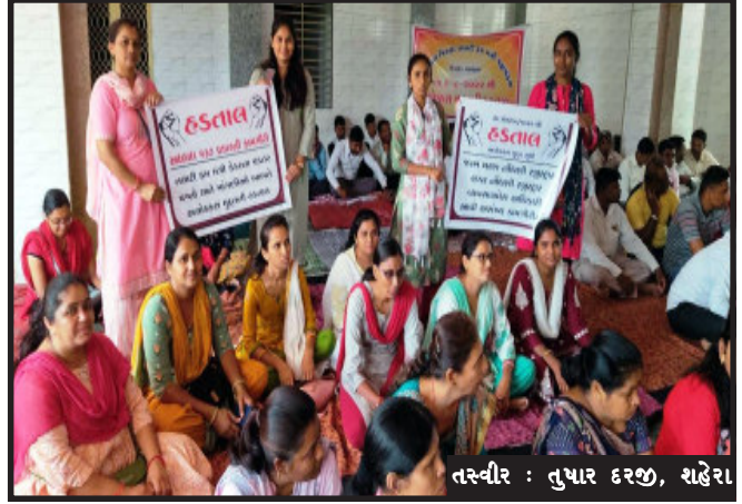
તસ્વીર : લુખાર કરજી, શહેરા

ગોધરા, શહેરા સહિત જિલ્લાના ૨૨૭ જેટલા તલાટી કમ મંત્રીઓ પોતાની પડતર માંગણીઓને લઈને ચાર દિવસથી હડતાલ પર હોવાથી ૫૦૧ ગ્રામ પંચાયતની કામગીરી અટકી ગઈ છે. જ્યારે પોપટપુરા ખોડીચાર મંદિર ખાતે તલાટી કમ મંત્રીઓ વૃક્ષારોપણ, વીઠલવીઠલાની ધૂલ બોલાવીને સરકાર તેમની પડતર માંગણી વહેલી સ્વીકારે તે માટે માતાજીને પ્રાર્થના કરી હતી.