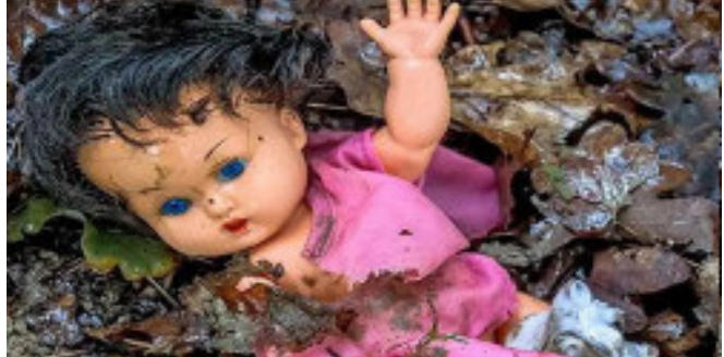
નંબર ૧ પર રહે છે. મહિલા અને બાળ વિકાસ મંત્રાલયના રિપોર્ટ અનુસાર, બાળકોનું સૌથી વધુ યૌન શોષણ થતા રાજ્યોમાં ઉત્તર પ્રદેશનું નામ પ્રથમ સ્થાને છે. તે જ સમયે, બિહાર બીજા નંબર પર છે, જ્યાં ૨૦૧૯ થી જૂન ૨૦૨૨ સુધીમાં બાળકોના યૌન શોષણના ૫૧૧ કેસ નોંધાયા છે. તે જ સમયે, દિલ્હી ત્રીજા નંબરે છે જ્યાં ૪૩૭ કેસ નોંધાયા છે, જ્યારે હરિયાણા ચોથા નંબર પર અને

નવીદિલ્હી, જે બાળકો દેશનું ભવિષ્ય કહેવાય છે, આજે તેમનું બાળપણ ભય અને ગભરાટમાં પસાર થઈ રહ્યું છે. ઓંકડાઓ પર નજર કરીએ તો ખબર પડે છે કે દેશમાં દરરોજ બાળકો યૌન શોષણનો શિકાર બની રહ્યા છે. આ સમસ્યા ઘણી મોટી છે, કારણ કે જે બાળકો બાળપણમાં આવા ગુનાનો શિકાર બને છે, તેઓ તેની આખી જિંદગી ભૂલી શકતા નથી. કલ્પના કરો કે આ ત્યારે થઈ રહ્યું છે જ્યારે આપણા દેશમાં બાળકોના સંરક્ષણને લગતા તમામ કાયદાઓ પહેલાથી જ અસ્તિત્વમાં છે. હકીકતમાં આ મામલે મહિલા અને બાળ વિકાસ મંત્રાલયનો રિપોર્ટ સામે આવ્યો છે. જે મુજબ ૨૦૧૯ થી જૂન ૨૦૨૨ સુધીમાં દેશમાં કુલ ૭,૫૮૫ બાળકો યૌન શોષણનો ભોગ બન્યા છે. તે જ સમયે, ઉત્તર પ્રદેશ ૨૯૭૩ કેસ સાથે