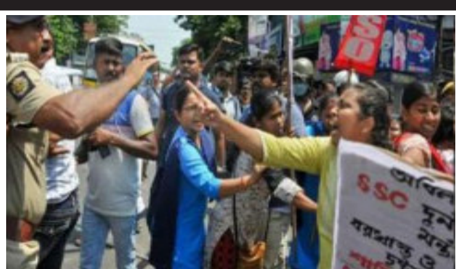
બેનરજીએ પણ આ યુવાનોની મુલાકાત લીધી હતી. એસએસસીની પરીક્ષા ૨૦૧૬માં લેવાઈ હતી. ૨૦૧૭માં પરિણામ આવ્યું તેમાં સિલિગુડીની બીજા તબક્કાના ૭૭ માર્ક મળ્યા. આ દરમિયાન મેરિટ વિસ્તર કરી દેવાયું.

કોલકાતા, પશ્ચિમ બંગાળના હજારો યુવકોએ સરકારી નોકરીનું સપનું જોઈને એસએસસી (સ્કૂલ સર્વિસ કમિશન)ની પરીક્ષા આપી હતી. લાગતું હતું કે જિંદગી સુધરી જશે પણ કૌભાંડના જિને તેમની એવી હાલત કરી મૂકી છે કે ઉમેદવારો ૫૧૦ દિવસથી નોકરી માટે ધરણાં પર બેઠા છે. રાજ્ય સરકાર તેમને આશ્વાસન તો આપી રહી છે પણ યુવાનો નિમણૂકપત્રની માગ કરી રહ્યા છે. તેઓ કોલકાતામાં ગાંધીજીના પૂતળા આગળ ધરણાં પર બેઠા છે. તાજેતરમાં પૂર્વ શિક્ષણમંત્રી પાર્થ ચેટરજીની ધરપકડ બાદ મમતા બેનરજીના ભત્રીજા અભિષેક