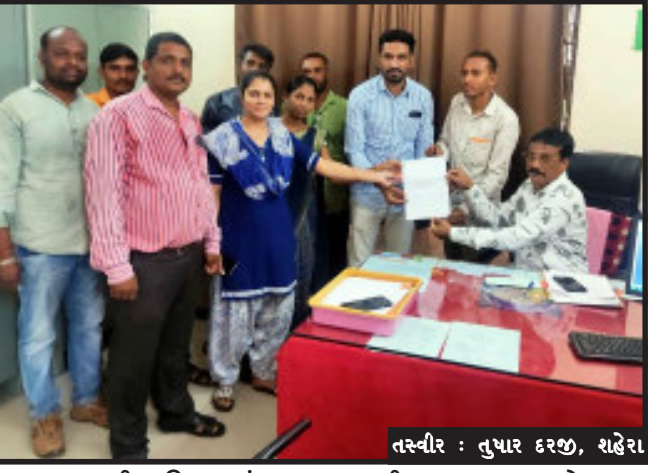
તાલુકાના ગ્રામીણ વિસ્તારમાં ફરજ બજાવતા તલાટી કમ મંત્રીઓ અચોક્કસ મુદતની હડતાલ પર જનાર છે. તાલુકા પંચાયત કચેરી ખાતે ગ્રામ પંચાયતમાં

શહેરા, શહેરા અને મોરવા હડક તાલુકા માં ગ્રામ પંચાયતમાં ફરજ બજાવતા તલાટી કમ મંત્રીઓ પડતર પ્રશ્નો અંગે કોઈ નિરાકરણ ન આપતા મંગળવારના રોજથી ચોક્કસ મુદતને હડતાલ પર જનાર છે. તલાટી કમ મંત્રીમંડળ દ્વારા તાલુકા વિકાસ અધિકારી અને મામલતદારને આવેદનપત્ર આપી તેમની પડતર પ્રશ્નોને લઈને રજુઆત કરી હતી. શહેરા અને મોરવા હડક તાલુકામાં ગ્રામ પંચાયતમાં ફરજ બજાવતા તલાટીઓ ની પડતર પ્રશ્નો અંગે કોઈ નિરાકરણ રાજ્ય સરકાર દ્વારા લાવવામાં નહિ આપતા મંગળવારના રોજ થી