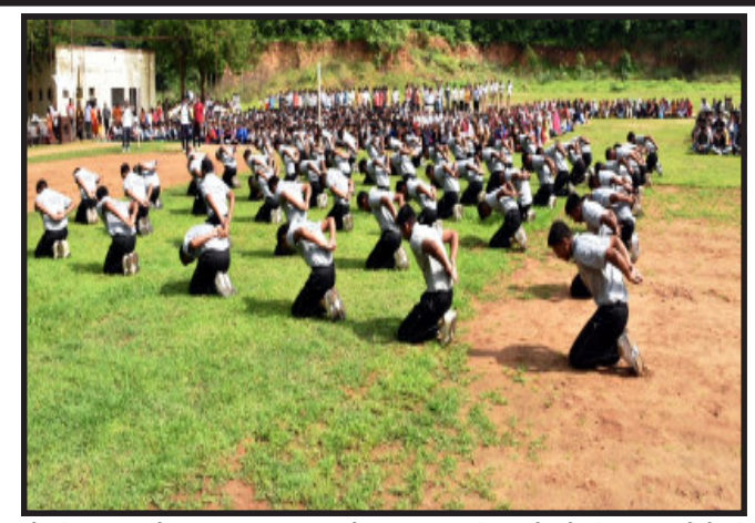
પોલીસ જવાનો દ્વારા રાયફલ કરાટે યોગાનું નિદર્શન કરવામાં આવ્યું હતું. આ નિદર્શન દ્વારા આગામી તા. ૧૩ થી ૧૫મી ઓગસ્ટ દરમિયાન દર ઘરે તિરંગા અભિયાનનો સંદેશો