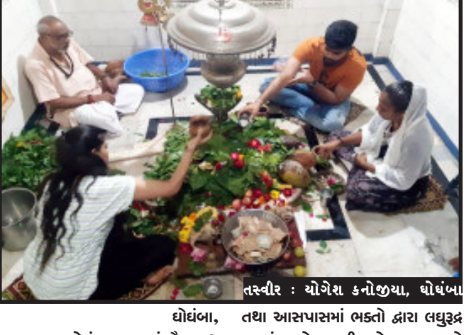
ઘોઘંબા, ઘોઘંબા ગામમાં વૈજનાથ મહાદેવનું ઐતિહાસિક અને પૌરાણિક મંદિર આવેલું છે. આ મંદિરનું મહત્વ થયું હતું કે વર્ષો પહેલા કોઈ પણ વ્યક્તિને શરીરમાં ગમે તે વિમારી આવે તો આ મંદિરે આવીને ભગવાનને પ્રાર્થના કરતા હતા અને ત્યાં તેમનું દુઃખ નાશ થઈ જતું હતું. આ મંદિરે દર વર્ષે શ્રદ્ધાળુ ભક્તો દ્વારા ઉત્સાહપૂર્વક તહેવારોની ઉજવણી કરવામાં આવતી હોય છે. આજે શ્રાવણ માસના સોમવારે ભાવિક ભક્તો દ્વારા મંદિરે શિવલિંગ પર ગાયનું દૂધ, બીલીપત્ર તથા જળ અભિષેક કરી મંત્રોચ્ચારથી વાતાવરણ સુંદર બનાવ્યું છે. ખરેખર આ પૂજા-અર્ચનાની વિધિ જોવા માટેનો એક અદ્ભુત લહાવો તેના જેવો હોય છે. શ્રાવણ માસના તહેવારોમાં ગામના