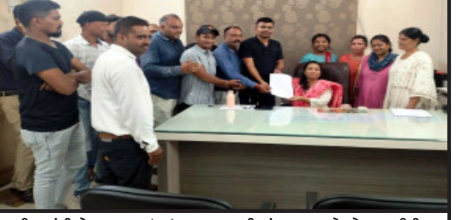
તાલુકાના તમામ તલાટી કમ મંત્રીઓ દ્વારા તા.૭/૮/૨૦૨૨ થી ગ્રામ પંચાયતમાં રાષ્ટ્રવજ પૂર્ણિમાન સન્માન સાથે ફરકાવવાની કામગીરી સિવાયની તમામ કામગીરીનો બંધિતકારની બાંહેધરી આપી હતી જેથી હડતાલ મોકુફ રાખી

કાલોલ, કાલોલ તાલુકાના તમામ તલાટી કમ મંત્રી દ્વારા તા.૨/૮/૨૦૨૨ થી અચોક્કસ મુદતની હડતાલ હેઠળ રાજ્યની તલાટીઓને પડતર પ્રશ્નો નો નિકાલ નહિ આપતા કાલોલ તાલુકાના તમામ તલાટી કમ મંત્રી દ્વારા જિલ્લા વિકાસ અધિકારીને આવેદનપત્ર આપી વિરોધ નોંધાવી આવેદનપત્રમાં જણાવેલ કે તા.૧૩/૮/૨૦૨૨ થી તા.૧૫/૮/૨૦૨૨ સુધી હર ઘર તિરંગા યાત્રા અંતર્ગત ગ્રામ પંચાયતમાં રાષ્ટ્રવજ પૂર્ણિમાન સન્માન સાથે ફરકાવવાની કામગીરી સિવાયની તમામ કામગીરીનો બંધિતકારની બાંહેધરી આપી હતી જેથી હડતાલ મોકુફ રાખી