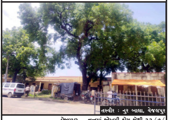
વેજલપુર, કાલોલ તાલુકાના વેજલપુર ગામે આવેલ કુમાર શાળાના કમ્પાઉન્ડ વોલમાં લીમડનું વૃક્ષની ડાળો જોખમીકારક જેથી એસ.એમ.સ. સમિતિના સભ્યોને જાણ કરી સ્કૂલમાં ઠરાવ કરી ઉપલી કક્ષાએ મોબિલ જાણ કરીને જોખમીકારક વૃક્ષની ડાળોની નિકેટન કરવામાં આવી. કુમાર શાળાના આચાર્ય દ્વારા જણાવ્યા પ્રમાણે લીમડાના વૃક્ષ જેની ડાળો ચોમાસાની