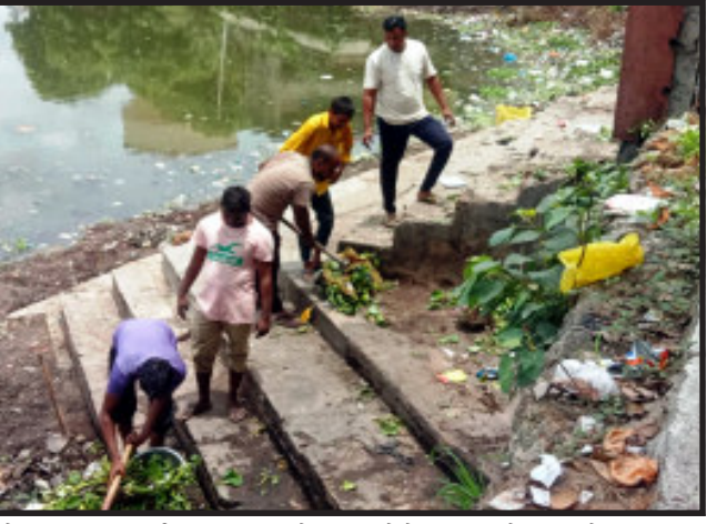
ગોધરા, ગોધરા શહેરમાં નગરપાલિકા દ્વારા મહત્વનો નિર્ણય લેવામાં આવ્યો છે. જેમાં છેલ્લા બે વર્ષથી કોરોના મહામારીના કારણે જાહેર તળાવોમાં મૂર્તિ વિસર્જન કરવા માટે રોક લગાવવામાં આવી હતી. પરંતુ આ પખતે સરકાર દ્વારા નિયમોનો કોઈ બંધી નહીં હોવાના કારણે આ વર્ષે ગોધરા શહેરનાં મધ્યમ આવેલા રામ સાગર તળાવમાં દશામાતાની મૂર્તિનું વિસર્જન કરવામાં આવશે. જેના કારણે ગોધરા નગરપાલિકાનાં પ્રમુખના નિર્ણયને ગોધરાના નગરજનોએ આવકાર્યો છે.

ગોધરા, ગોધરા શહેરમાં નગરપાલિકા દ્વારા મહત્વનો નિર્ણય લેવામાં આવ્યો છે. જેમાં છેલ્લા બે વર્ષથી કોરોના મહામારીના કારણે જાહેર તળાવોમાં મૂર્તિ વિસર્જન કરવા માટે રોક લગાવવામાં આવી હતી. પરંતુ આ પખતે સરકાર દ્વારા નિયમોનો કોઈ બંધી નહીં હોવાના કારણે આ વર્ષે ગોધરા શહેરનાં મધ્યમ આવેલા રામ સાગર તળાવમાં દશામાતાની મૂર્તિનું વિસર્જન કરવામાં આવશે. જેના કારણે ગોધરા નગરપાલિકાનાં પ્રમુખના નિર્ણયને ગોધરાના નગરજનોએ આવકાર્યો છે. રામસાગર તળાવ ખાતે આગોતરું આયોજન કરવામાં આવ્યું. પંચમહાલ જિલ્લા સહિત ગોધરા શહેરમાં દશામાતાની પ્રતિમાનું વિસર્જન કરવામાં આવશે. જેના કારણે ગોધરા નગરપાલિકાનાં પ્રમુખના નિર્ણયને ગોધરાના નગરજનોએ આવકાર્યો છે. રામસાગર તળાવ ખાતે આગોતરું આયોજન કરવામાં આવ્યું. પંચમહાલ જિલ્લા સહિત ગોધરા શહેરમાં દશામાતાની પ્રતિમાનું વિસર્જન કરવામાં આવશે. જેના કારણે ગોધરા નગરપાલિકાનાં પ્રમુખના નિર્ણયને ગોધરાના નગરજનોએ આવકાર્યો છે.