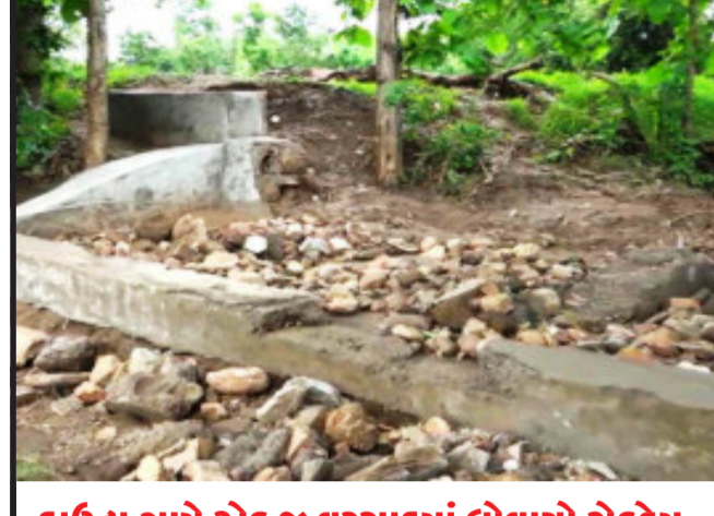
દાઉદ્રા ગામે એક જ વરસાદમાં ઘોવાચો ચેકડેમ.

જાગૃત નાગરિકને થાય તે કરી લે એવો જવાબ આપતા હોવાનું સામે આવ્યું છે. જેને લઈ રાણીપુરા ગામના લોકો દ્વારા હલ્કી ગુણવત્તાની કામગીરી ગામમાં માત્ર સરપંચ અને કોન્સ્ટ્રક્ટર નહીં પણ તાલુકા વિકાસ અધિકારી સહિતનો સ્ટાફ પણ આવા ભ્રષ્ટાચારના ભાગીદારી ધરાવતા હશે તેવા સવાલો ઉભા કર્યા છે. તેમજ ચેકડેમની હલ્કી ગુણવત્તાના બાંધકામ અંગે તાલુકા વિકાસ અધિકારી અને જીલ્લા વિકાસ અધિકારીને બાંધકામ અટકાવવા રજુઆત કરાઈ છે.